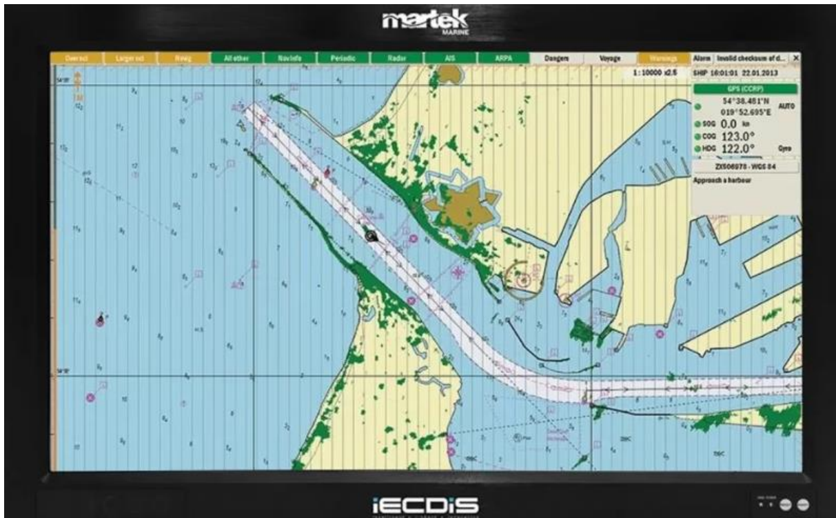
Slika 2. ECDIS