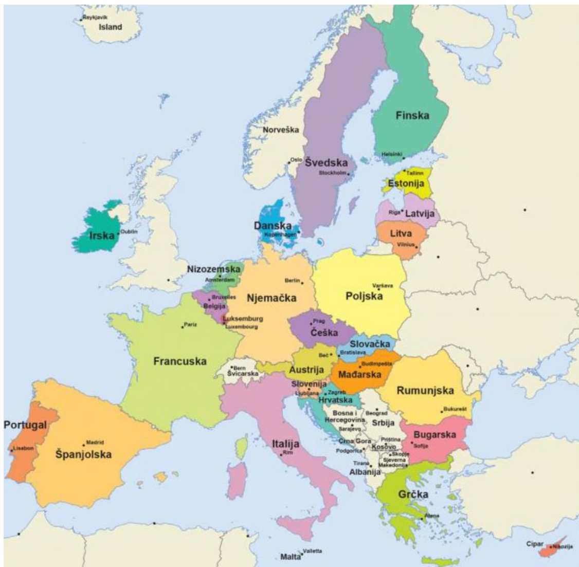
Slika 11. Zemlje EU i BiH potencijalni kandidat