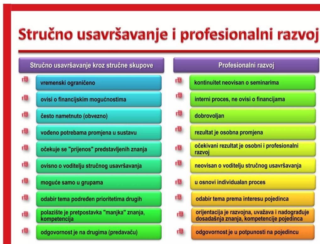
Slika 1. Prikaz razlike između profesionalnog razvoja i stručnog usavršavanja (Hargreaves i Fullan 1992, Hržica 2010)

Prema Lučić (2007) „organizatori su stručnog usavršavanja voditelji vrtićkih i županijskih stručnih vijeća, vrtićki pedagog i ravnatelj, Ministarstvo znanosti, odgoja i obrazovanja, Agencija za odgoj i obrazovanje, Učiteljski fakulteti te sve češće i pojedine stručne udruge građana zainteresirane za razvoj odgojne djelatnosti.“