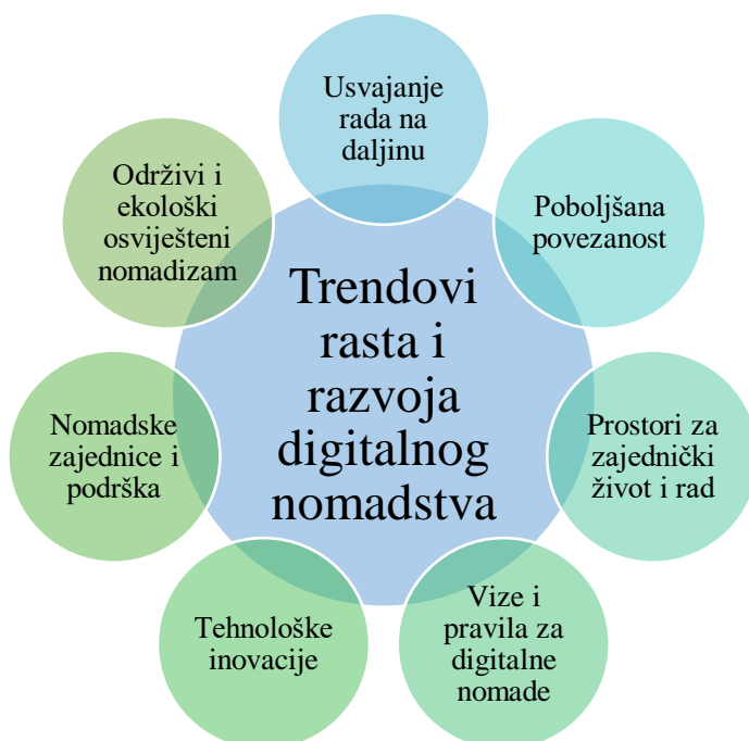
Slika 5. Trendovi rasta i razvoja digitalnog nomadstva