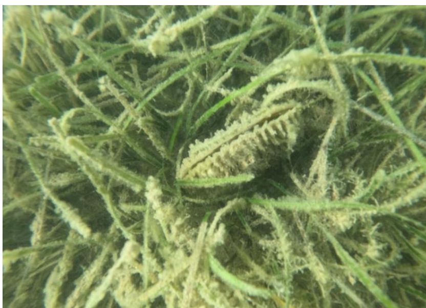
Slika 9. Živa jedinka periske u blizini sela Sukošan

Prema informacijama građana, na lokaciji Sukošan pronađena je živa jedinka P. nobilis koja se nadzire svaki mjesec te je još živa (Sveučilište u Zadru, 2023.).