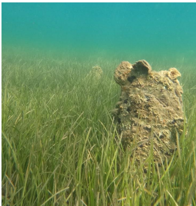
Slika 8. Prazna ljuštura P. nobilis u blizini Selina

Prije događaja masovne smrtnosti, veliki broj periski bio je prisutan u zaljevu Sakarun (Dugi otok). S obzirom da se radi o lokaciji koja je okrenuta prema otvorenom moru, ova lokacija je bila jedna od prvih pogodnih masovnom smrtnosti na srednjem dijelu Jadrana. U ljeto 2019. godine, sve jedinke P. nobilis u zaljevu Sakarun su uginule (Sveučilište u Zadru, 2023.).