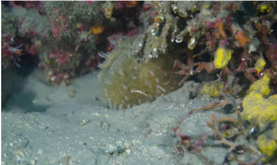
Slika 6. Novootkrivena periska kod Banjole

Morski.hr prenosi vijesti o pronalasku žive periske u moru kod Banjole na 17 metara dubine (URL 4).