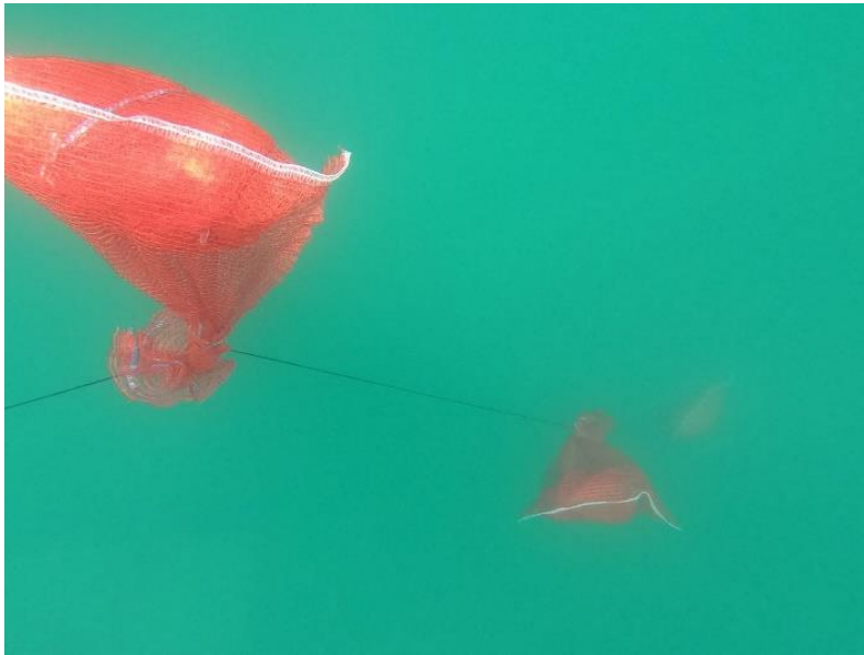
Slika 7. Kolektori postavljeni u južnom dijelu Velebitskog kanala

godine. Kako su kolektori postavljeni na područjima gdje se nalaze bogate populacije školjkaša, uočeno je mnogo juvenilnih jedinki različitih školjkaša. Nijedna jedinka P. nobilis nije pronađena (Sveučilište u Zadru, 2023.).