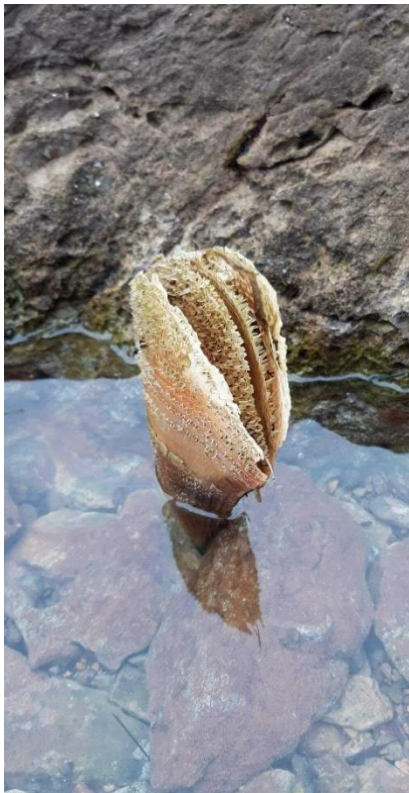
Slika 5. Izrasla periska iz periske (URL 1, slikao Vedran Petešić)

Mišel Kalajžić u novinskom članku Zadarski hr. prenosi da je u mjestu Sali na Dugom otoku nedavno je pronađena nova periska nastala iz mrtvog oklopa (URL 1)