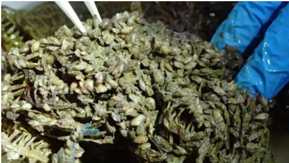
Slika 3. Vreća iz uvale Javorike koja je bila smještena na plitkoj dubini, skoro u potpunosti prekrivena invazivnim školjkašem Anadara transversa , (slikala: Tatjana Bakran-Petricioli).

Jedan od kolektora u uvale Luka je u potpunosti nestao, a ostala dva su teško pogođena invazivnom vrstom Styela plicata (Bakran-Petricioli i sur., 2023.).