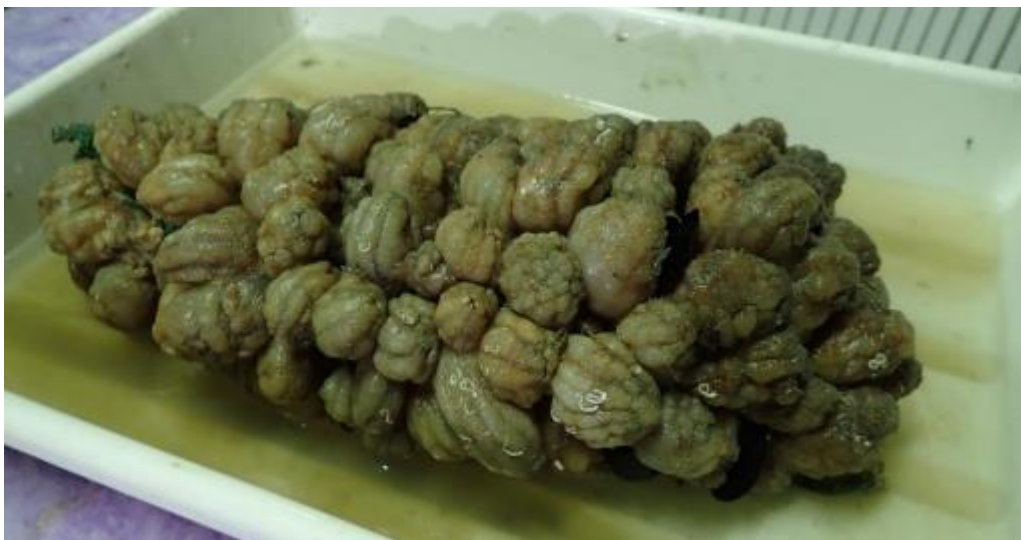
Slika 4. Kolektorska vreća iz uvale Luka u potpunosti prekrivena invazivnom vrstom Styela plicata (Lesueur, 1823.)

Jedan od kolektora u uvale Luka je u potpunosti nestao, a ostala dva su teško pogođena invazivnom vrstom Styela plicata (Bakran-Petricioli i sur., 2023.).