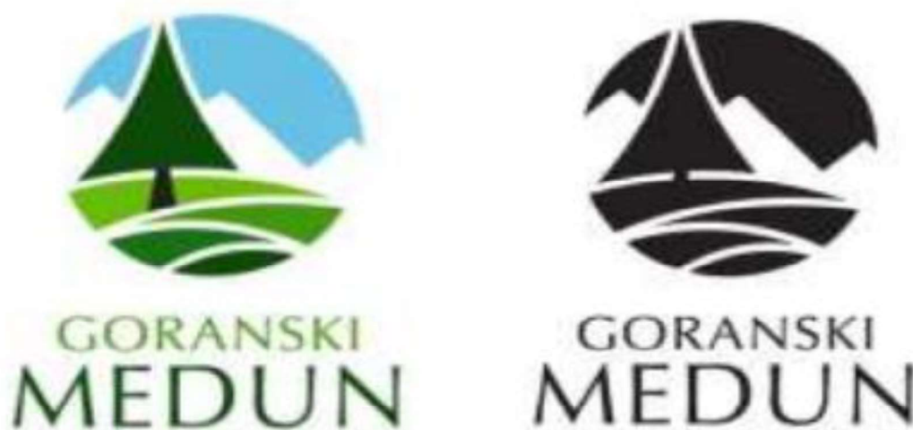
Slika 5: Logo oznake izvornosti Goranski medun