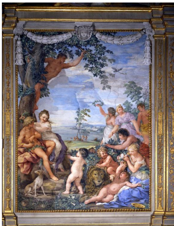
Slika 3. Zlatno doba (Sala della Stufa), 1637., palača Pitti, Firenca