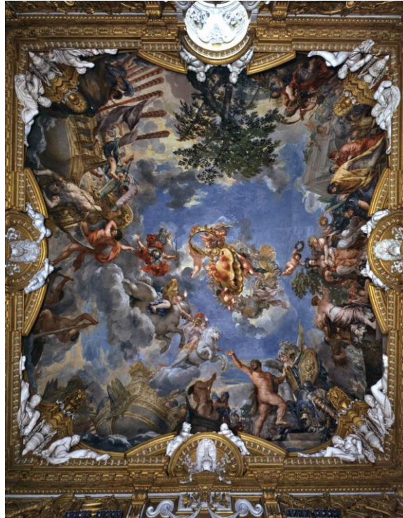
Slika 9. Sala di Marte, 1643.-44., palača Pitti, Firenca