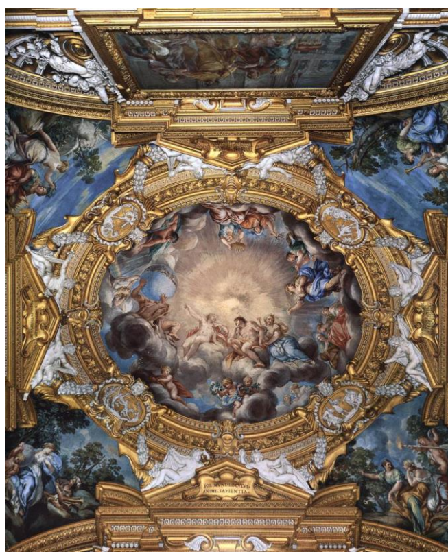
Slika 8. Sala di Apollo, 1647-59., palača Pitti, Firenca