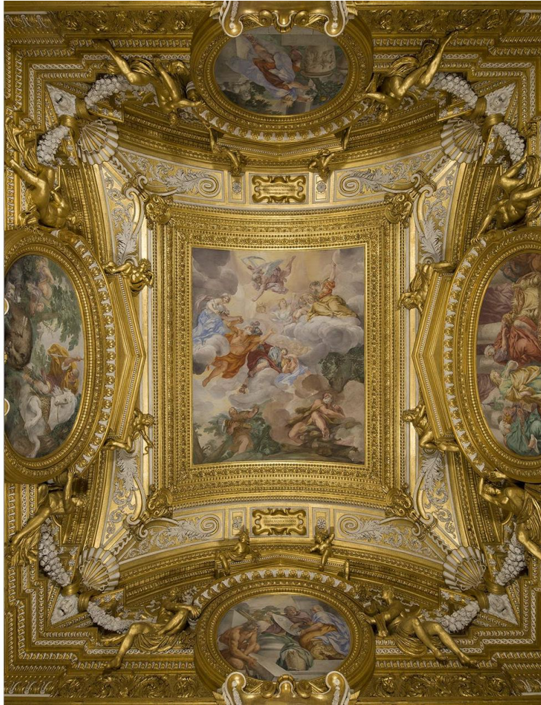
Slika 11. Sala di Saturno, 1663-65., palača Pitti, Firenca