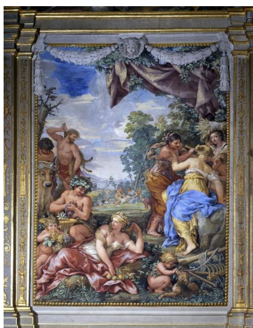
Slika 4. Srebrno doba (Sala della Stufa), 1637., palača Pitti, Firenca