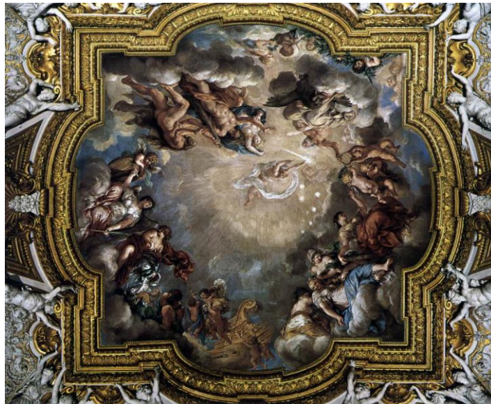
Slika 10. Sala di Giove, 1643-44., palača Pitti, Firenca