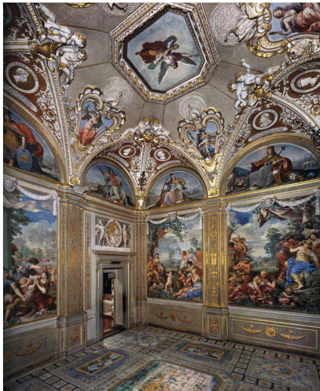
Slika 2. Sala della Stufa, 1637.-1641., palača Pitti, Firenca