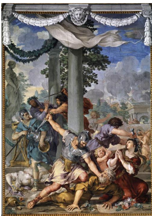
Slika 6. Željezno doba (Sala della Stufa), 1641., palača Pitti, Firenca