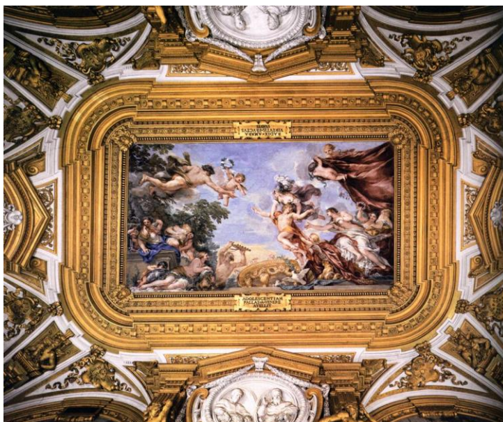
Slika 7. Sala di Venere, 1642., palača Pitti, Firenca