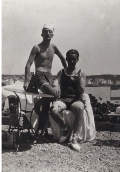
Figura 3: “Salvador Dalí y Federico García Lorca. Cadaqués, verano de 1927”