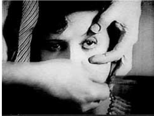
Figura 9: escena de la película Un chien andalou

diversos poemas de Poeta en Nueva York reaparecen alusiones a los ojos y a los objetos punzantes, a menudo junto a manos dañadas (ibid.: 527). Según la tradición aristotélica que ha recogido Johansen, “en el interior de un ojo es donde específicamente reside la esencia del alma” (ibid.), lo que nos lleva a la opinión de García-Posada de que “la destrucción de los ojos simboliza el triunfo de la muerte” y que, efectivamente, Lorca “por medio de estas imágenes de desgarramiento ocular, expresa la trascendencia de la muerte y el doloroso amor que produce la pérdida” (ibid.: 529.).