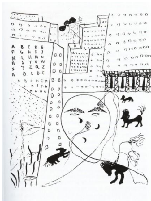
Figura 4: Lorca, Autorretrato en Nueva York 1