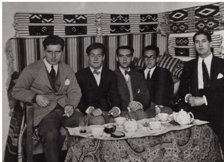
Figura 7: “Federico García Lorca junto a Emilio Prados, Pepín Bello y amigos tomando té en una de las habitaciones de la Residencia de Estudiantes. Madrid, 1924”

La Residencia de Estudiantes en Madrid era institución dedicada al desarrollo personal de individuos de varias capacidades con el deseo de contribuir a la construcción de una España europea, tolerante y abierta al mundo, con una influencia sobre la vida política, moral e intelectual que sería difícil de exagerar, donde Lorca había llegado en 1919 (Gibson 2021: 75) y donde entabló estrechas relaciones con poetas (por ejemplo, Ángel del Río, Amado Alonso, Guillermo de Torre, Pedro Salinas, Gerardo Diego, algunos de ellos igual que Lorca pertenecían a la Generación del 27) y artistas del momento; cabe destacar a Salvador Dalí, igual que a Luis Buñuel (ibid.: 82).