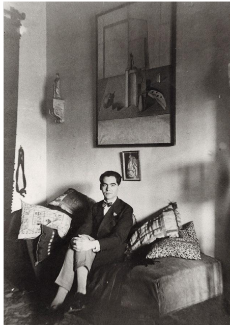
Figura 8: “Federico García Lorca en su casa de Granada bajo el óleo "Naturaleza muerta" regalo de Salvador Dalí. 1925”

pero Lorca no quedó convencido (Romero-González 2012: 525).