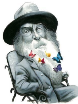
Figura 2: Walt Whitman, ilustración de Fernando Vicente

“Agonía, agonía, sueño, fermento y sueño. Este es el mundo, amigo, agonía, agonía. Los muertos se descomponen bajo el reloj de las ciudades. La guerra pasa llorando con un millón de ratas grises, los ricos dan a sus queridas pequeños moribundos iluminados, y la vida no es noble, ni buena, ni sagrada.” (García Lorca 2014: 265)