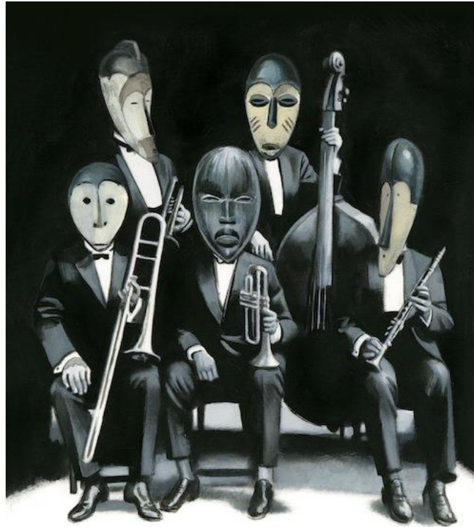
Figura 6: Ilustración de Fernando Vicente.

a tu gran rey prisionero, con un traje de conserje.” (García Lorca 2014: 117)