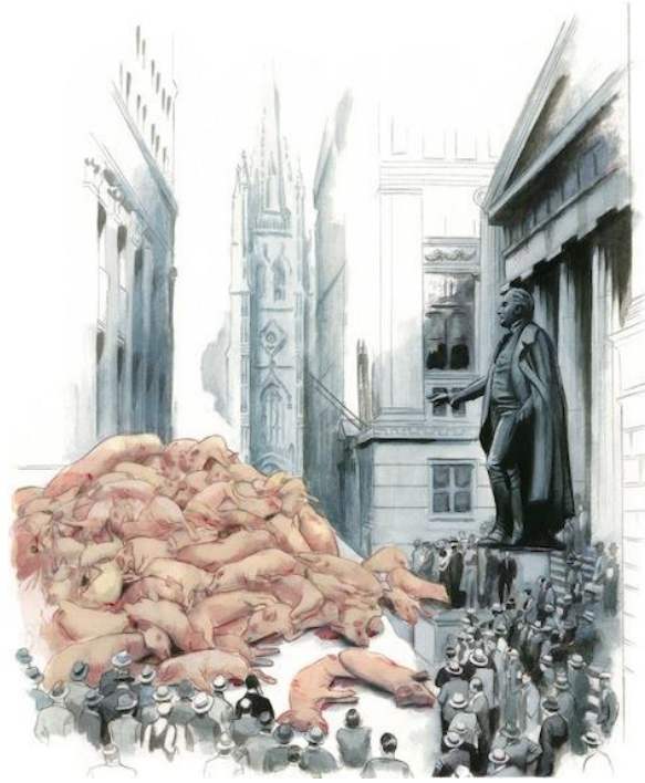
Figura 5: Ilustración de Fernando Vicente

Esta experiencia poética del Infierno no es solamente “una aventura que tiene lugar más allá de la muerte, sino en plena vida” (Cañas 1994: 91). En la obra de Lorca, la simbología bíblica del Paraíso y del Infierno se transforma en un Paraíso e Infierno psicológicos (igualmente como es el caso en gran parte de la cultura occidental), donde los sufrimientos o los placeres son la materialización de estos extremos (ibid.).