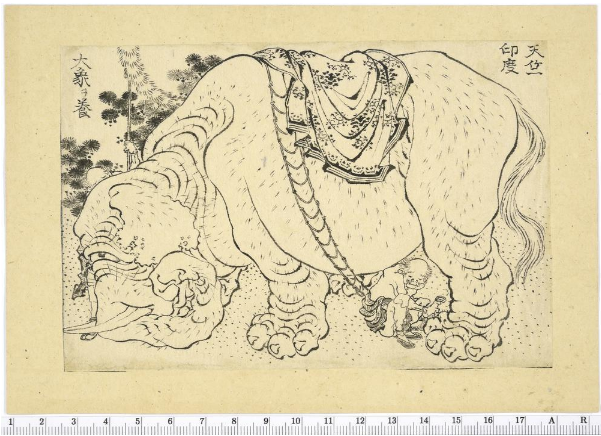
6. Slon sa dva timaritelja