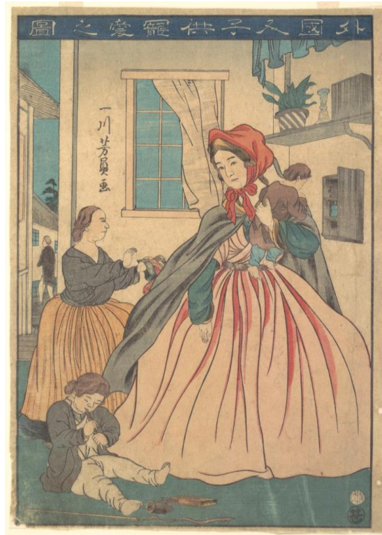
11. Yoshikazu, Strankinja grli dijete , ( Gaikokujin kodomo choai no zu ), 1860.