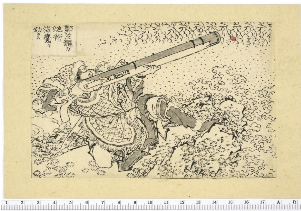
3. Zheng Zhilong prijeti morskom čudovištu