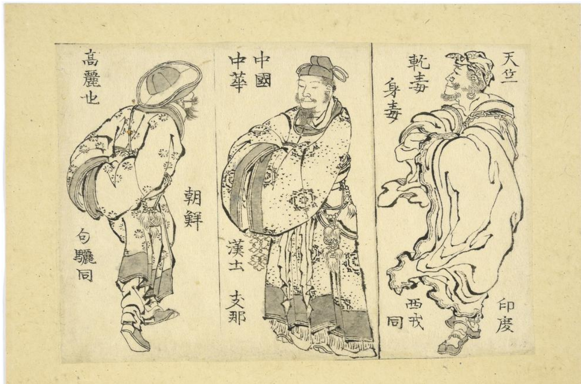
1. Hokusai, 'The great picturebook of everything' - Muškaarci iz Koreje, Kine i Indije, 1820.-1840., British Museum, London.