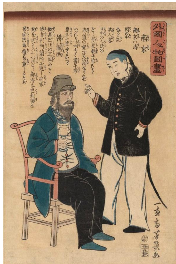
13. Yoshiiku, Figure stranaca , ( Gaikoku jinbutsu zuga ), 1862.