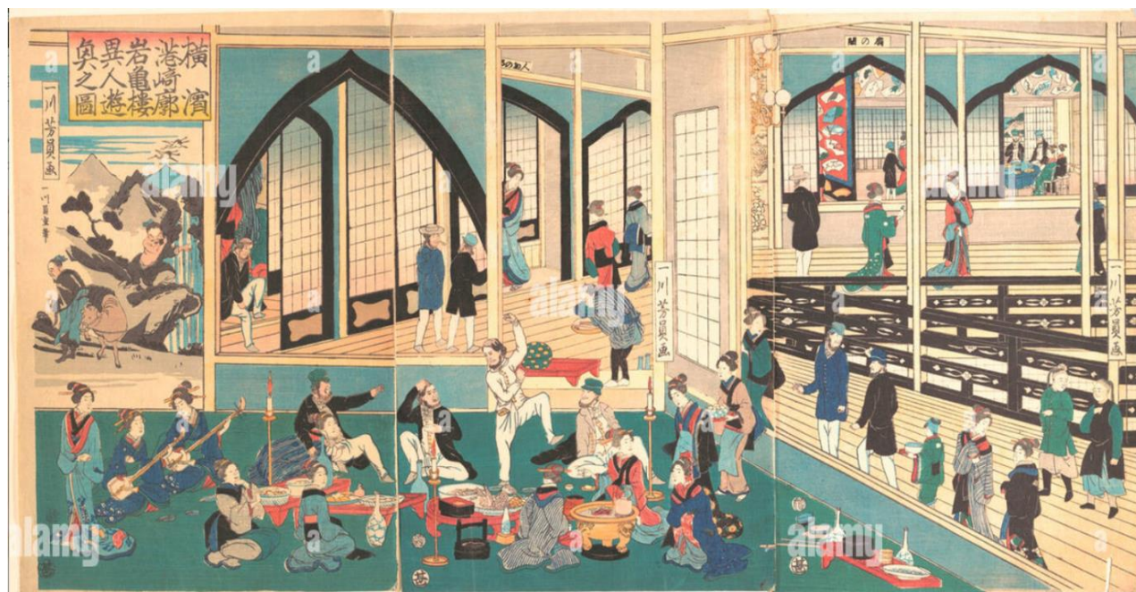
16. Yoshikazu, Veselje u Ganikru ( Yokohama miyozaki-kaku Gankiro ijin yukyo no zu ), 1861.