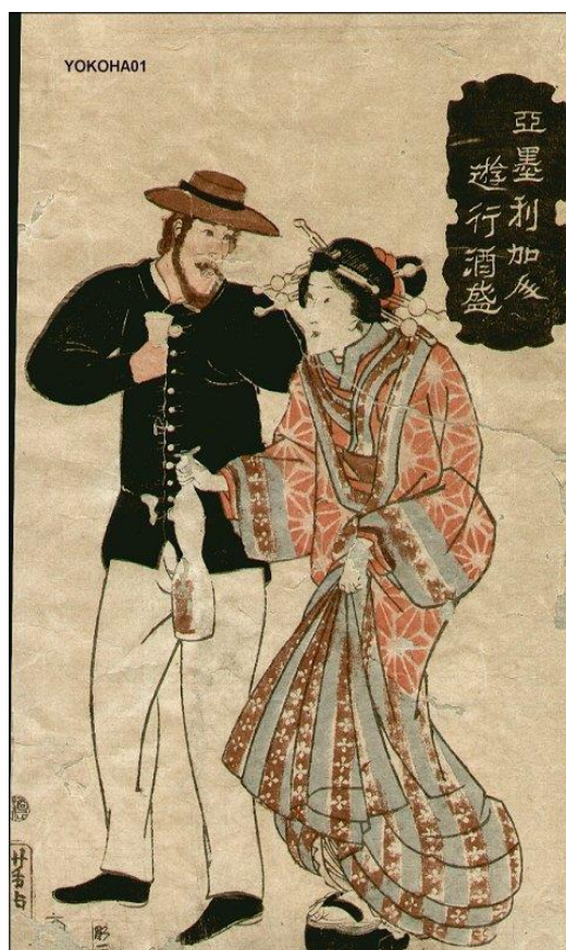
15. Yoshitora, Amerikanac pije ( Amerikajin yuko sakamori ), 1861.