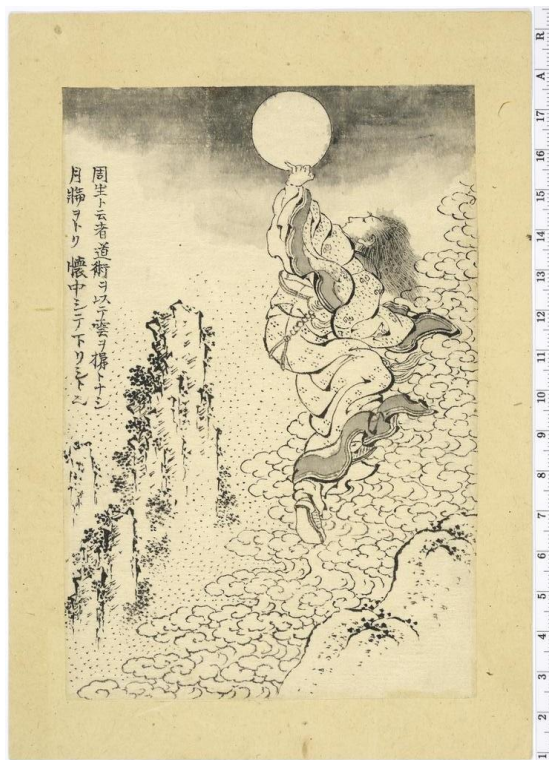
2. Zhou Sheng se uspinje oblacima na Mjesec