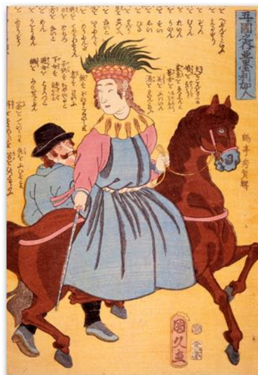
12. Kunihisa, Među pet nacija, Amerikanci ( Gokukoku no uchi: Amerikajin ), 1860. (izvor: philamuseum.org)