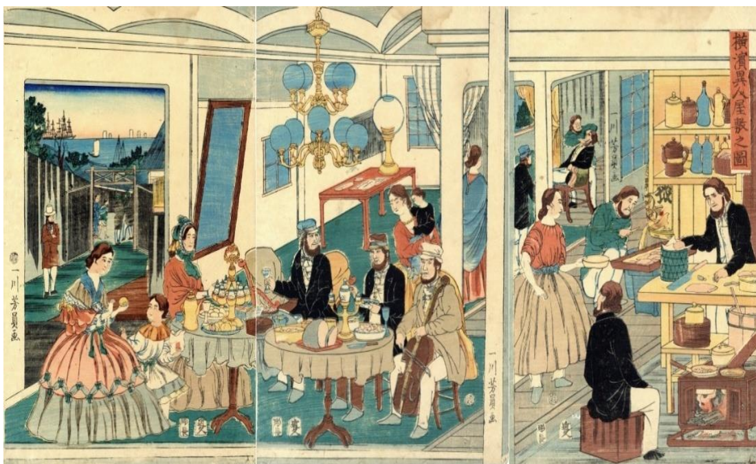
9. Yoshikazu, Prebivalište stranaca , ( Yokohama ijin yashiki no zu ), 1861-2.