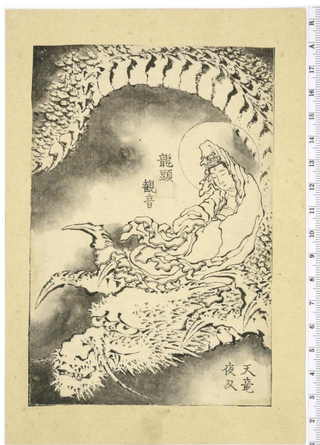
4. Budističko božanstvo Avalokitesvara