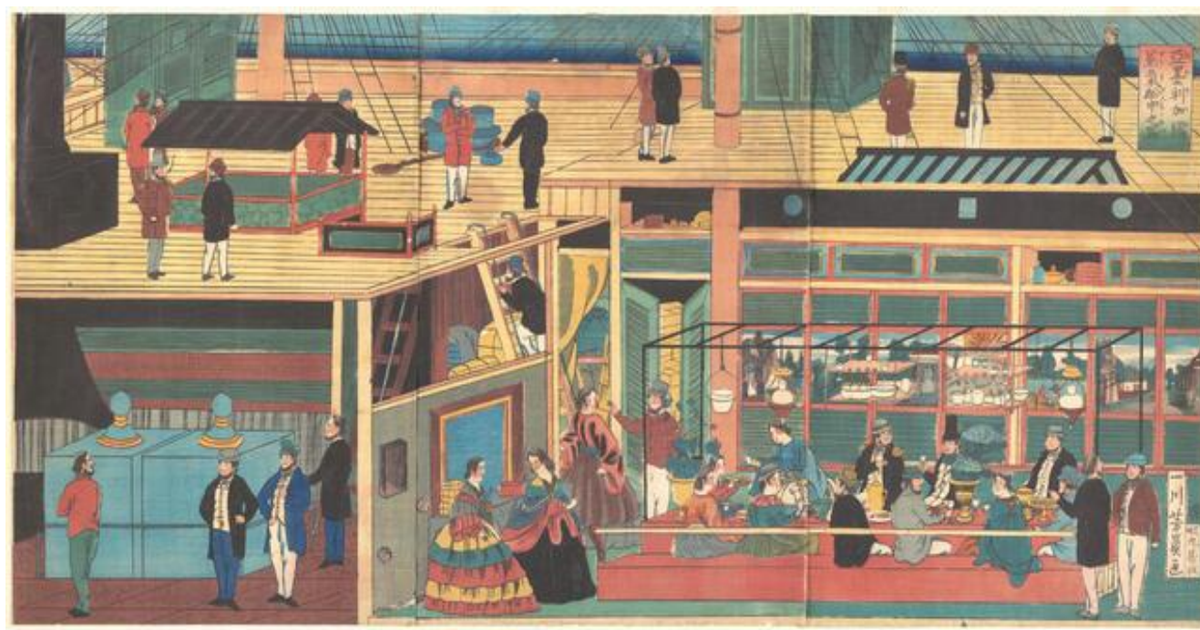
8. Yoshikazu, Unutrašnjost američkog parobroda, (Amerikakoku jokisen no naka no zu), 1861. (izvor: artelino.com)