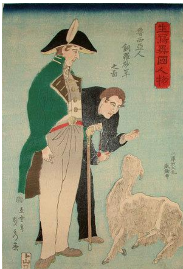
10. Sadahide, Rus hrani ovcu , ( Roshiajin rashayo kau no zu ), 1860.