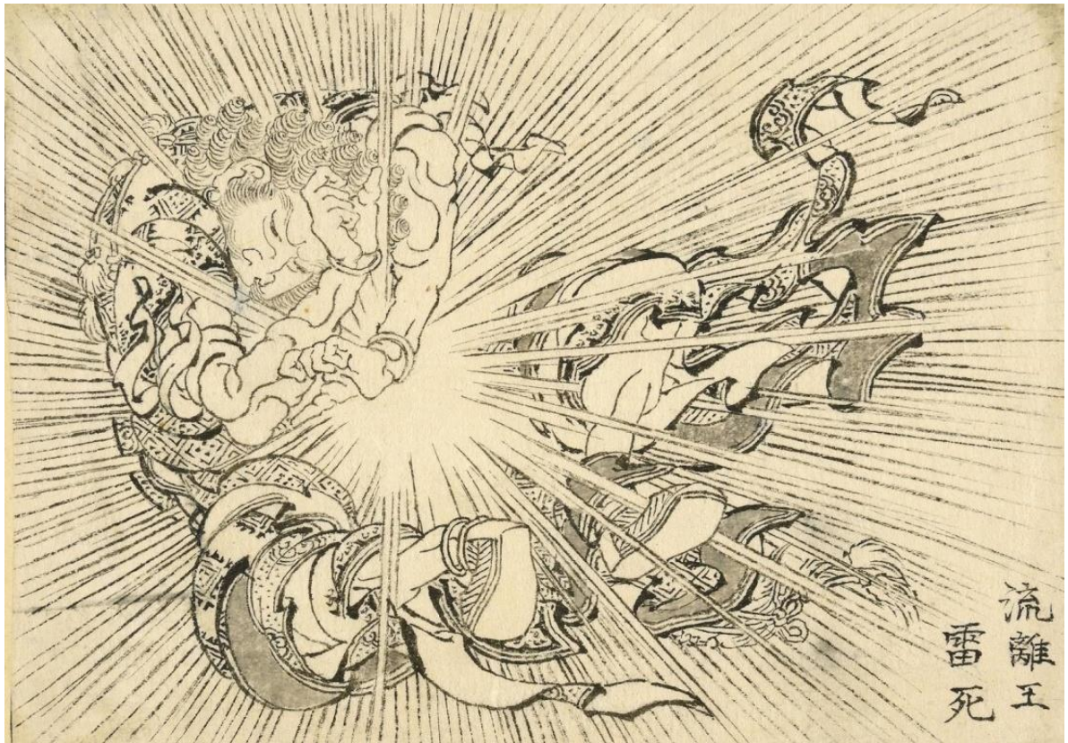
5. Grom ubija Virudhaka