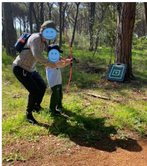
Slika 2. Tjelesno vježbanje s roditeljima u prirodi

trčanje gdje djeca sa svojim roditeljima obavljaju zadatke od starta sve do cilja na kojemu ih čeka diploma i voće.