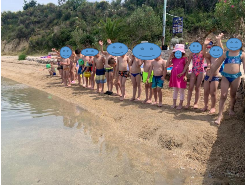
Slika 4. Ljetni kamp s „Lopticom“