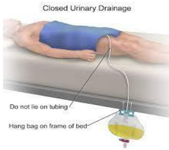
Slika 3 Ispravan položaj urinarne vrećice