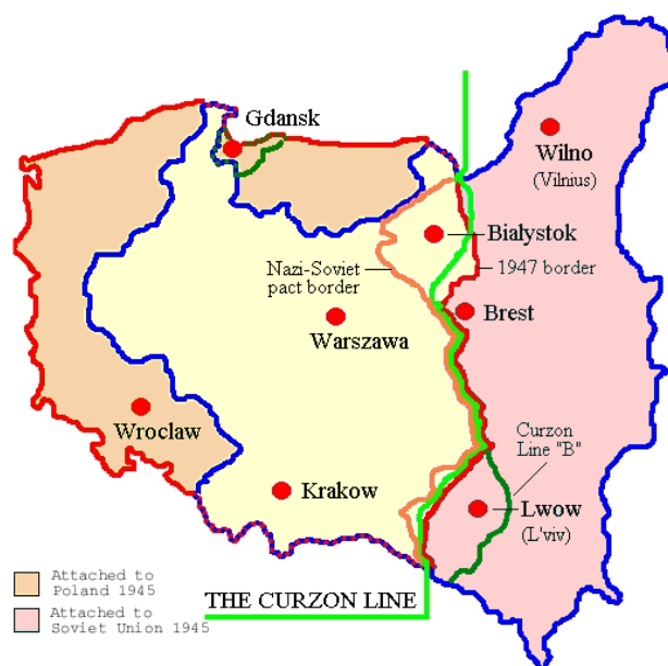
Slika 3. Granice Poljske prije i poslije Drugog svjetskog rata

Velika Trojka je jednoglasno izrazila želju ka nezavisnoj Poljskoj, ali ne iz istih razloga. Churchill je težio politički nezavisnoj Poljskoj jer je Velika Britanija proglasila rat Njemačkoj zbog Poljske. Britanci su nezavisnost Poljske smatrali činom časti, pa je ona imala veliku važnost za britansku delegaciju. Staljin je htio da Poljska bude svojevrsna tampon zona između SSSR-a i Srednje Europe, no nije ju htio podjarmiti kao i carevi prije njega. 55