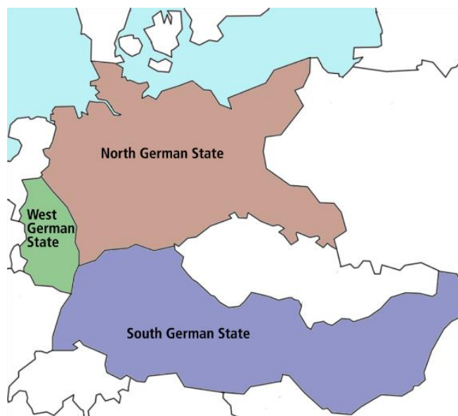
Slika 2. Churchillov plan o poslijeratnoj Njemačkoj