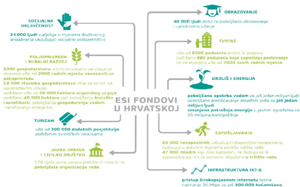
Slika 1 Cjelokupna slika gdje bi se Hrvatska trebala naći do 2020. godine

Slika 1 prikazuje očekivane ciljeve odnosno rezultate za koje je planirano da budu financirani iz sredstava za potporu hrvatskog društveno-gospodarskog razvoja, odnosno gdje bi se po pojedinim parametrima Republika Hrvatska trebala naći do 2020. godine.