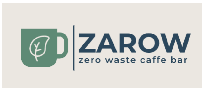
Slika 6 Službeni logo poduzeća

izvješćima poslovanja, sadržavati će menu, cjenik i informacije o lokalnim proizvođačima pojedinih sastojaka. Osim toga, sadržavati će i mali blog o savjetima kako pravilno odvajati otpad, štedjeti energente, živjeti zero waste , izrađivati DIY projekte kod kuće, a imati će i opciju ostavljanja komentara, pitanja ili recenzija na posjet. Za kreaciju sadržaja web stranice zadužena je vlasnica, dok programeri nekoliko puta godišnje brinu o održavanju sustava. Službeni logo ZAROW-a uz pozadinsku boju web stranice je sljedeći: