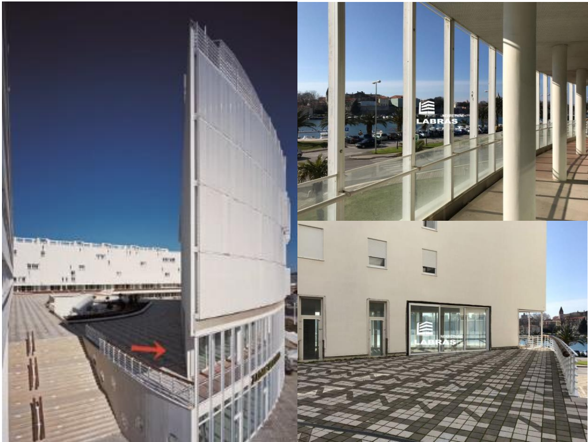
Slika 1 Odabrani poslovni prostor za ZAROW