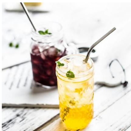
Slika 7 Estetika zero waste usluživanja napitaka i objava na društvenim mrežama