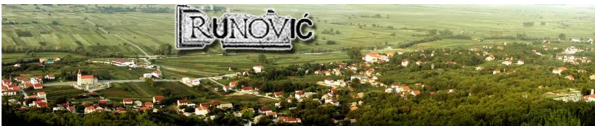
Slika 3. Runovići

O ovoj dvojbi piše i Šimundić koji navodi kako se do kraja 2. svjetskog rata pisalo Runovići , a administrativnim postupkom to se mijenja u Runović . On smatra kako ime Runovići dolazi od osobnog prezimena Runović koji je nastao od apelativa runo , pa pretpostavlja kako je motivacija za prezime povezana s mekoćom i bjelinom ovčje vune (Šimundić 1989: 494). O tome piše i Gudelj (2001), naglašavajući kako je ova analogija s runom novijeg postanka, ali da objedinjuje plemensko-porodično ime i ime sela.