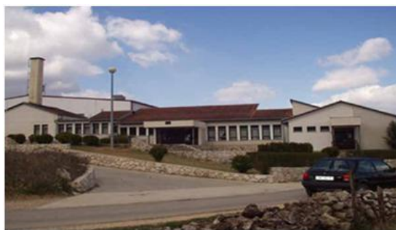
Slika 14. Nova škola na Kamenjima