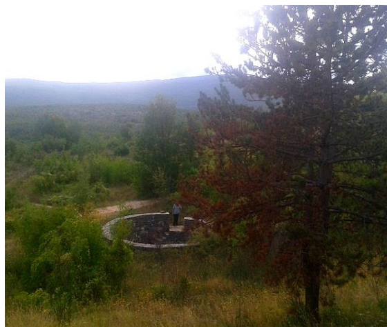
Slika 8. i Slika 9. Obnovljeni Radičevac na Umljanima