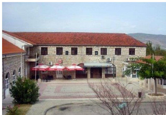
Slika 11. Dom kulture i trg fra Mije Runovića

Sredinom pedesetih godina runovička mladost je bila na okupu pod okriljem kulturno umjetničkog društva „Ivan Babić“ koja je poticala mlade da sudjeluju u dramskim i sportskim sekcijama (Bitanga 2001).