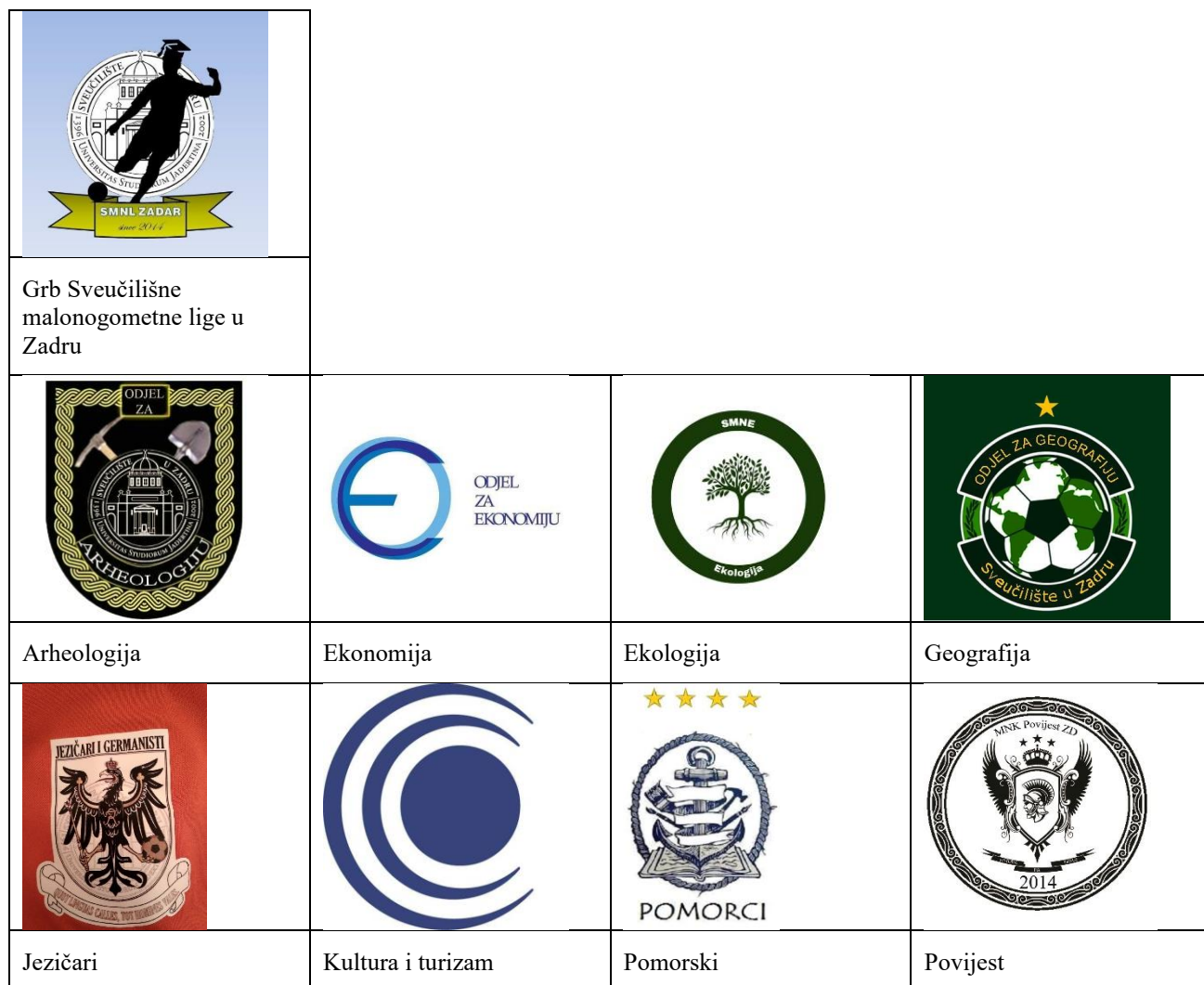
Slika 2. Grbovi SMNL-a i odjela koji su igrali Ligu 2023. godine.