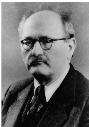
Slika 3. Andrija Štampar

1921. godine zbog potrebe otvaranja antituberkuloznih dispanzera, otvorena je škola za medicinske sestre u Hrvatskoj. Školu su pohađale učenice koje su završile četiri razreda srednje škole. 1947. godine zbog povećane potrebe za medicinskim sestrama se otvaraju škole za sestre u Rijeci, Osijeku, Splitu i Šibeniku, a 1948. godine i u Vrapču. Školovanje za medicinske sestre je trajalo tri godine, te se 1948. godine školovanje produžuje na četiri godine. Kako bi osigurali stručnost medicinskih sestara u Školi narodnog zdravlja se organizira postdiplomsko osposobljavanje medicinskih sestara. Zalaganjem profesora Andrije Štampara (slika 3.) otvara se Viša škola za medicinske sestre. Obrazovanje traje tri godine. (2)