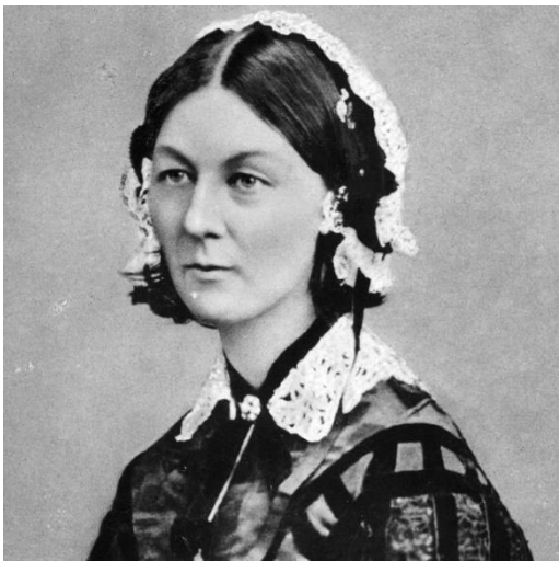
Slika 2. Florence Nightingale

1840. godine Florence Nightingale (slika 2.) se educira o uređenju bolnica i pružanju pomoći bolesnim osobama. Od 1849. godine do 1853. godine putuje Egiptom, Njemačkom i Francuskoj gdje upotpunjuje znanje o zdravstvenoj njezi bolesnika. 1853. godine se vraća u Englesku gdje postaje nadstojnica Zavoda za primanje gospođa za vrijeme njihove bolesti. 1855. godine odlazi u Scutaru sa 38 medicinskih sestara gdje organizira rad sestara te smanjuje smrtnost sa 42% na 2%. 1860. godine u Londonu u sklopu St. Thomas Hospital se otvara prva škola za obrazovanje medicinskih sestara po nalogu Florence Nightingale. 1859. godine objavljuje udžbenik „Notes on nursing.“ (2)