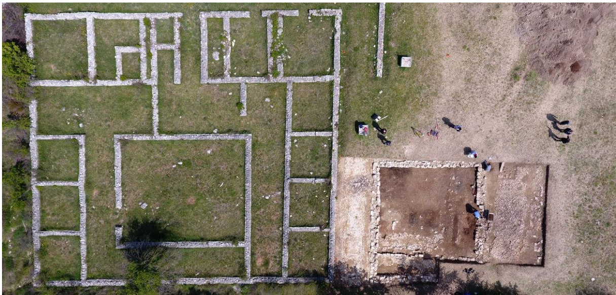
Slika 12 Rimski vojni logor Bigeste