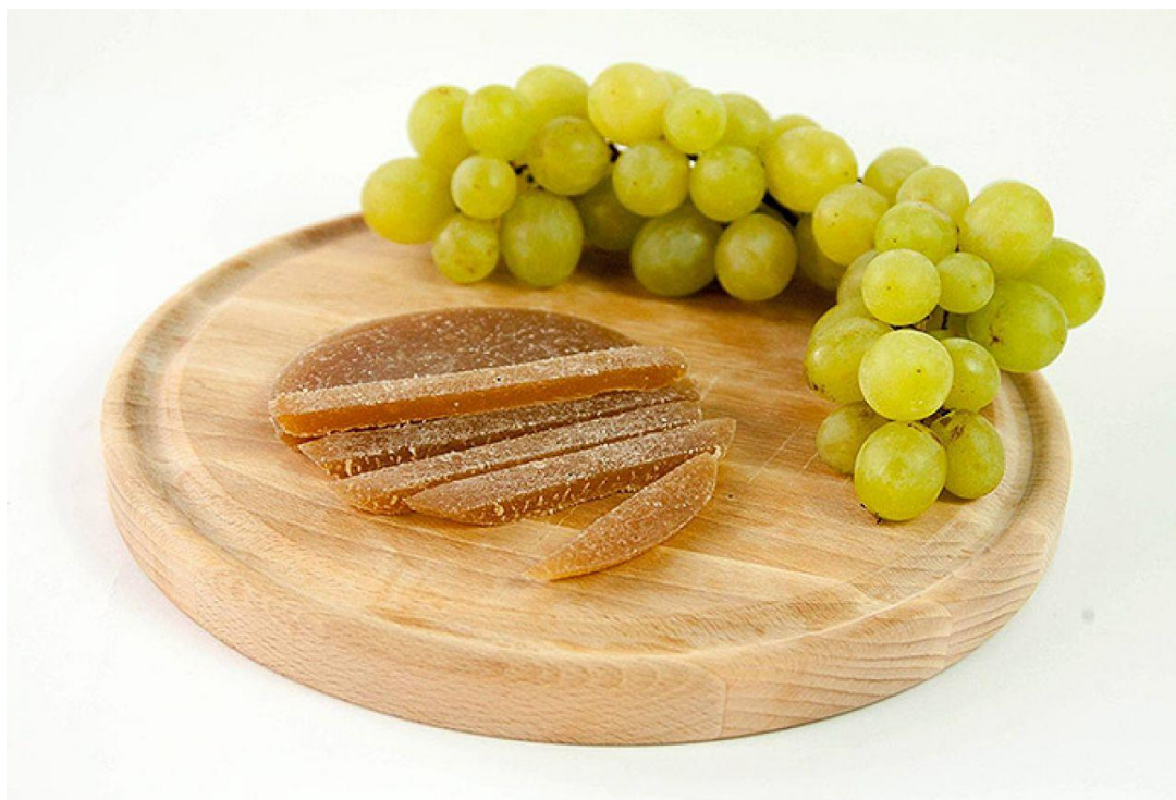
Slika 7 Čufter