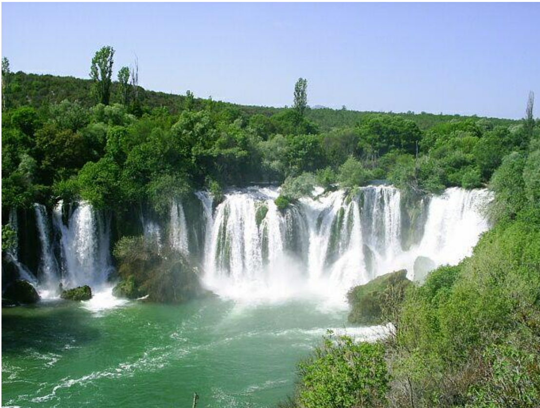
Slika 11 Vodopad Kravica