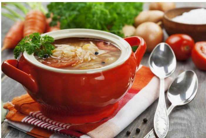
Slika 4 Kalja