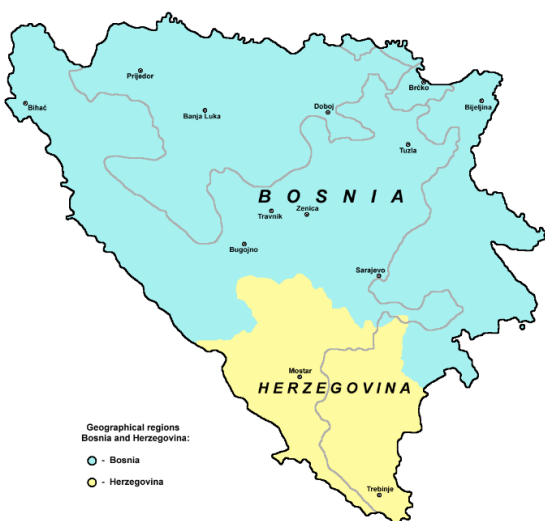
Slika 1 Geografske regije Bosne i Hercegovine