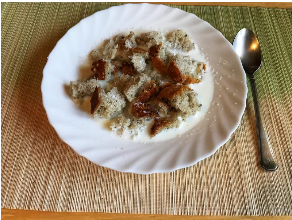
Slika 6 Droba

Izvor: https://likaclub.eu/kruv-nas-hercegovacki/ , (10.11.2022)