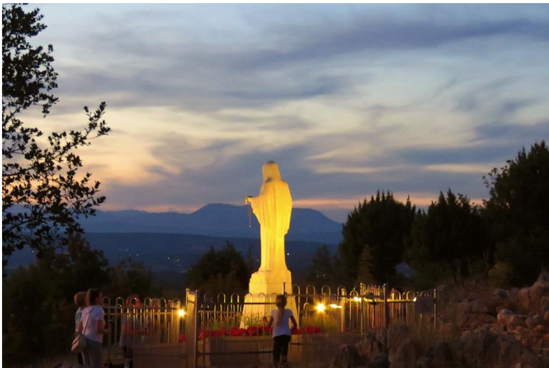
Slika 13 Podbrdo