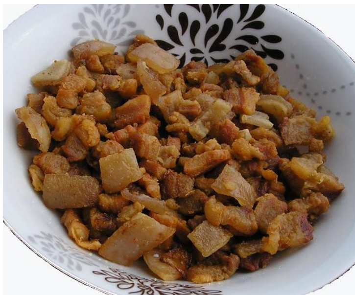
Slika 9 Čvarci