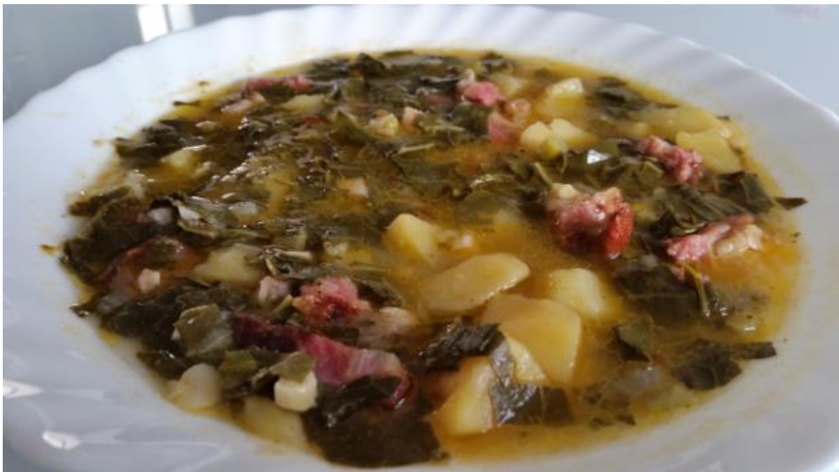
Slika 5 Raštika