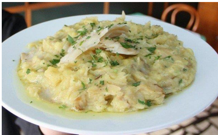
Slika 3 Bakalar na bijelo