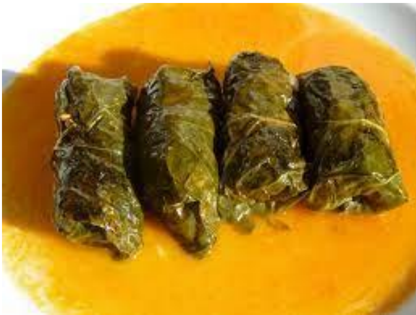
Slika 2 Japrak