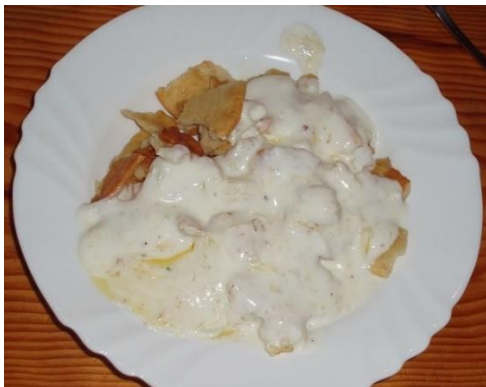
Slika 8 Lučenica