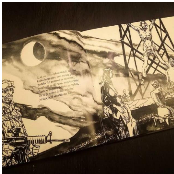
Slika 3. Ilustracija i tekst u slikovnici Superstar (2018.)

Tekst i ilustracije su u svakoj slikovnici vrlo usklađene. Svaka ilustracija prati tekst (primjer Slika 3.), ali i da nema teksta preko ilustracije bi se poanta shvatila, što je rezultat kvalitetne slikovnice. Autori teksta su napisali vrlo jasno što su htjeli reći, pa i one slikovnice s narječjima i pisane u žargonu su jasne i razumljive čitatelju. Sadržaj u slikovnicama je neprimjeren djeci, ali nezačuđujuć obzirom da se radi o slikovnicama za odrasle. Sami podnaslov koji je otisnut na naslovnici svake slikovnice „slikovnica za odrasle“ jasan je signal da ovu knjigu ni po čemu ne bi trebalo ponuditi ili čitati – djeci (Slika 4.).