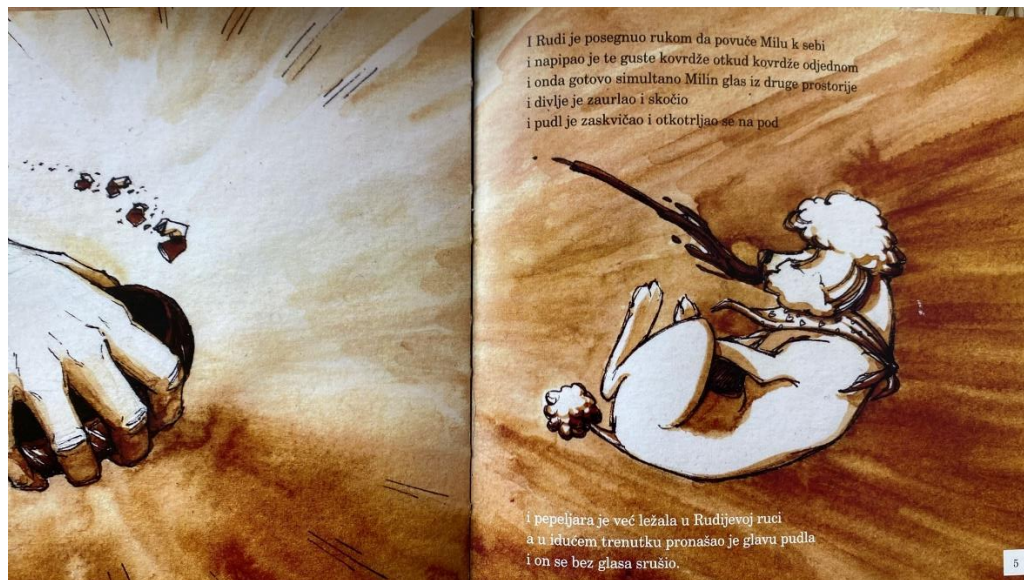
Slika 4. Tekst i ilustracija iz slikovnice Pudl (2020.)

Tekst i ilustracije su u svakoj slikovnici vrlo usklađene. Svaka ilustracija prati tekst (primjer Slika 3.), ali i da nema teksta preko ilustracije bi se poanta shvatila, što je rezultat kvalitetne slikovnice. Autori teksta su napisali vrlo jasno što su htjeli reći, pa i one slikovnice s narječjima i pisane u žargonu su jasne i razumljive čitatelju. Sadržaj u slikovnicama je neprimjeren djeci, ali nezačuđujuć obzirom da se radi o slikovnicama za odrasle. Sami podnaslov koji je otisnut na naslovnici svake slikovnice „slikovnica za odrasle“ jasan je signal da ovu knjigu ni po čemu ne bi trebalo ponuditi ili čitati – djeci (Slika 4.).