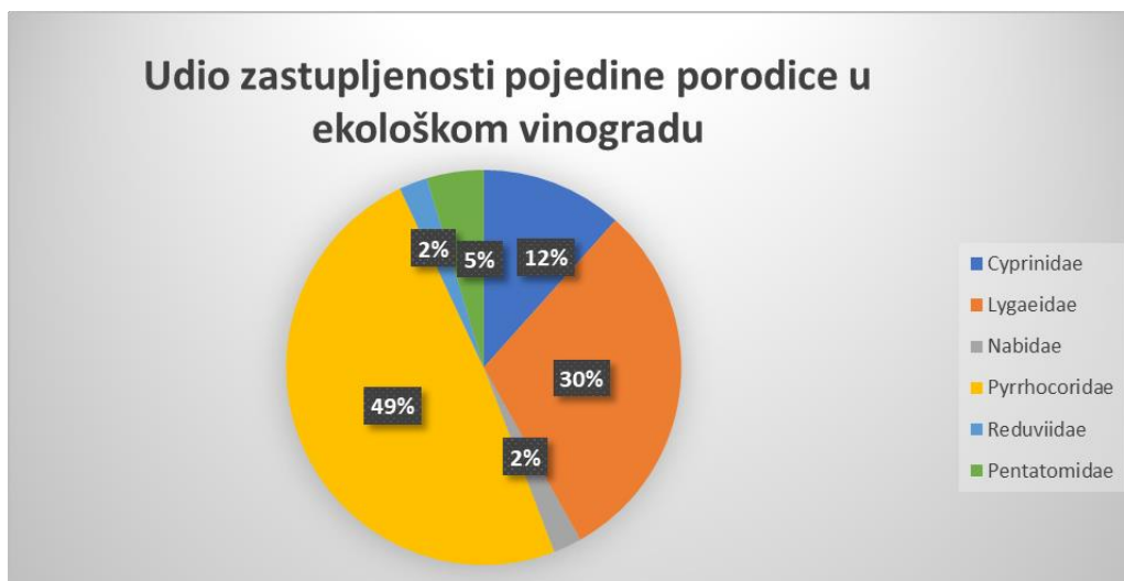
Graf 3. Udio zastupljenosti pojedine porodice u ekološkom vinogradu