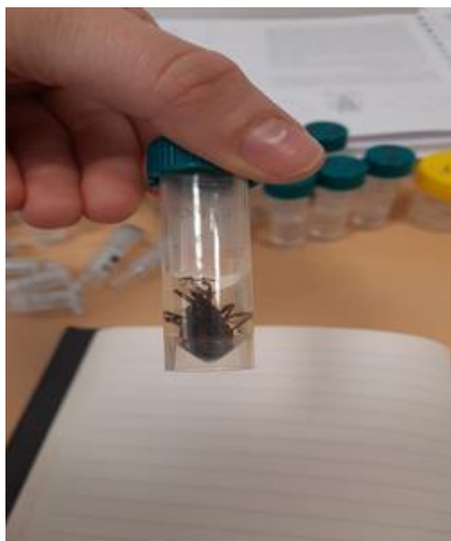
Slika 2. Posuda sa 80%-tnim alkoholom s uzrokom stjenice