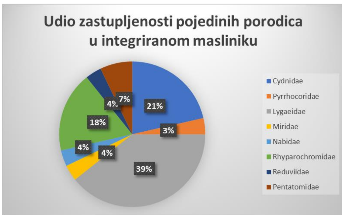
Graf 4. Udio zastupljenosti pojedine porodice u integriranom masliniku

U grafu 4. prikaz je udjela zastupljenosti pronađenih porodica stjenica integriranog masliniku sakupljenih metodom lovni posuda i metodom otresanja. Iz grafa se može vidjeti da najzastupljenija porodica je Lygaeidae s 39%, zatim slijede porodice Cydnidae 21%, Rhyparochromidae 18%, Pyrrhocoridae 7%, Miridae, Nabidae i Reduviidae 4%, a najmanje zastupljena porodica je Pentatomidae 3%.