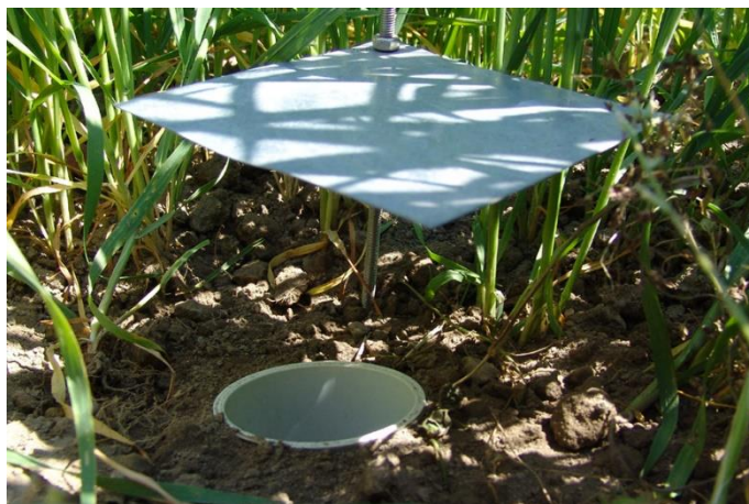
Slika 1. Lovna posuda

hvatača, tako da se ispod grane postavlja entomološka mreža. Zatim se grana udara štapom (3 kratka i 3 brza udarca), a u mrežu padaju prisutni kukci (Durbešić i sur. 2018).