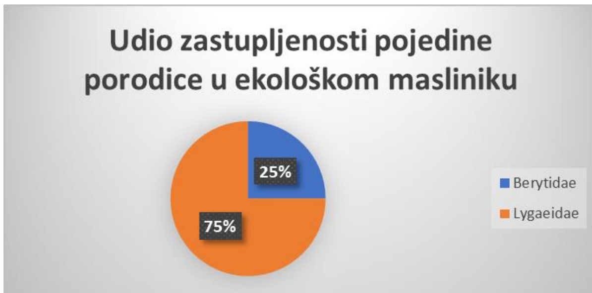
Graf 5. Udio zastupljenosti pojedine porodice u ekološkom masliniku

U grafu 5. prikaz je udjela zastupljenosti pronađenih porodica stjenica ekološkog maslinika sakupljenih metodom lovni posuda i metodom otresanja. Iz grafa je vidljivo kako u ekološkom masliniku dominira porodica Lygaeidae.