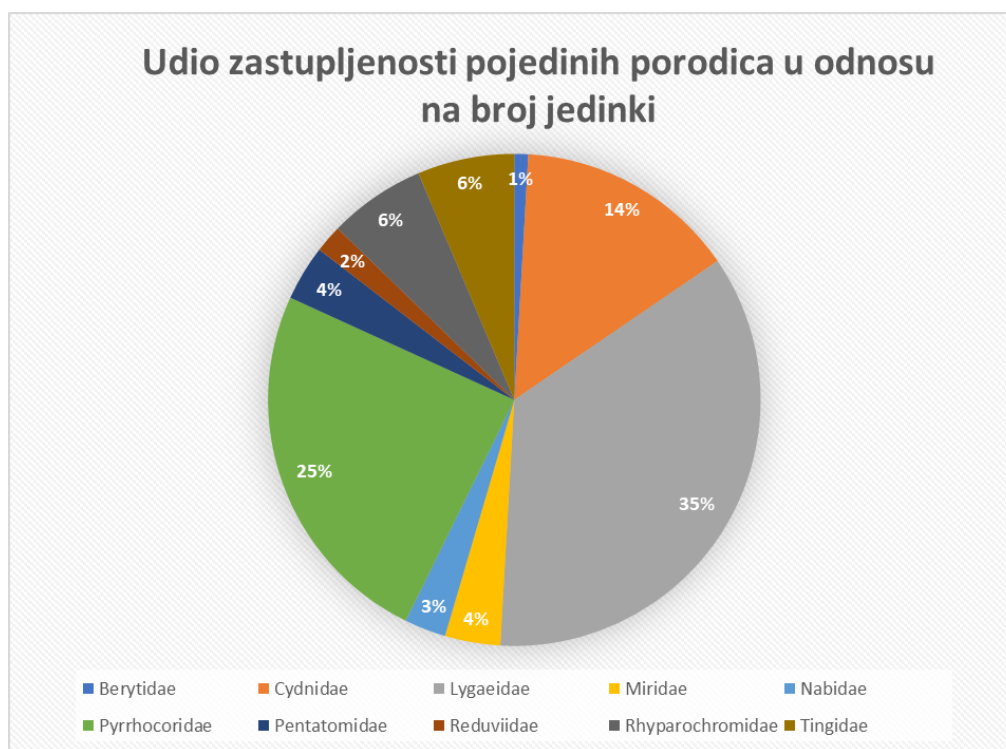
Graf 1. Postotni udio jedinki po porodicama

U grafu 1. prikaz je udjela zastupljenosti pronađenih porodica ovog istraživanja sakupljenih metodom lovnih posuda i metodom otresanja. Najzastupljenija porodica je Lygaeidae s 35%, zatim slijede porodice Pyrrhoridae s 25%, Cydnidae 14%, Tingidae i Rhyparochromidae 6%, Pentatomidae i Miridae 4%, Nabidae 3%, Reduviidae 2%, a najmanje zastupljena porodica je Berytidae sa svega 1%.