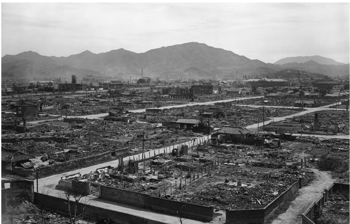
Slika 5. UN-ova zračna kampanja rezultirala je potpunim uništenjem sjevernokorejskih gradova i industrije

djelovanja bila su ograničenih razmjera, zbog toga što su obje strane bile iscrpljene, a borbe su nastavljene na brežuljcima od velikih strateških važnosti, kao što su: Stari Baldy, Jane Russell, Bijeli Konj i tzv. Brežuljak 122, koji se nalazi u blizini Panmunjoma, kojeg je američka vojska okupirala i dala mu nadimak 'Bunker Hill'. 31 Tijekom prosinca 1952. godine budući američki predsjednik Dwight D. Eisenhower u sklopu predsjedničke kampanje obišao je bojišta na korejskom poluotoku, te je izjavio kako je jedan od njegovih glavnih ciljeva završiti korejski rat. 32