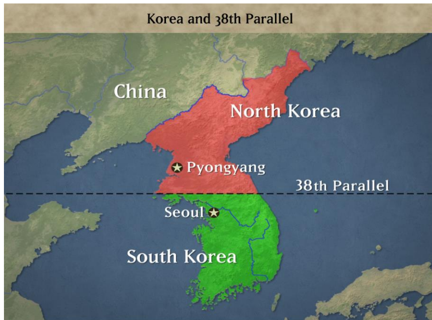
Slika 1. Karta koja prikazuje Sjevernu i Južnu Koreju prije početka rata

žrtvama. Ovo će biti samo jedan od razloga zbog kojeg će Sjeverna Koreja objaviti rat Južnoj, uz kontekst da žele zaštititi stanovništvo od južnokorejskog terora. 11