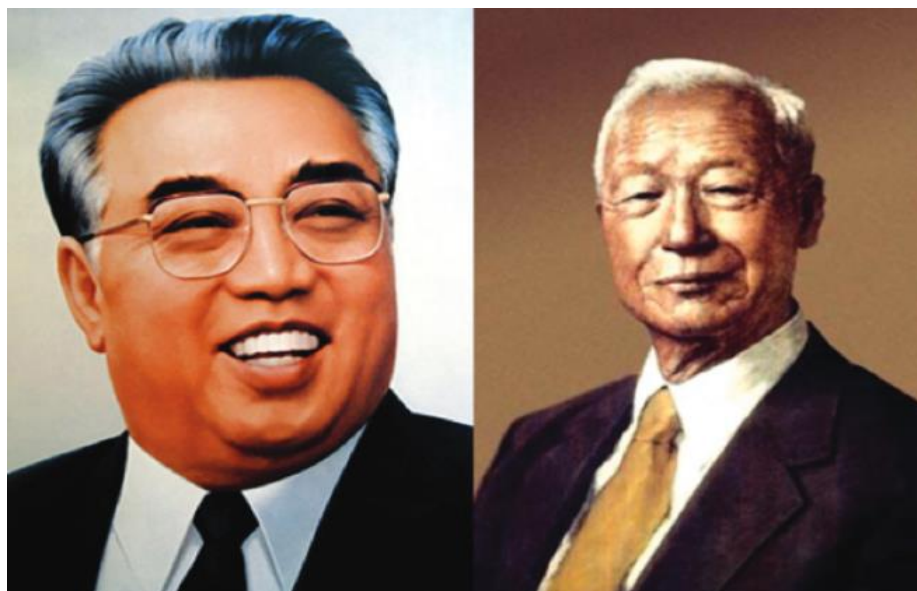
Slika 2. Kim Il-sung (lijevo) i Syngman Rhee (desno)

uspješno testirali atomsku bombu, Amerikanci su se povukli s poluotoka, te komunisti vođeni Mao Ce-tungom pobjeđuju u kineskom građanskom ratu, no Kim nije želio objaviti rat bez Staljinovog pristanka. Stoga su početkom 1950. u Moskvi tijekom ožujka i travnja održani sastanci između Staljina, Mao Ce-tunga i Kim Il sunga u kojima je odlučeno da će Kina pružati punu vojnu pomoć u slučaju da Sjeverna Koreja naiđe na probleme. Ovom odlukom postavljena je pozornica za rat između Sjeverne i Južne Koreje. Prije početka rata Sjeverna Koreja imala je više od 100.000 vojnika koji su svoje vojno iskustvo stekli u kineskom građanskom ratu, a naoružanje je pružao Sovjetski Savez, koji je na Sjevernu Koreju gledao kao na Istočnu Njemačku. Obje države pretežito su ovisile o SSSR-u, te su postojale isključivo kako bi proširile geopolitičke interese SSSR-a. Odluka o invaziji na Južnu Koreju, ostavila je trajne posljedice na DNR Koreju, rezultirajući ogromnim vojnim i civilnim žrtvama, te kolapsom industrije. 14