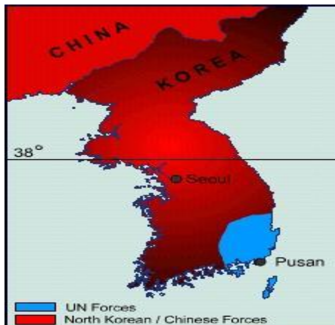
Slika 4. Stanje na korejskom poluotoku 1950. god. prije dolaska UN-ovih snaga

vojnici imali su značajne gubitke, oko 60.000 vojnika izgubilo je svoje živote kako bi se u što kraćem roku došlo do grada Pusan. Pod vodstvom generala Kim Chaeka sjevernokorejska vojska bombardira Pusan, te dolazi do ključne bitke na rijeci Naktong u kojoj je sudjelovalo 70.000 sjevernokorejskih vojnika, iako je izgledalo kako će vojska Sjeverne Koreje osvojiti grad, SAD zajedno s Velikom Britanijom odlučile su provesti prve vojne akcije koje su bile ograničenog opsega. Fokus operacija bilo je područje Masan i rijeka Naktong na kojoj je došlo do dvije ključne bitke u kojoj su komunisti poraženi. Cilj ovih ograničenih akcija bio je prvotno dati predah južnokorejskoj vojsci, te usporiti napredovanje komunista kako bi SAD, zajedno s ostalim članicama UN-a koje su pristale na vojnu intervenciju, došle u mogućnost provođenja ograničene mobilizacije svojih kopnenih, zračnih i pomorskih snaga. Tijekom kolovoza sjevernokorejski vojnici pokušali su još jednom osvojiti grad Pusan, no neuspješno, južnokorejska vojska uspješno je provela reorganizaciju, te je uspostavila ključne obrambene linije, koje su bile primorane izdržati do dolaska savezničkih snaga. 22