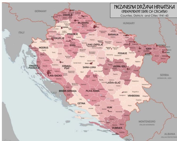
Karta 1. Administrativna podjela NDH od 1941. do 1943. 19

Vučjačka skupina 16,17 djelovala van tog geografskog okvira. Treba spomenuti i četnike s Majevice koji su potpisali primirje, ali ne i vrhovništvo NDH koje su u studenom 1942. razbili partizani. 18