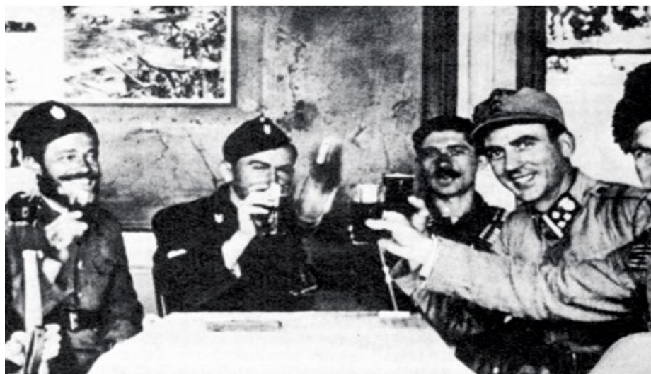
Slika 2. Druženje ustaških i domobranskih časnika s četničkim zapovjednicima. 40

Možda najapsurdniji primjer je bilo druženje ustaša i četnika, iako četnici nikako nisu željeli surađivati s Ustaškom vojnicom, već samo s Domobranstvom, postoje zapisi o „Druženju ustaša i četnika“, zbog čega su vlasti bile zabrinute, iako su propagirale suradnju. Ali postoji primjer gdje su Ozrenski četnici zarobili domobrane koji su utvrđivali prugu, 07. 09. 1942, iako su domobrani odmah pušteni, četnici nisu htjeli predati oružje, na što su im vlasti uskratile isporuku hrane. Sa Zeničkim četnicima je odnos bio napet, kako s vojskom tako i sa stanovništvom. U suštini su odnosi ovisili o lokalnim značajkama, dok su u nekim nisu niti postojali u veći su išli u željenom smjeru. 39