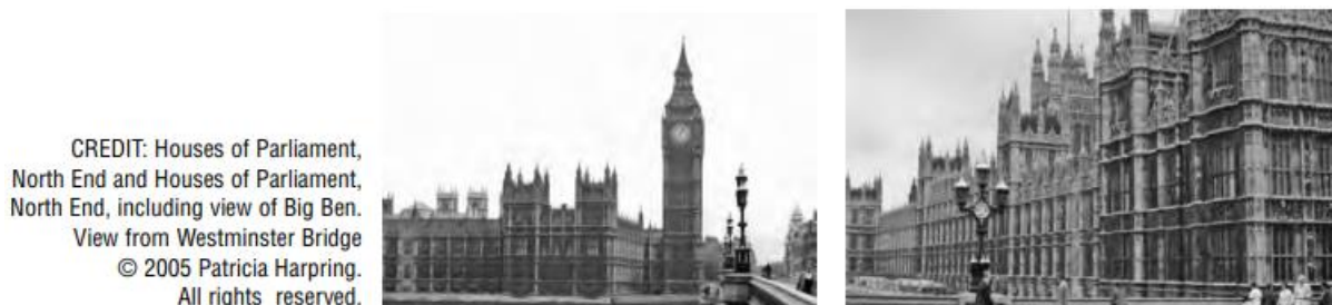
Slika 1. Britanski parlament i Big Ben (fotografije)

Kod opisa muzejske građe važno je razlikovati djelo (eng. Work) od slike (eng. Image). Prema CCO, djelo je umjetnička ili intelektualna kreacija, predmet, struktura, likovni rad i kulturni artefakt, dok je slika vizualni prikaz djela koji se pojavljuje najčešće u digitalnom obliku (npr. fotografija). Djelo i slika se opisuju prema istim pravilima (koriste se isti elementi opisa), pa je važno da katalogizator dobro prouči ono što opisuje i pazi da ne dođe do zbunjujućih zapisa. Slika 1 prikazuje fotografije na kojima su britanski parlament i Big Ben koje je uslikala Patricia Harpring 2005. godine. Naravno da muzej ne može fizički u svom fondu imati parlament ili bilo koju drugu povijesno važnu građevinu, stoga muzej u svom fondu ima fotografije koje katalogizatoru služe kao slike djela. Katalogizator je u ovom slučaju opisao parlament kao arhitektonsko djelo (eng. Work record), dok je za fotografije koje prikazuju tu građevinu napravio zapis o slici (eng. Image record) koji je povezan sa zapisom o djelu.