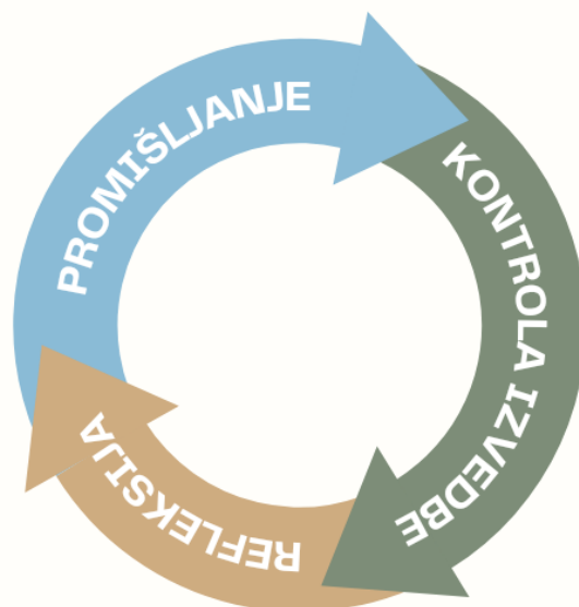
Slika 1: Faze samoregulacije učenja

opažanjima s ciljem unapređenja. Treća faza odnosi se na samorefleksiju vlastitog rada. Učenik nakon procesa učenja treba procijeniti uspješnost procesa te izvući zaključke za postupanja u budućim situacijama učenja. U konačnici, ove tri faze samoregulacije ciklički su međuzavisne te nakon refleksije neminovno slijedi ponovna faza promišljanja (vidi Sliku 1 )(Sorić, 2014).