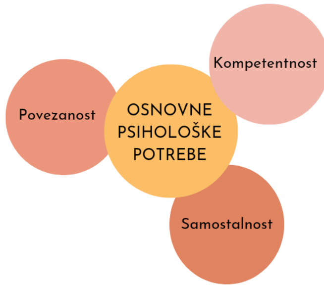
Slika 2: Osnovne psihološke potrebe pojedinca

Prikazane tri potrebe pokazale su se neophodne za normalno funkcioniranje prirodne tendencije za rastom i uspješnom integracijom u društvu, za socijalni razvoj i osobnu dobrobit. Pa se tako potreba za kompetentnošću odnosi na osjećaj sposobnosti i mogućnosti kontrole nad okolinom, potreba za povezanošću podrazumijeva osjećaj pripadnosti nekoj društvenoj skupini, identificiranje kao člana neke socijalne skupine, dok se potreba za samostalnošću odnosi na prirodnu tendenciju pojedinca za organizacijom i upravljanjem vlastitim ponašanjima te na ponašanje u skladu s doživljajem sebe i vlastitim uvjerenjima. Ovisno o tome u kojoj mjeri društveni kontekst dopušta i osigurava zadovoljavanje ove tri osnovne potrebe, intrinzična motivacija pojedinca za učenje i osobni razvitak može varirati. Uz to, ekstrinzična motivacija uz pomoć procesa internalizacije 2 može se pretvoriti u intrinzičnu, točnije rečeno osoba postaje autonomno motivirana (Deci, Ryan, 2000).