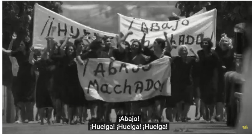
Imagen n°8. La marcha de las mujeres (Lucía, 1:29:30)

Asimismo, es interesante mencionar el personaje de Aldo quien es diferente a los demás hombres y no se comporta como un machista. Respeta a su mujer y no le da vergüenza hablar con su mujer acerca de sus sentimientos y cosas íntimas. Le gusta comentar poemas de José Martí y dice claramente a sus compañeros que no está de acuerdo con sus acciones inmorales. Chanan (2004) destaca la igualdad entre la pareja que se construyó gracias a todo lo que vio Lucía en la relación que habían tenido sus padres. Aldo le ayuda a conocer el mundo que hasta aquel momento no conocía.