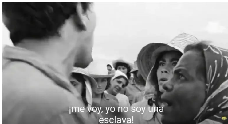
Imagen n°11. Lucía decide no volver con su marido (Lucía, 2:32:51)

Al final, Lucía se va de casa y empieza a trabajar de nuevo. Aunque su marido quiere que ella regrese a casa, ella dice que no lo va a hacer hasta que él no acepte su decisión de ir a trabajar. Aprendió a respetar a sí misma, luchar por sus derechos al trabajo y a la educación y llevar una vida libre. La violencia que se puede ver en algunas escenas representa un problema doméstico que aún existe en muchas familias.