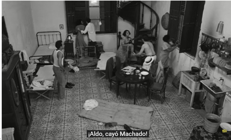
Imagen n°6. Llegó la noticia de la caída del gobierno de Machado (Lucía, 1:34:31)

Después de la caída del gobierno de Machado (Imagen n°6), el nuevo gobierno le ofreció el trabajo a Aldo, quien aceptó la oportunidad porque realmente quería que las cosas cambiaran, pero muy pronto se decepcionó. De nuevo se convirtió en un revolucionario, pero muy pronto lo mataron. Lucía se quedó viuda con un bebé en el camino.