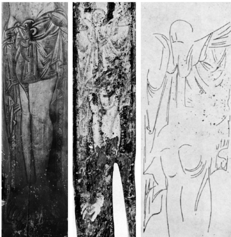
Slika 5. Detalj uništenog raspela iz crkve Sv. Marije u Zadru (lijevo), detalj raspela iz crkve Sv. Križa u Splitu (sredina), skica detalja raspela iz crkve Sv. Križa u Splitu (desno) (izvori: E.HILJE – R. TOMIĆ, 2006., 99; C. FISKOVIĆ, 1969./1970., 7)