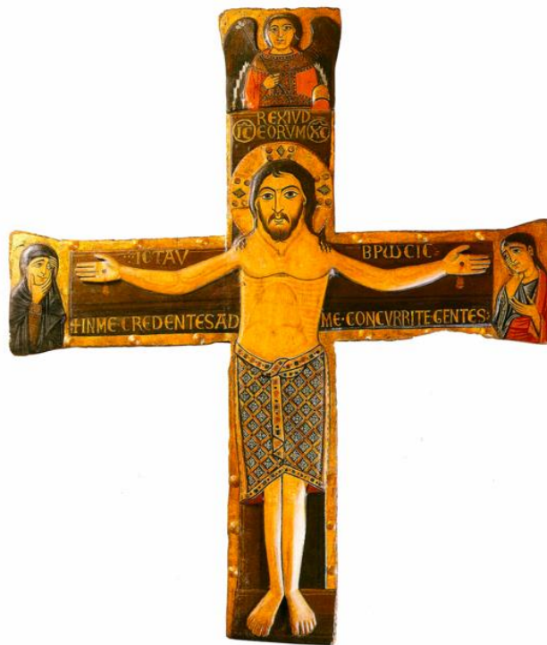
Slika 1. Nepoznati majstor, Reljefno slikano raspelo, Riznica samostana Sv. Frane u Zadru, 12./13. stoljeće