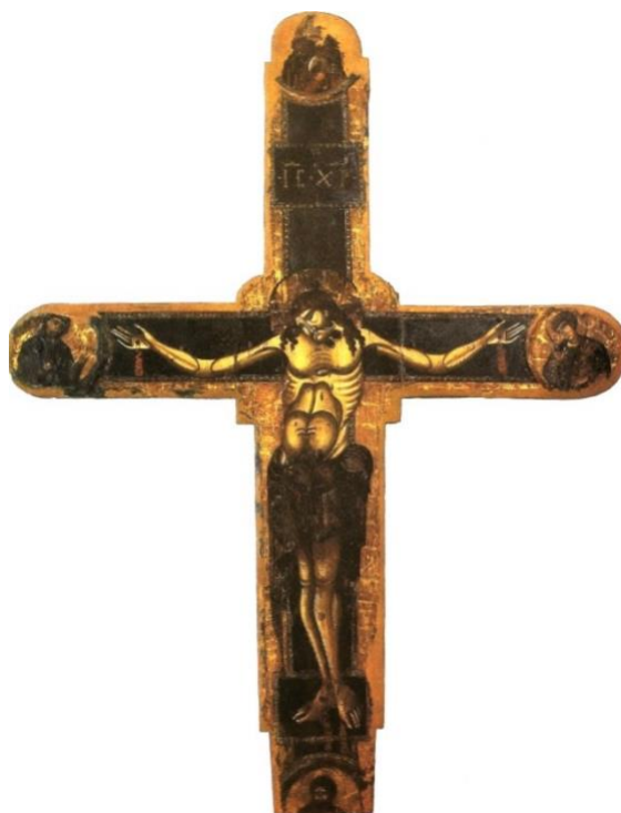
Slika 6. Slikano raspelo u samostanu redovnica Sv. Klare u Splitu, kraj 13. stoljeća