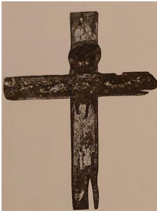
Slika 4. Slikano raspelo, crkva Sv. Križa u Splitu, prva polovina 13. stoljeća