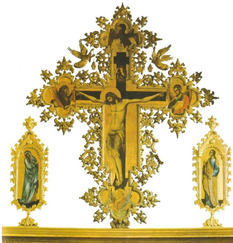
Slika 13. Paolo Veneziano, Rapeće, samostanska crkva Sv. Dominika u Dubrovniku, 1350. – 1355. godine (izvor: STOLJEĆE GOTIKE..., 2004., 107.)