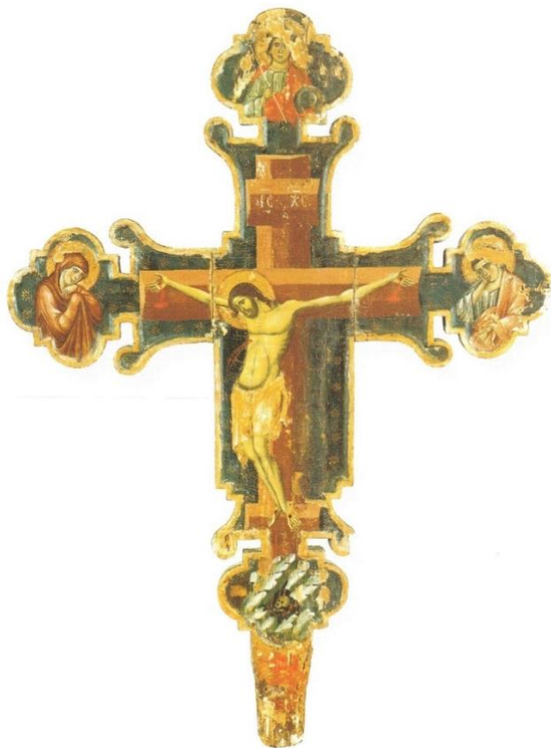
Slika 11. Nepoznati majstor, Slikano raspelo, župna crkva Gospe od Ružarija u Segetu kraj Trogira, prva polovina 14. stoljeća (izvor: STOLJEĆE GOTIKE..., 2004., 87.)