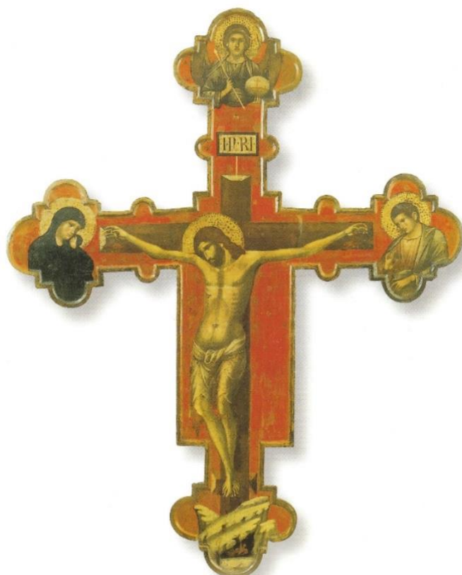
Slika 9. Paolo Veneziano, Slikano raspelo, Zbirka benediktinskog samostana Sv. Nikole, Trogir, 1324. – 1330. godine