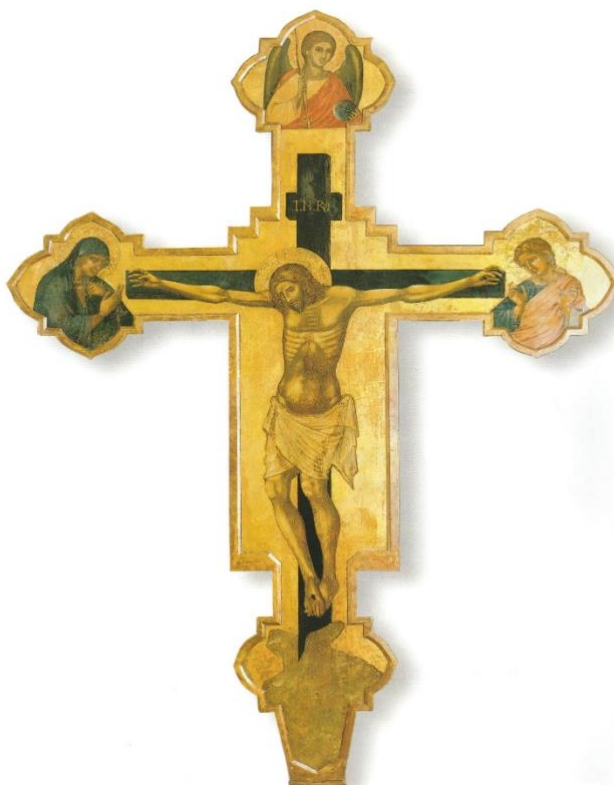
Slika 14. Catinaccio, Slikano raspelo iz crkve Sv. Dominika u Zadru, posljednja četvrtina 14. stoljeća, Stalna izložba crkvene umjetnosti u Zadru (izvor: STOLJEĆE GOTIKE..., 2004., 151.)