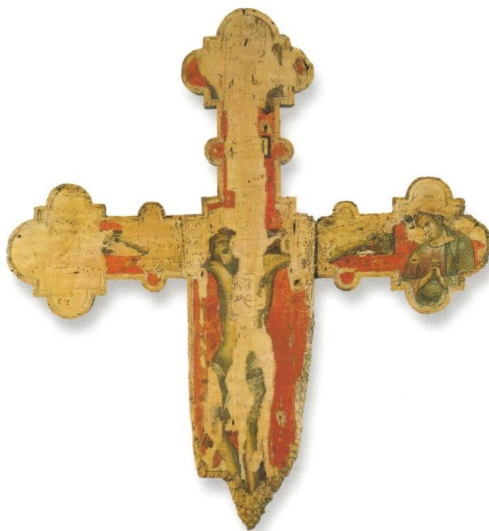
Slika 10. Paolo Veneziano, Slikano raspelo, Župna crkva Uznesenja Blažene Djevice Marije, Slatine na Čiovu, oko 1325. godine (izvor: STOLJEĆE GOTIKE..., 2004., 89.)