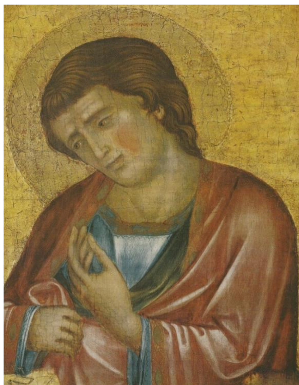
Slika 12. Radionica Paola Veneziana, Sv. Ivan iz kompozicije Raspeća, Muzej za umjetnost i obrt u Zagrebu, oko 1350. godine