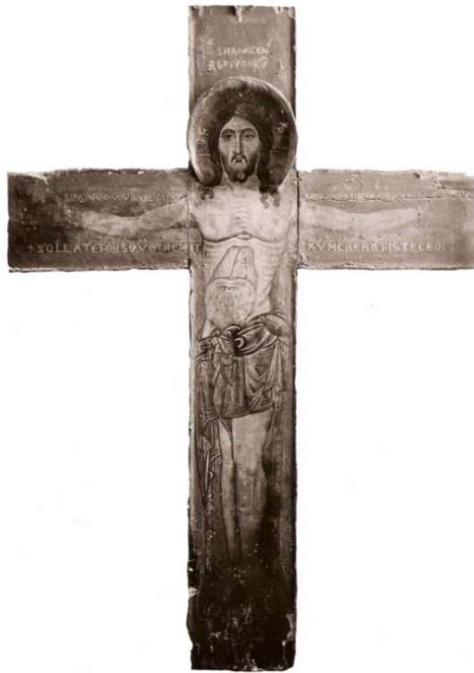
Slika 3. Zadarski majstor (?), Slikano raspelo iz crkve Sv. Marije u Zadru, 13. stoljeće (uništeno)