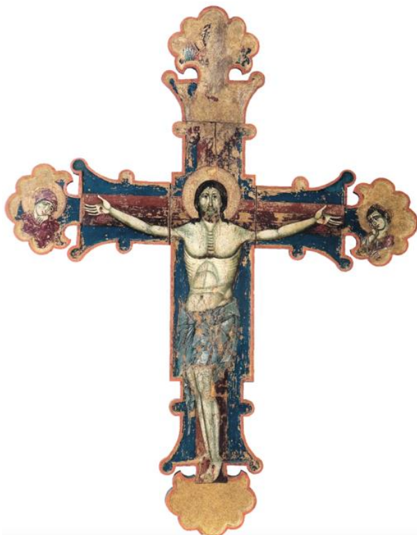
Slika 8. Nepoznati majstor, Slikano raspelo iz crkve Sv. Andrije na Čiovu, oko 1325. godine, Zbirka crkvene umjetnosti katedrale Svetog Lovre u Trogiru (izvor: STOLJEĆE GOTIKE..., 2004., 67.)