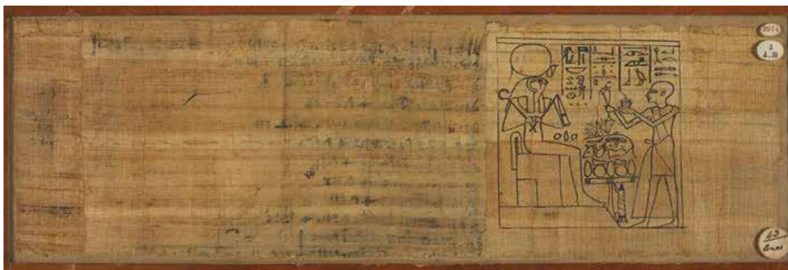
Slika 1. Prikaz stranica egipatske Knjige mrtvih . (H. Kockelmann, 2017, 67.)

Standardna veličina papirusa je varirala između 30 i 50 centimetara, a za konačno formiranje svitka, bilo je potrebno povezati stranice kojima je često dodana još jedna traka papirusa kako bi se dodatno ojačao, odnosno kako bi se spriječilo ispadanje stranica. 3 Upravo je na takav način nastala i egipatska Knjiga mrtvih , ali sam proces je bio nešto kompliciraniji nego pri stvaranju ostalih svitaka. No, o tome će više biti rečeno u slijedećim poglavljima.