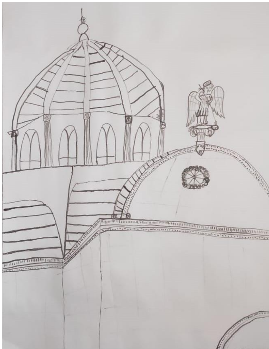
Slika br. 10 Primjer izrazito uspješnog rada

Rad ovog učenika služi kao primjer izrazito uspješno odrađenog likovnog djela. Jasno se vidi kompozicija likovnog djela te obraćanje pažnje na kadriranje. Učenik je kadrirao kupolu katedrale koja se nalazi u prvom planu ovog likovnog rada koji je prilagođen formatu papira. Učenik je koristio više vrsta crta po toku pa tako vidimo ravne, zakrivljene i izlomljene crte, ali isto tako i više crta po karakteru od kojih su neke debele, neke tanke te duge i kratke crte. Kontrast mokro-sušo u ovom radu je u manjoj mjeri uspio, naime samo na nekim dijelovima se vidi prelijevanje tuša preko mokre površine. Dimenzije elemenata kompozicije su proporcionalne te rad obiluje lijepo uređenim detaljima.