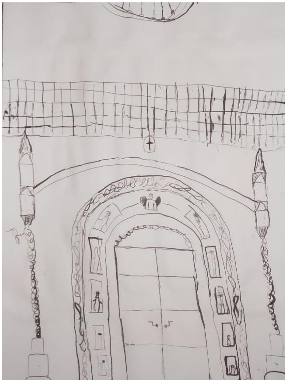
Slika br. 11 Primjer uspješnog rada

Ovaj likovni rad je okarakteriziran kao uspješan. Učenik je kadrirao glavni portal koji se nalazi na pročelju katedrale. Oko glavnih vrata vidi se prikaz posljednjeg suda odnosno apostola jedan povrh drugog a u sredini Isus Krist. Učenik je koristio više različitih crta po toku i karakteru. Učenik je djelomično ispravno prikazao elemente kompozicije i odnose veličina. Glavni središnji portal obiluje detaljima koje je učenik u manjoj mjeri prikazao. Motiv ovog rada se nalazi u sredini tako da je učenik prilagodio kompoziciju formatu papira iako je rad ispao asimetričan. Kontrast mokro-sušo je u nezamjetnoj mjeri prisutan što je rezultiralo ocjenjivanjem ovog rada kao uspješnim.