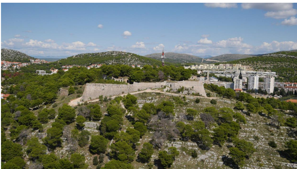
Slika br. 4 Tvrđava sv. Ivana