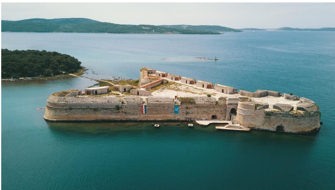
Slika br. 2 Tvrđava sv. Nikole