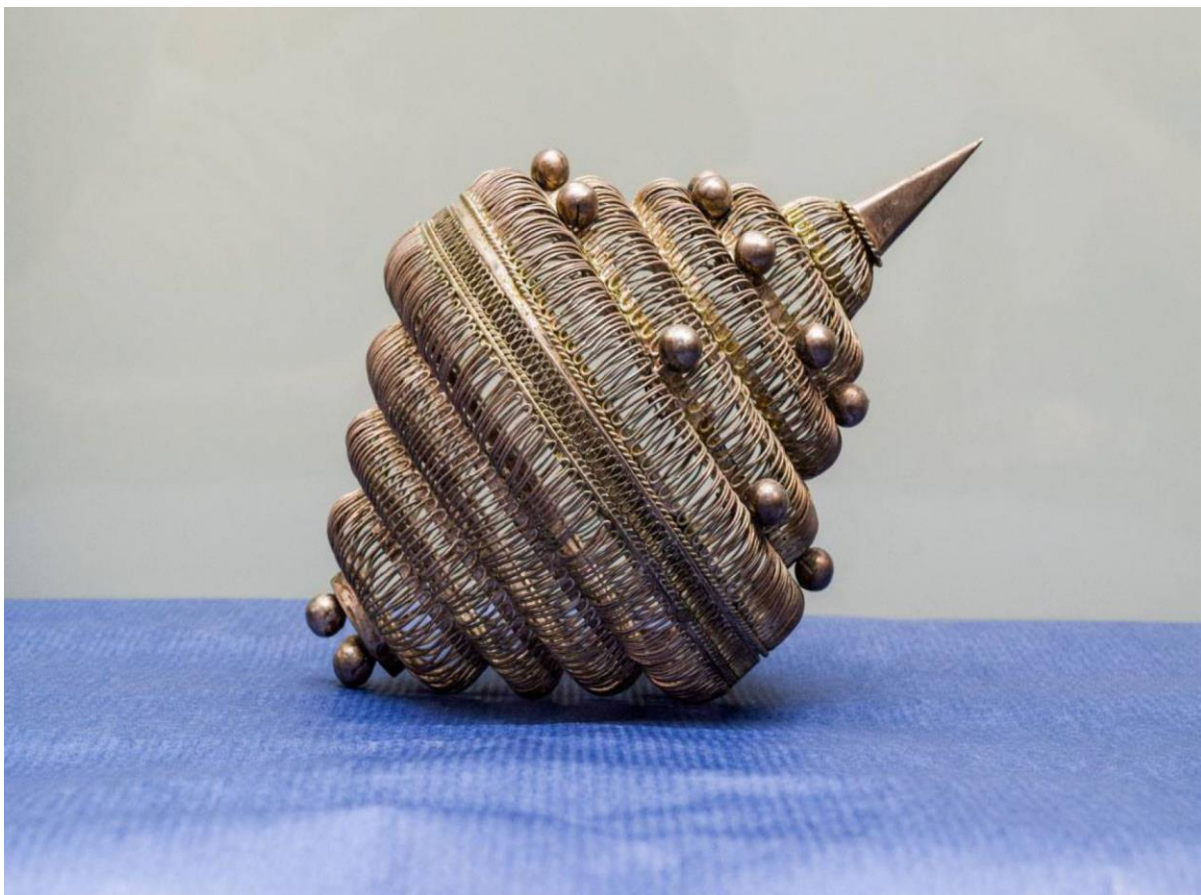
Slika br. 6 Šibenski botun