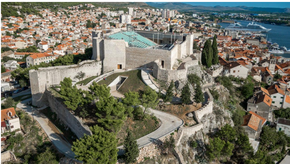
Slika br. 3 Tvrđava sv. Mihovila