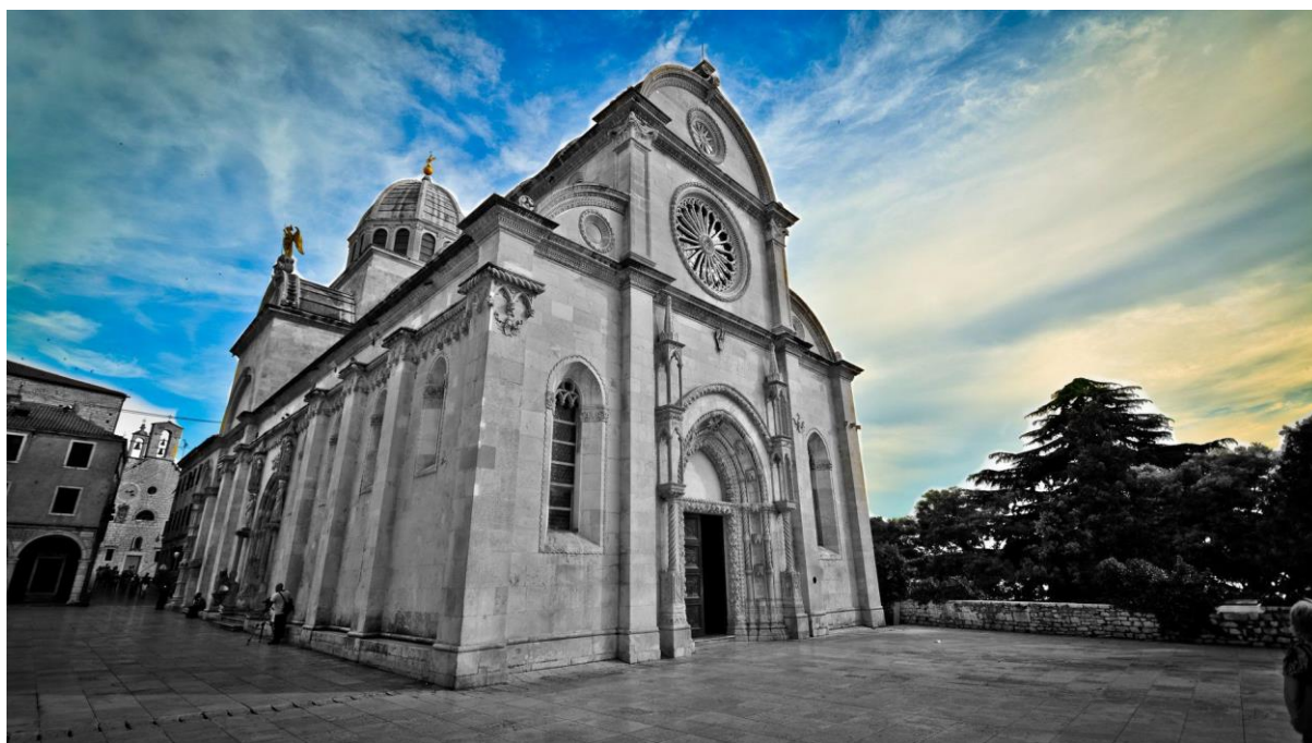
Slika br. 1 Katedrala sv. Jakova