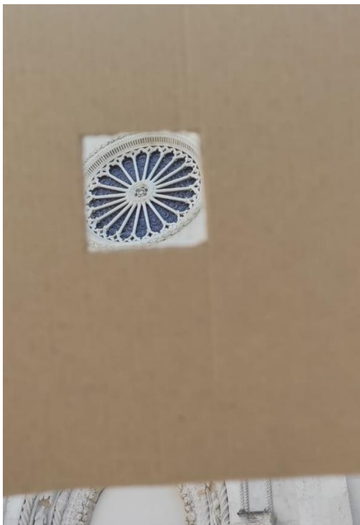
Slika br. 9 Primjer kadriranja kupole