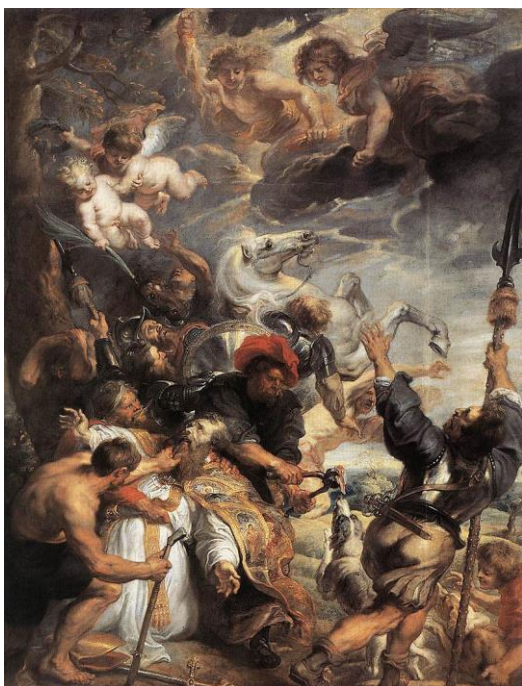
slika 20. Rubens, Mučeništvo sv. Livina , 1633.