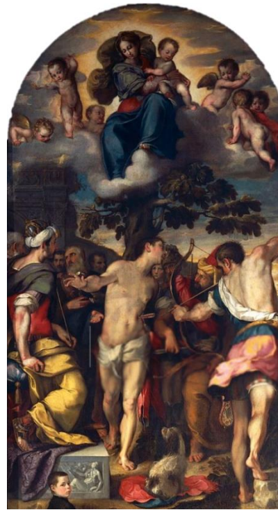
slika 5. Barocci, Martirij sv. Sebastijana , 1558., katedrala u Urbinu