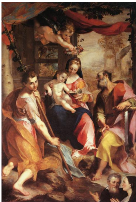
slika 8. Barocci, Madonna di San Simone , 1567., Nacionalna Galerija, Urbino