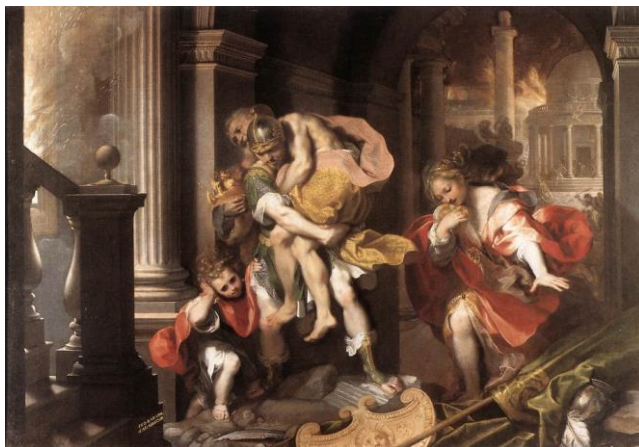
slika 17. Barocci, Bijeg Eneje iz Troje , 1598. Galerija Borghese, Rim