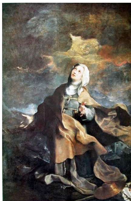
slika 19. Barocci, Bl. Michelina Metelli, 1590. – 1600., Vatikan, Pinakoteka