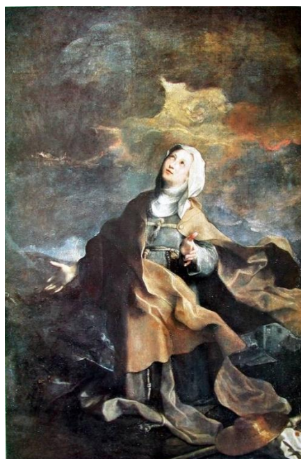
slika 19. Barocci, Bl. Michelina Metelli, 1590. – 1600., Vatikan, Pinakoteka