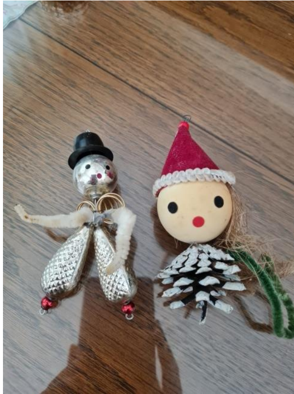
Slikovni prilog 4. Božićni ukrasi iz 1980-ih