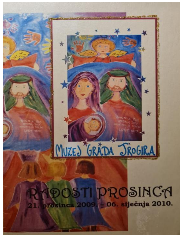
Slikovni prilog 14. Katalog izložbe „Radosti prosinca“

panja badnjaka, a u trećem dijelu izložbe su bili prikazani likovi iz jaslca i o svakom je bilo napisano nekoliko riječi.