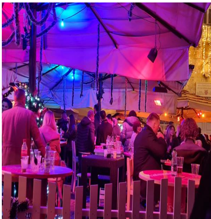
Slikovni prilog 13. Vesela atmosfera na adventskim kućicama na Badnju večer 2021. godine

Mladi na advent često odlaze te sve više vremena provode na kućicama s društvom. Kućice im postaju mjesto izlaska i razbibrige. Moji sugovornici smatraju da mlađim generacijama advent postaje centar božićnih događanja te da se time osjećaj zajedništva i druženja s obitelji, kod kuće, smanjuje. No, je li advent nadopuna Božića ili je preuzeo glavnu ulogu ovisi o pojedincu, njegovom vjerovanju i životnim ciljevima. Starije stanovništvo tradiciju i vjerske običaje ističu kao glavni razlog slavljenja Božića kao blagdana. Dok mlađe stanovništvo smatra da adventske kućice nisu preuzele bit Božića te da su njegova nadopuna, ali da se vole družiti i provoditi vrijeme na adventu u zajedništvu. Bit ovog blagdana ostaje isti zbog toga što se radi o vjerskom običaju koji je duboko ukorijenjen u tradicijskoj kulturi (usp. Vojnović Traživuk 2019: 21).