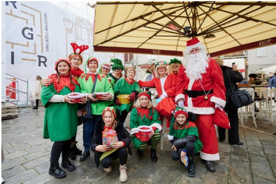
Slikovni prilog 12. Djed Božićnjak i vilenjaci na gradskom trgu 2021. godine