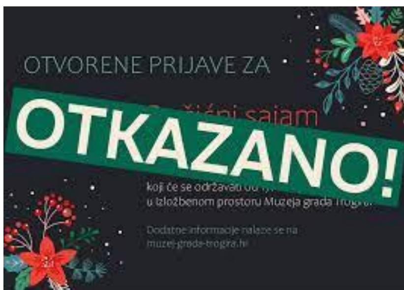
Slikovni prilog 15. Otkazani peti Božićni sajam rukotvorina

„Ja mislim da je najviše uvjetovalo to što se nije znalo kakve će bit mjere, u Muzej se nije moglo ući bez covid potvrde ili negativnog testa i plus to, imam osjećaj, da izlagači nisu očekivali ni da će se moći održati sajam pa se nisu ni spremali.“