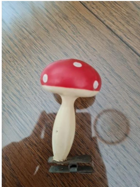
Slikovni prilog 5. Božićni ukras iz 1980-ih