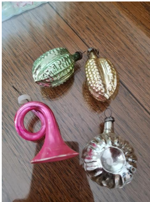
Slikovni prilog 3. Božićni ukrasi iz 1970-ih