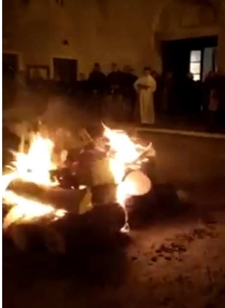
Slikovni prilog 2. Paljenje panja badnjaka na Badnju večer ispred crkve svetog Dominika u Trogiru