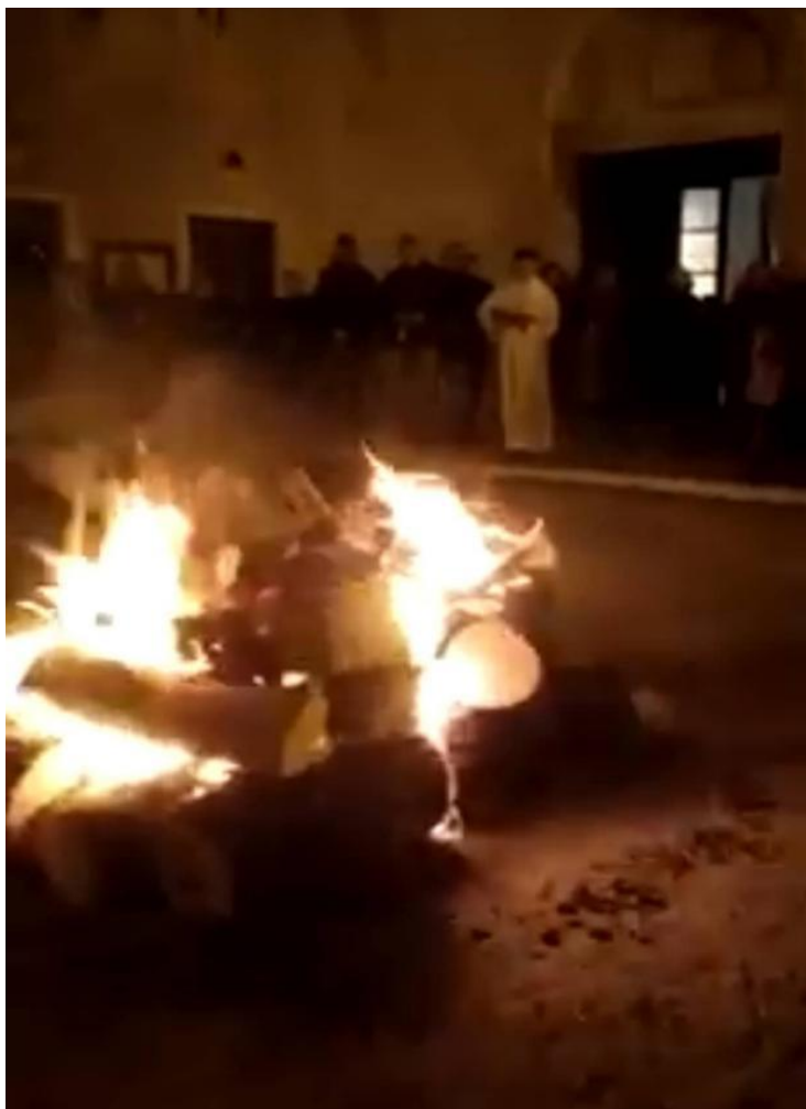
Slikovni prilog 2. Paljenje panja badnjaka na Badnju večer ispred crkve svetog Dominika u Trogiru