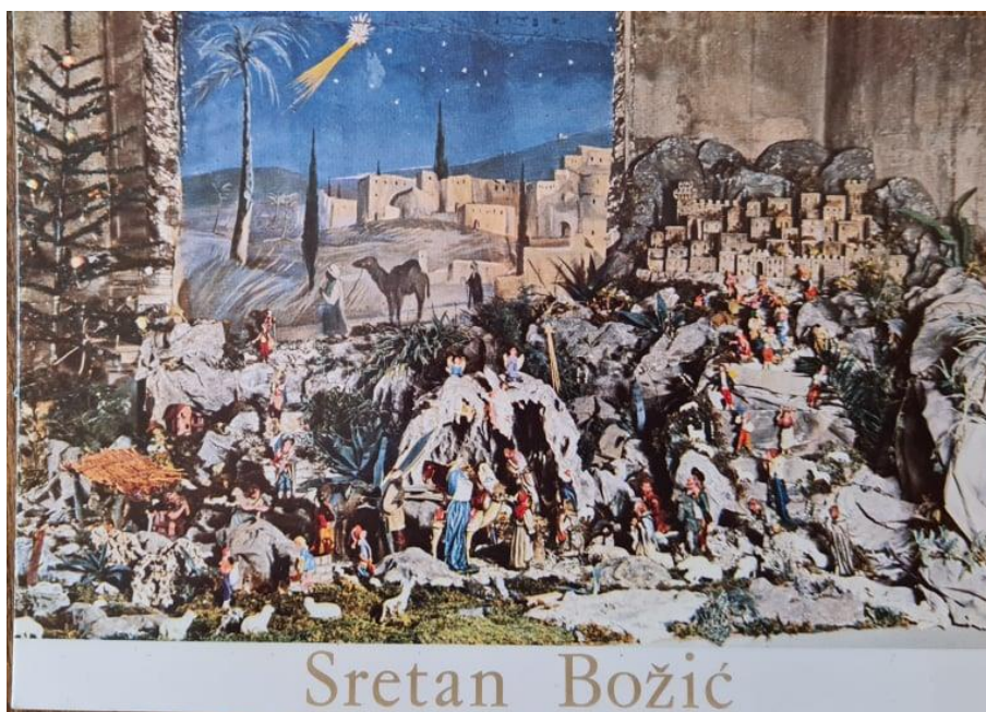
Slikovni prilog 7. Čestitka za Božić

Sugovornica Marija mi je ispričala priču o jaslicama koje je radio njen otac za katedralu sv. Lovre u Trogiru, 1966. godine. U katedrali jaslica nije bilo te ga je biskup zamolio da napravi jaslice za crkvu. Marijin otac je prihvatio molbu te ih je odlučio napraviti. Biskup se iznenadio kada ih je vidio te mu se htio odužiti. Marijin otac je zamolio biskupa da ispod jaslica napiše „Sretan Božić“. Biskup se iznenadio željom koju mu je odlučio ispuniti. Kada je natpis bio napravljen, Marijin otac je uslikao jaslice i natpis te je fotografiju dao izraditi kao čestitke koje je prodavao. U gradu Trogiru nigdje nije bilo kupiti čestitke „Sretan Božić“. Biskup je zbog ovog čina bio pozvan na komitet.