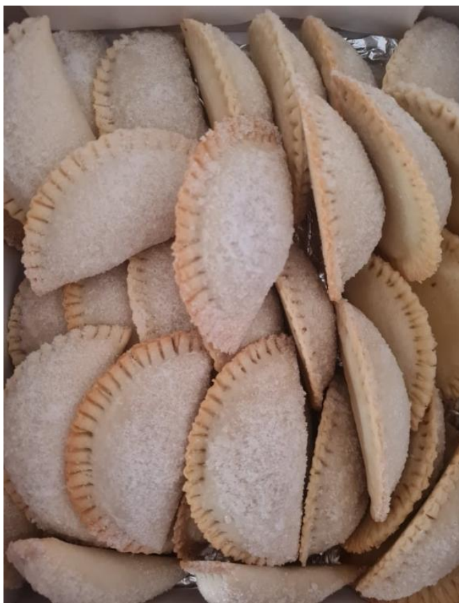
Slikovni prilog 10. Trogirski rafioli

Običaj mesnog jelovnika na Božić očuvao se do danas. Trogirani na Božić jedu meso, najčešće janjetinu, kokoš ili tuku uz razne priloge. Meso se većinom nabavlja iz mesnica jer vlastite životinje rijetko koja obitelj uzdržava. Ručak je tradicionalan, puno bogatiji namirnicama nego prije pedesetak godina.