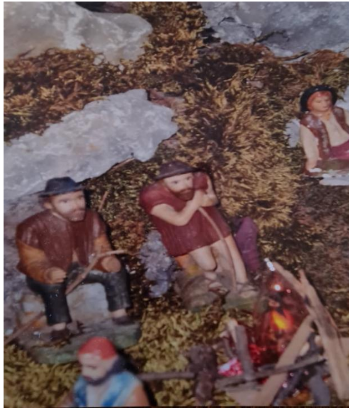
Slikovni prilog 8. Kipovi od drva u jaslicama obitelji Božić

pa bi ih trogirski djeca dolazila gledati. Nadalje, zanimljivo je primijetiti kako gospođa Marija u razgovoru jaslice naziva Betlehem, a Vitomir Belaj u svojoj disertaciji o kulturnim vrtićima (1979: 229) upozorava na nazive „jeruzalem“ i „betlehem“ za seljački božićni nakit u kutu sobe i njihovu moguću vezu s jaslicama.