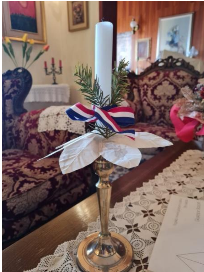
Slikovni prilog 1. Božićna svijeća

„Evo ti moje božićne svijeće. To ti je stari kandelir, kojem ima 200 godina i to ti je božićna svijeća koja je na stolu.“ (Sugovornica Marija, Trogir)