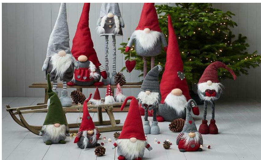
Slikovni prilog 6. Božićni patuljci skandinavskog podrijetla