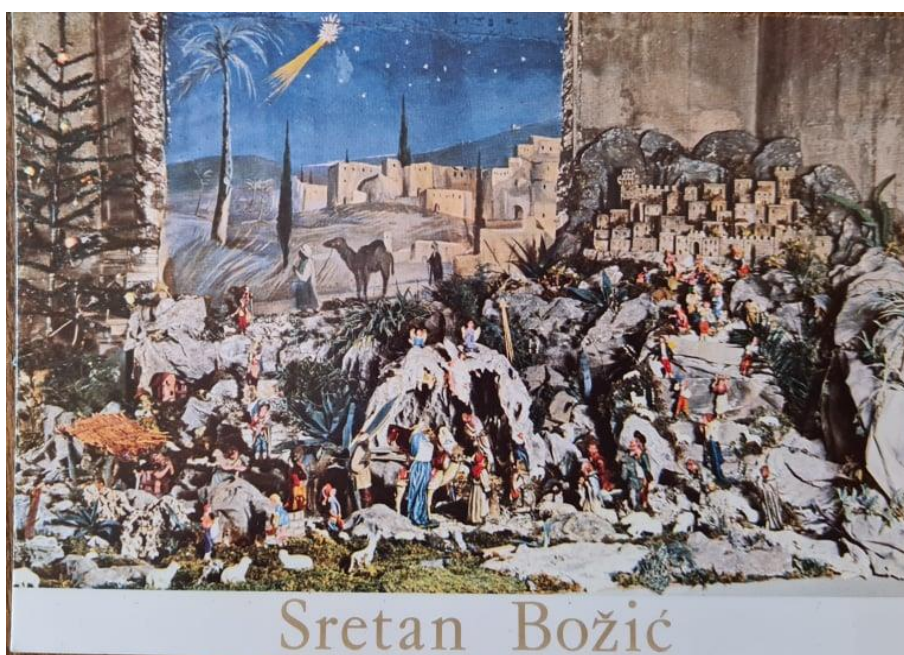
Slikovni prilog 7. Čestitka za Božić

Sugovornica Marija mi je ispričala priču o jaslicama koje je radio njen otac za katedralu sv. Lovre u Trogiru, 1966. godine. U katedrali jaslica nije bilo te ga je biskup zamolio da napravi jaslice za crkvu. Marijin otac je prihvatio molbu te ih je odlučio napraviti. Biskup se iznenadio kada ih je vidio te mu se htio odužiti. Marijin otac je zamolio biskupa da ispod jaslica napiše „Sretan Božić“. Biskup se iznenadio željom koju mu je odlučio ispuniti. Kada je natpis bio napravljen, Marijin otac je uslikao jaslice i natpis te je fotografiju dao izraditi kao čestitke koje je prodavao. U gradu Trogiru nigdje nije bilo kupiti čestitke „Sretan Božić“. Biskup je zbog ovog čina bio pozvan na komitet.