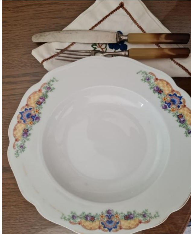
Slikovni prilog 9. Tanjur i pribor za jelo na Božić

Trogirani su za Božić najčešće jeli meso svojih domaćih životinja. To je većinom bilo meso kokoši, pijetla, svinje ili tuke: