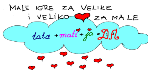
Logotip projekta „Recimo Da obitelji“ 24

Projekt sadrži aktivnosti s djecom i za djecu, vezano za poticanje važnost obitelji u razvoju djece, a završnica projekta je uključivanje svih roditelja u zajedničke igre sa sloganom: „Male igre za velike i veliko srce za male - „Tatamatijada“. U igrama sudjeluju sve obitelji na način da se očevi takmiče u dječjim igrama, majke im pomažu, a djeca ih nagrađuju medaljama. Projekt traje u kontinuitetu od 2009. godine do danas. 22 Kontinuitet trajanja prikazan je na poster sekciji smotre projekata i projektnih aktivnosti Dječjeg vrtića „Biograd“ u Zavičajnom muzeju Biograd u svibnju 2018. godine. Projekt „Tatamatijada“ svake je godine uvršten u program proslave Dana Grada Biograda na Moru. Popraćen je putem Školskim novinama, lokalnih medija: Zadarski list, Slobodna Dalmacija. Prikazan je i na Hrvatskoj televiziji u informativnoj emisiji Dnevnik 23 i Televiziji Nova TV također u emisiji Dnevnik.