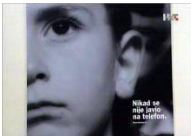
Slika 16. Isječak iz TV kampanje „Dajmo da čuju“ prikazane na HRT-u.

Ovo čini integralni i implicitni dio priče koji se želi naglasiti. Razloge zašto ovu priču trebamo smatrati „lijepom“ pronalazimo u vezi s određenom mobilizacijom sentimenta u razgraničavanju medicinskog i političkog. Suočeni smo s djetetom koje ne