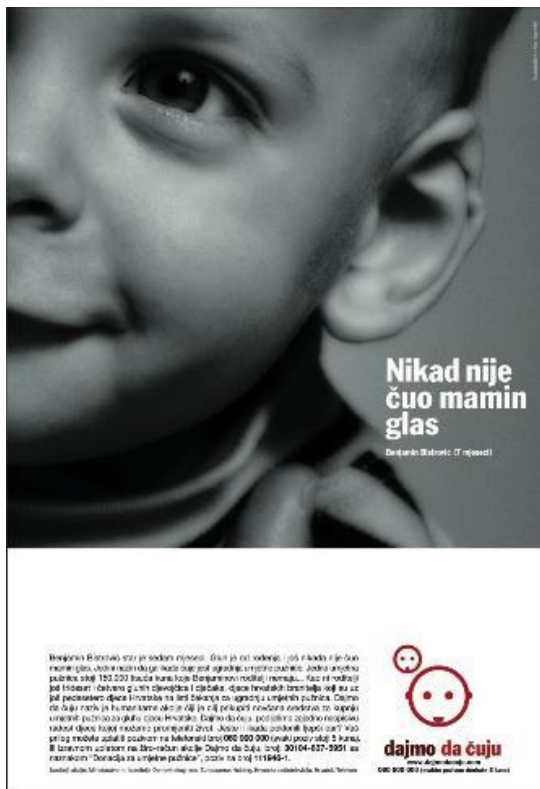
Slika 15. Plakat humanitarne akcije „Dajmo da čuju“.