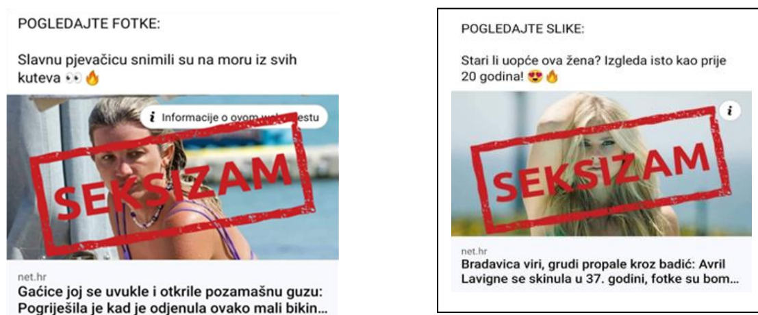
Objava 1. i 2. Primjeri seksističkog izvještavanja (Net.hr)

Seksizam se u hrvatskim medijima pojavljuje u različitim oblicima, a ponajviše kroz objektiviziranje i seksualiziranje žena. Svrha mnoštva članaka na online portalima nije izvještavanje i informiranje javnosti o relevantnim društvenim temama, nego svođenje žena na seksualne objekte koji služe isključivo za promatranje i korištenje njihovog tijela kao sredstva za privlačenje pozornosti. Seksizam je danas toliko duboko usađen i normaliziran u hrvatskim medijima da prolazi gotovo neprimijećeno. Analiza uzorka pokazala je da je hiperseksualizacija ženskog tijela najčešća pojava u člancima na portalu Net.hr, a u nastavku su prikazana dva primjera: