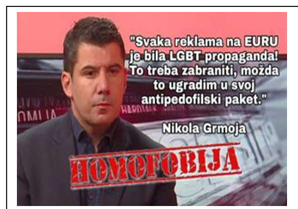
Objava 10. i 11. Homofobne izjave Bože Petrova i Nikole Grmoje

Navedene su izjave problematične na više razina, pogotovo ukoliko se u obzir uzme da dolaze od hrvatskih političara koji posjeduju određenu moć i čija medijska pojava vrši značajan utjecaj na šire mase. Umjesto iznošenja diskriminatornih i u potpunosti pogrešnih stavova, njihova bi zadaća trebala biti promocija prihvaćanja različitosti i uvažavanja prava svih manjina, pa tako i onih seksualnih. Prvenstveno, izjednačavanje pedofilije i homoseksualnosti izrazito je krivo i navedeni koncepti se nipošto ne mogu promatrati kao sinonimi. S druge strane, važno je istaknuti kako isključivo toleriranje manjina i njihovih posebnosti ne podrazumijeva nužno istinsko prihvaćanje i uvažavanje koje bi trebalo biti općeprihvaćeno unutar hrvatskog društva. Ovakve su izjave primjeri svjesnog manipuliranja i poticanja diskriminacije te ne bi trebali imati svoje mjesto u medijima.