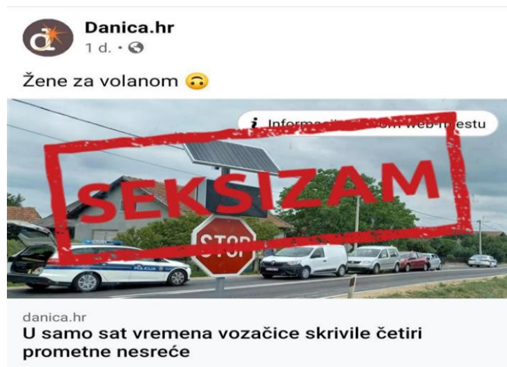
Objava 3. U samo sat vremena vozačice skrivile četiri prometne nesreće

Primjer dviju objava koje služe kao ilustracija spomenutog je sljedeći: