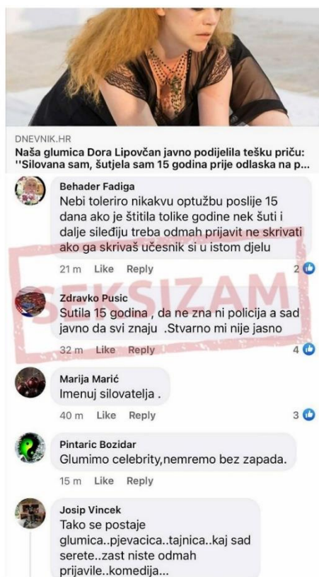
Objava 21. Mizogini komentari (Dnevnik.hr)

Upravo su ovakvi i slični komentari javnosti jedan od brojnih razloga zašto žrtve nasilja šute i ne istupaju u javnost sa svojim traumatičnim iskustvima. U hrvatskom je društvu i dalje prisutno generalno vjerovanje kako su žene najčešće same krive za zlostavljanje te ih mediji i okruženje dodatno diskriminiraju neprikladnim reakcijama na proživljeno nasilje. Također, u oba navedena primjera prisutni su komentari koji opravdavaju nasilnika uz mišljenje da se javne osobe dragovoljno izlažu ovakvim situacijama kako bi napredovale u karijeri. Uz to, žrtve se u komentarima dodatno proziva i omalovažava ukoliko ne imenuju svoje nasilnike te se ne uzimaju u obzir brojni faktori koji na to utječu: strah od ponovnog (težeg) nasilja, ekonomska ovisnost o nasilniku, nisko samopouzdanje, strah od osude i nerazumijevanja okoline i tako dalje. Nažalost, iz navedenih je primjera moguće vidjeti kako je posljednji faktor u potpunosti opravdan.