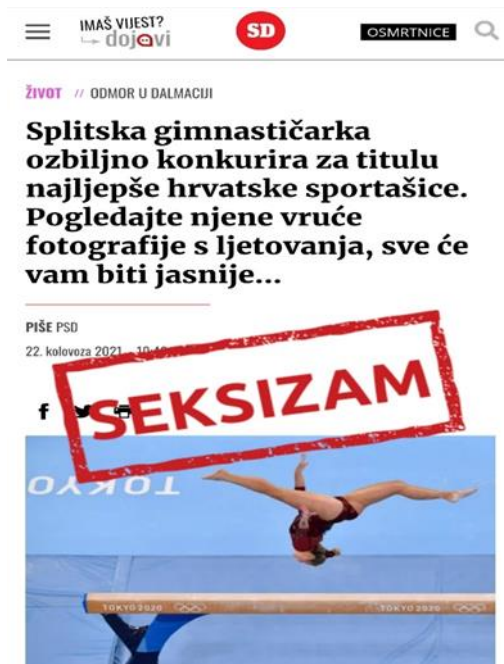
Objava 7. Splitska gimnastičarka ozbiljno konkurira za titulu najljepše hrvatske sportašice. Pogledajte njene vruće fotografije s ljetovanja, sve će vam biti jasnije... (Slobodna Dalmacija)

Nadalje, analizirane su objave obuhvatile i određene seksističke reklame koje je bilo moguće vidjeti na hrvatskim televizijskim programima. Hrvatski Telekom objavio je reklamu u kojoj su muškarci prikazani kao nesposobni očevi koji se ne znaju brinuti o svojoj djeci. U glavnoj je ulozi otac koji ostaje kod kuće i vodi brigu o djetetu nakon što majka ode na posao. Otac je prikazan kao lik koji ne zna promijeniti dječju pelenu niti pripremiti bočicu s hranom, što dovodi do očitog zaključka da je u prvim mjesecima djetetovog života to radila isključivo majka. S jedne je strane prisutan pokušaj razbijanja rodni stereotipa prema kojima su majke te koje ostaju kod kuće i vode brigu o djeci dok su očevi na poslu, no s druge je strane ovakav način prikazivanja jedino potvrdio već ustaljene stereotipe o nesposobnim očevima i brižnim majkama. Među analiziranim je objavama prisutan još jedan sličan primjer, a to je božićna reklama operatera Tele2 koja uključuje mnoštvo seksističkih izjava, stereotipa o napornim punicama i nametljivim ženama. Kao što navode autorice stranice u svojoj objavi, sukladno Zakonu o ravnopravnosti spolova zabranjeno je javno prikazivanje i predstavljanje žena i muškaraca na uvredljiv, omalovažavajući ili ponižavajući način. Ipak, ovakvo je oglašavanje u hrvatskim medijima i dalje vrlo česta pojava te svakodnevno potiče formiranje stereotipnih i