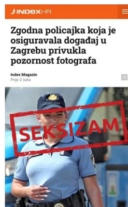
Objava 5. Zgodna policajka koja je osiguravala događaj u Zagrebu privukla pozornost fotografa

U nastavku je prikazano nekoliko primjera: