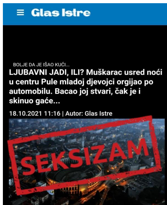
Objava 17. Neprimjerenost izvještavanja o nasilju (Glas Istre)

Kada je riječ o medijskom izvještavanju koje je vezano uz bilo kakav oblik nasilja, važno je u obzir uzeti osjetljivost teme te joj pristupiti sa maksimalnom odgovornošću i zaštitom identiteta uključenih. Prilikom izvještavanja o nasilju novinari trebaju uvažiti položaj i privatnost žrtve nasilja, pogotovo s obzirom na činjenicu da se u hrvatskom društvu reakcije iz okoline najčešće svode na prebacivanje odgovornosti na samu žrtvu i opravdavanje nasilnika. Medijska uloga u izvještavanju o nasilju određena je načinom odnošenja prema žrtvi te osvještavanjem šire javnosti o ovoj problematici. U ovom je procesu ključno nasilje promatrati kao društveni, a ne privatni problem, čime se može pristupiti korak bliže samom otkrivanju i analizi uzroka pojavljivanja (URL 9). Uz to, postupak kreiranja sadržaja treba prvenstveno treba biti vođen autorovom odgovornošću koja će pomoći senzibiliziranju javnosti o neprimjerenosti nasilnog ponašanja. Nažalost, nerijetko dolazi do neetičnog senzacionalističkog izvještavanja čime se zanemaruje žrtvina privatnost i zaštita (URL 10). Senzacionalističko izvještavanje često obuhvaća korištenje neprimjerenih naslova koji ne dovode do stvarnog osvještavanja problema i često umanjuju ozbiljnost cjelokupnog slučaja. U nastavku su dva primjera: