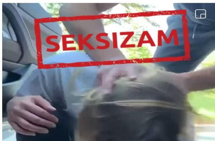
Objava 19. Banalizacija nasilja (CIAK Auto)

Akcijsku ponudu odličnih proizvoda za čišćenje pronađi na: https://ciak-auto.hr/akcijska-ponuda/