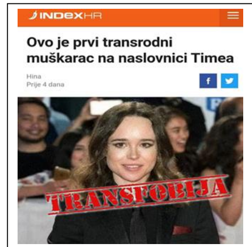
Objava 14. i 15. Primjeri transfobnog izvještavanja (Net.hr, Index.hr)