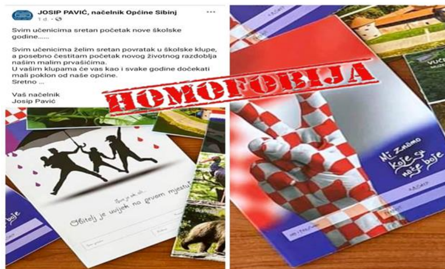
Objava 12. Homofobne bilježnice (Facebook stranica JOSIP PAVIĆ, načelnik općine Sibinj)

fotografijama je vidljiva bilježnica na kojoj su muškarac, žena i dvoje djece, koji drže kišobran kojim se “štite” od duginih boja, popraćeno natpisom “Sve je ok, ali... Obitelj je uvijek na prvom mjestu!” Dijeljenjem ovakvih bilježnica izravno se promovira homofobija od najranije dobi te se djeci nameću diskriminatorni stavovi prema kojima obitelj mogu činiti isključivo muškarac, žena i njihova djeca. Takvo je definiranje izrazito reducirajuće budući da je institucija obitelji danas iznimno fluidna i nije ju moguće svesti isključivo na jedan vrijedan oblik. Takvim se djelovanjem umanjuje vrijednost svih drugih obiteljskih oblika, a među kojima su i one sačinjene od istospolnih partnera i njihove djece.