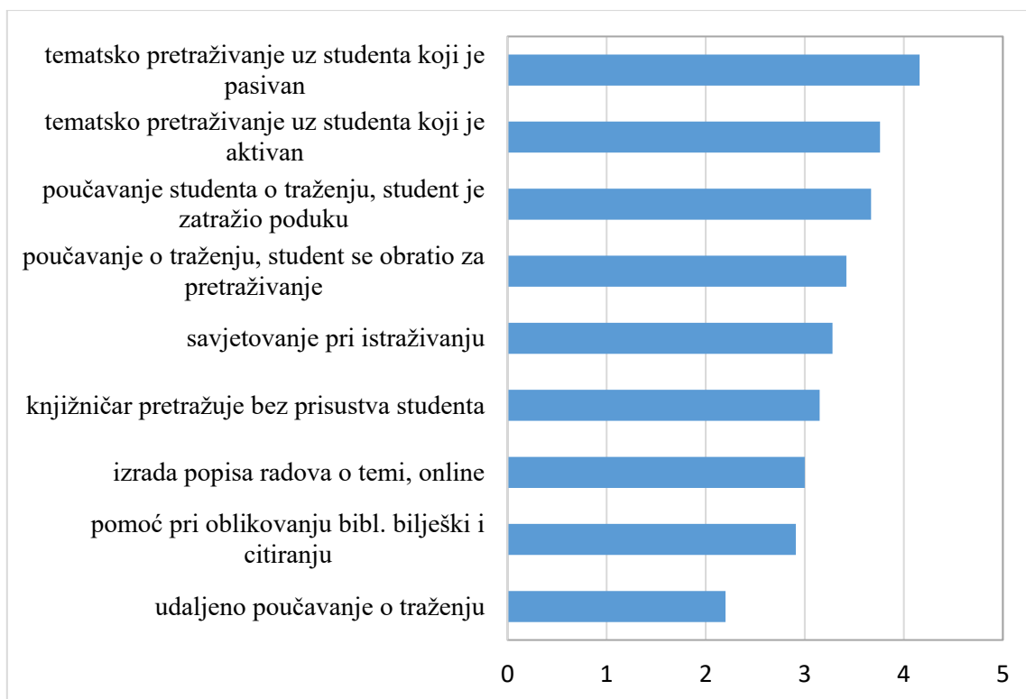
Grafički prikaz 1. Aritmetičke sredine učestalosti pružanja usluga i aktivnosti koje uključuju individualnu pomoć studentima u traženju informacija u fakultetskim i sveučilišnim knjižnicama