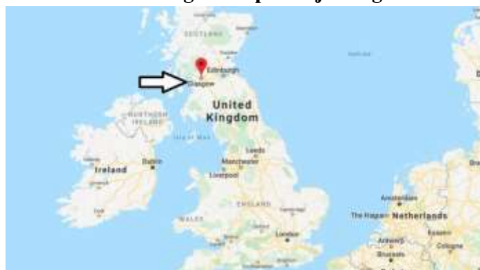
Slika 8: Geografski položaj Glasgowa