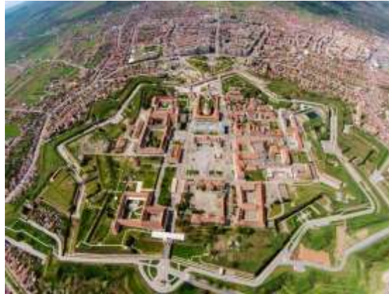
Slika 6: Tvrđava Alba Carolina