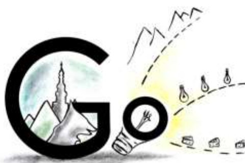
Slika 15: Skicirani predložak logotipa aplikacije „GO“