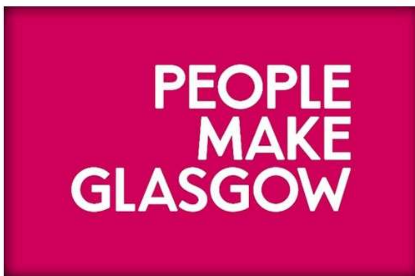
Slika 9: Logotip grada Glasgowa