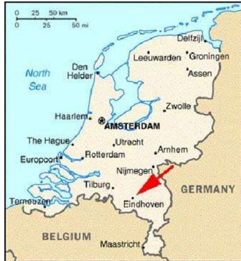
Slika 3: Geografski položaj Eindhovena