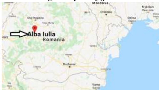
Slika 5: Geografski položaj grada Alba Iulia