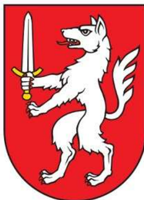
Slika 13: Grb grada Gospića