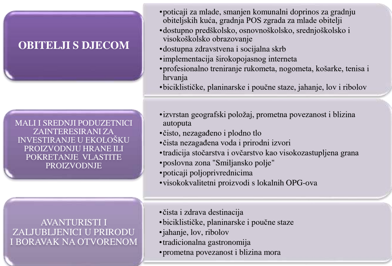
Slika 11: Gradske mjere usmjerene prema fokus grupama