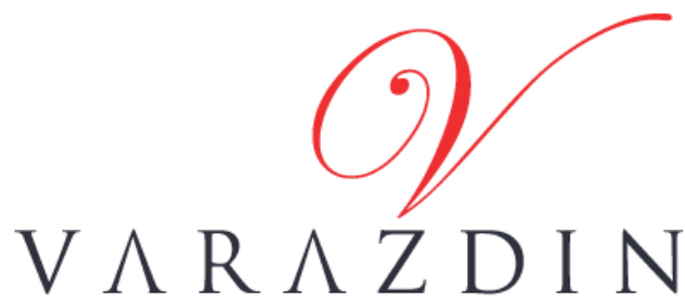
Slika 2: Logotip grada Varaždina

Na slici 2 nalazi se logotip grada Varaždina: