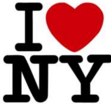
Slika 1: Logotip I [love] NY