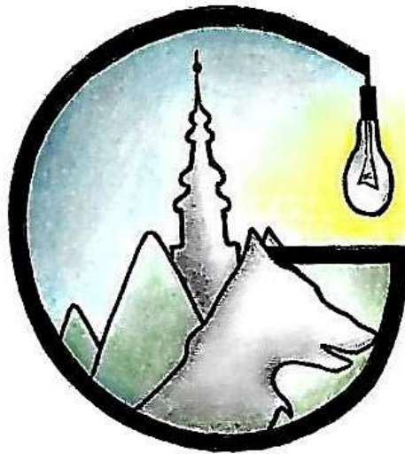
Slika 14: Prijedlog logotipa grada Gospića