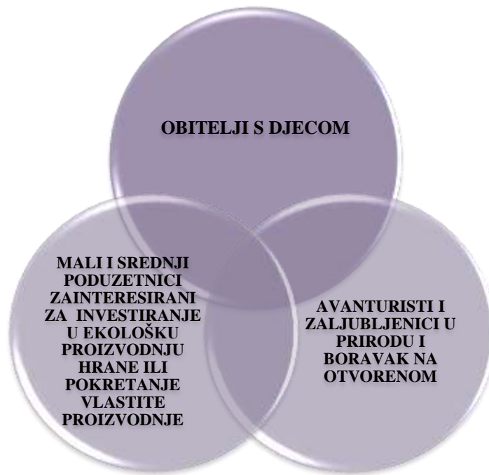
Slika 10: Ciljne grupe

Gospić je miran i obiteljski grad, koji svoj budući razvoj vidi u održivom i učinkovitim korištenju prirodnih resursa, poticanju malog i srednjeg poduzetništva te razvoju selektivnih oblika turizma. Iz navedenoga možemo izdvojiti tri ključne ciljne grupe prema kojima treba usmjeriti brendiranje (slika 10).