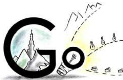
Slika 15: Skicirani predložak logotipa aplikacije „GO“