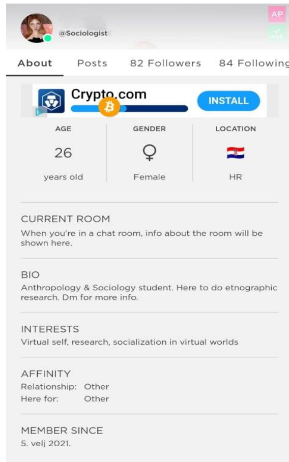
Slikovni prilog 3. Kartica profila

dolaskom u virtualni svijet, te je upravo taj opis često pokrenuo zanimljive rasprave unutar javnih prostorija.