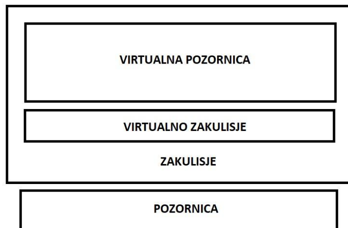
Slikovni prilog 4. Vizualni prikaz odnosa Goffmanovih i virtualnih zona

Naposljetku, moguće je raspravljati i o Goffmanovim pojmovima prednje i stražnje zone gdje se prednja zona odnosi na mjesto izvođenja nastupa pred publikom, a proscenij ili stražnja zona na mjesto iza pozornice. Ondje glumci mogu nesmetano isprobati svoj nastup, skinuti šminku i najvažnije, zaštićeni su od osuđujućeg pogleda publike 15 . U fizičkome svijetu takvo zakulisje bi bila sigurnost vlastitog doma, gdje je moguće odmaknuti se ili sakriti od izravnog pritiska društva. Jednako možemo promatrati i virtualni svijet, gdje je pozornica virtualna prostorija unutar koje stupamo u interakciju s drugima služeći se avатарom, a drugi plan privatna prostorija ili početni zaslon koji nam prikazuje avatara i gdje je moguće mijenjati njegov izgled. Razmišljajući o tim konceptima, kada pokušamo staviti u odnos virtualno i fizičko ili „stvarno” gdje pozicionirati virtualni svijet u odnosu na Goffmanove zone? Interakcije u virtualnom svijetu se često odigravaju u sigurnosti (svoga doma), drugome planu. Točnije rečeno, na virtualnu pozornicu stupamo iz sigurnosti „fizičkog zakulisja”. Kada se osoba pridruži chat sobi ona je kročila na virtualnu pozornicu i odigrava drugi nastup pred drugom publikom. Stoga bi se interakcije u virtualnom svijetu mogle zamisliti kako je