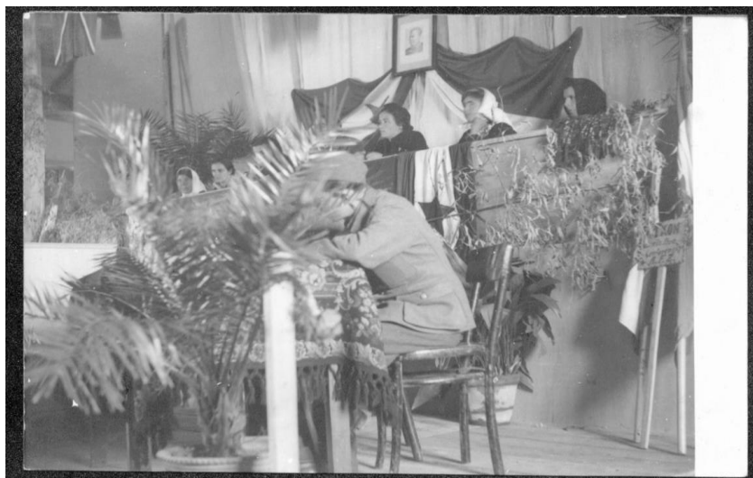
Slika 1. Baraka kod turskih kuća u Zadru u kojoj se odvijala prva Okružna konferencija AFŽ-a za okrug Zadar 15.11.1944. godine.

Zadarsko područje je od osnutka AFŽ-a 1942. pa do svibnja 1943. bilo dio Sjevernodalmatinskog okruga nakon čega se formira prvi Inicijativni odbor AFŽ-a za okrug Zadar. U obavijesti Oblasnom odboru AFŽ-a za Dalmaciju o ovoj vijesti žene pišu i o stanju na terenu: