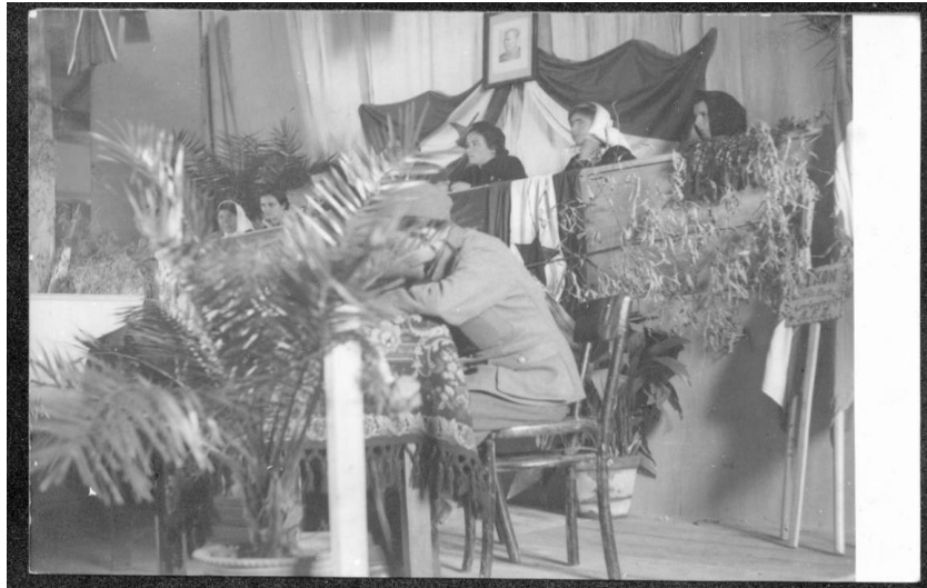
Slika 1. Baraka kod turskih kuća u Zadru u kojoj se odvijala prva Okružna konferencija AFŽ-a za okrug Zadar 15.11.1944. godine.

Zadarsko područje je od osnutka AFŽ-a 1942. pa do svibnja 1943. bilo dio Sjevernodalmatinskog okruga nakon čega se formira prvi Inicijativni odbor AFŽ-a za okrug Zadar. U obavijesti Oblasnom odboru AFŽ-a za Dalmaciju o ovoj vijesti žene pišu i o stanju na terenu: