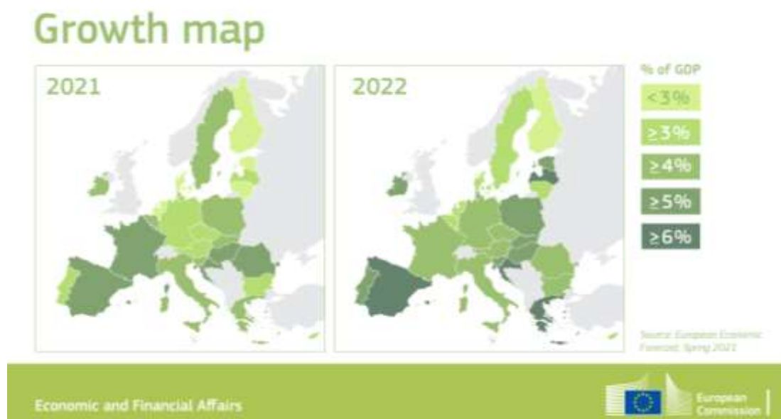
Slika 3. Proljetna gospodarska prognoza

12. svibnja 2021. objavljena je proljetna gospodarska prognoza. U usporedbi s prognozom u zimskoj ekonomskoj prognozi, ona pokazuje značajno poboljšanje rasta. Očekuje se da će gospodarstvo EU-a 2021. odnosno 2022. godine porasti za 4,2%, odnosno 4,4%. Iako se čini da stope rasta rastu različitim stopama, gospodarstva cijelih država članica EU-a trebala bi se 2022. godine vratiti na razinu prije krize. (Europska Komisija, 2020.)