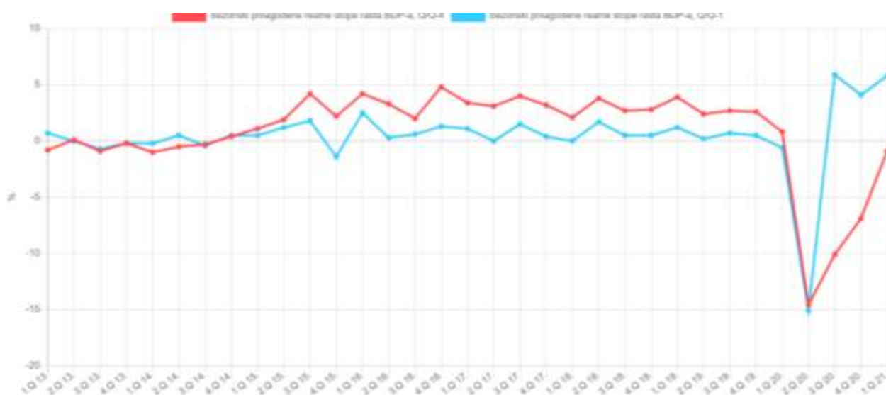
Grafikon 3. Stope tromjesečnog BDP-a od 2013. - 2021.g

No ekonomska aktivnost oštro se ubrzava u prvom kvartalu 2021. u odnosu na prethodno tromjesečje, iz čega zaključujemo da se gospodarstvo uzlazno oporavlja. Prve procjene, naime, pokazuju da je BDP u prvom kvartalu 2021. manji za 0,7% nego u istom kvartalu 2020., što je mnogo lakši pad nego što je bio u četvrtom kvartalu 2020., kada je iznosio 7,2%. (DZS, 2021.)