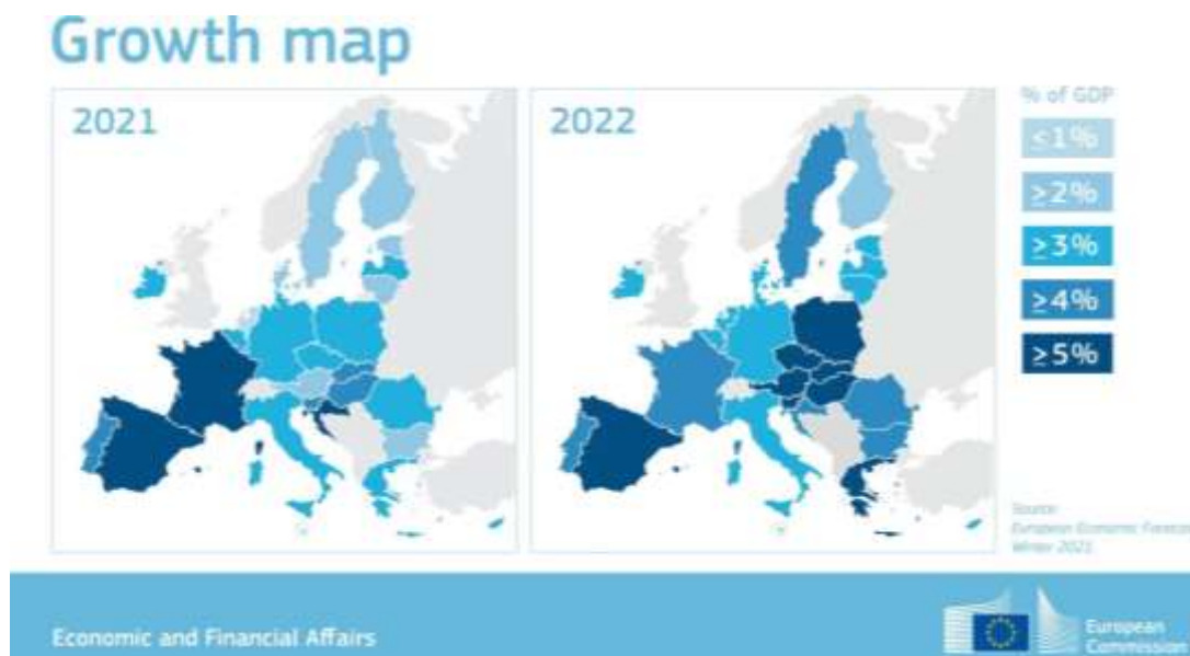
Slika 2. Zimska gospodarska prognoza

Na stranicama Europske Komisije istaknute su gospodarske prognoze 2021. koje je objavilo Europsko Vijeće i u kojima se predviđaju brzine oporavka gospodarstva za svako europodručje ovisno o kvartalima.