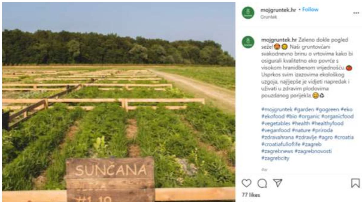
Slika 5. Vrtovi s vlastitim imenom