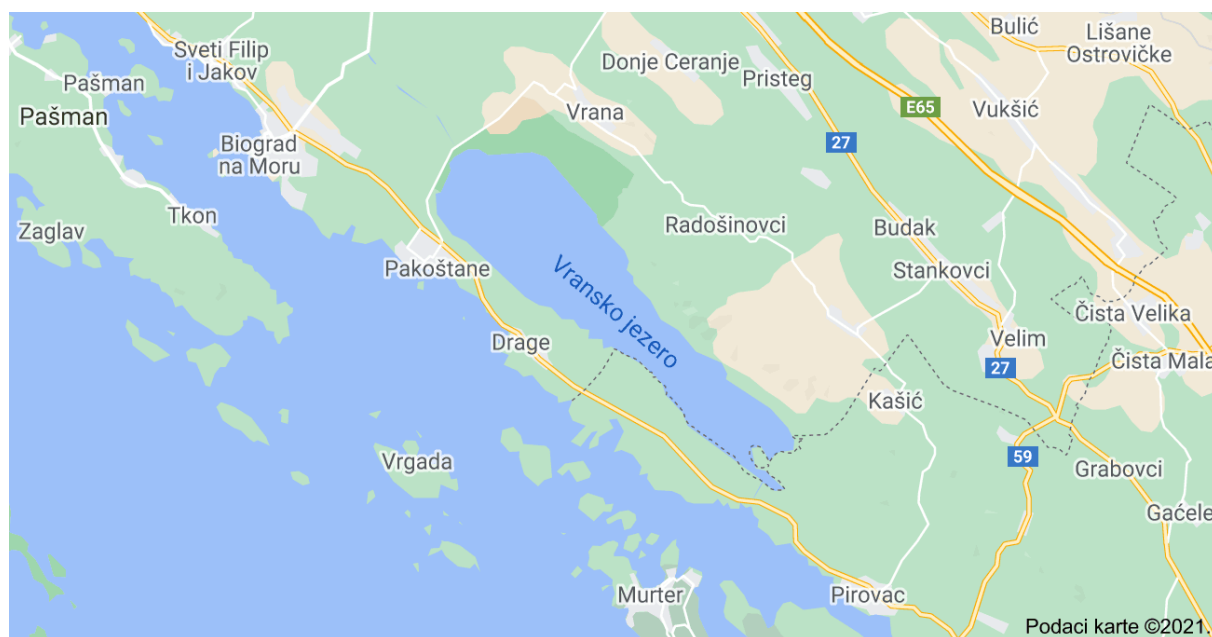
Slikovni prilog 1. Geografski položaj Vranskog jezera 3

Vransko jezero najveće je prirodno jezero i jedno od posljednjih mediteranskih močvara u Republici Hrvatskoj. Jezero je zapravo krško polje ispunjeno bočatom vodom te predstavlja kriptodepresiju. U sjeverozapadnom dijelu jezera nalazi se poseban ornitološki rezervat s najvećom gnijezdećom populacijom malog vranca. Također, ovo je područje zimovalište za preko 100.000 jedinki ptica vodarica. Posebna vrijednost Vranskog jezera prepoznata je još 1983. godine kada je njegov sjeverozapadni dio proglašen posebnim ornitološkim rezervatom, a 1999. godine kao jedno od rijetkih staništa ptica s izvorima pitke vode te je kao područje posebne bioraznolikosti Vransko jezero proglašeno je Parkom prirode. Zabilježene su ukupno 264 vrste ptica, a znanstvena istraživanja navode kako će močvare, zbog ogromne fiksacije CO_2 , u budućnosti imati ključnu ulogu u zaštiti živih bića, ljudi i globalnog zagrijavanja.