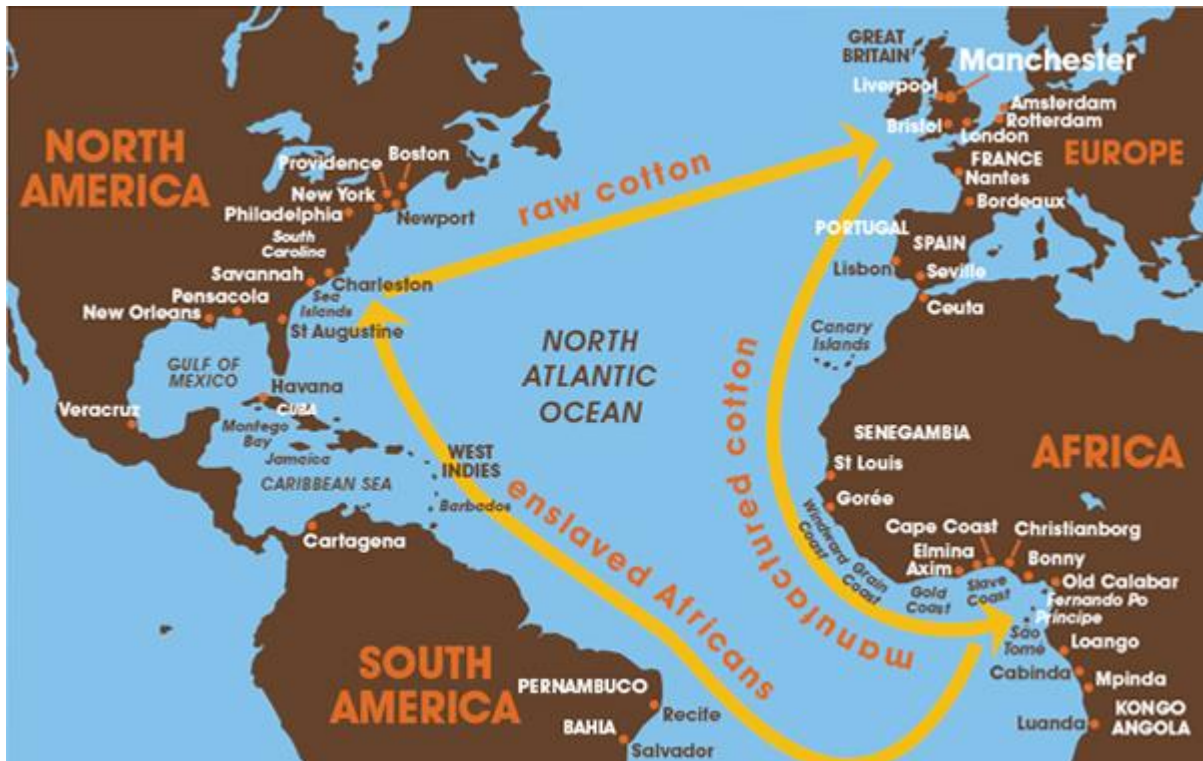
Slika 1. Karta trgovine sirovine pamuka između Ujedinjenog Kraljevstva i Sjedinjenih Američkih Država u 18. i početkom 19. stoljeća 5