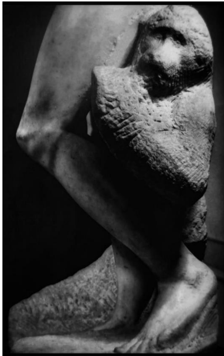
Slika 1. Michelangelo, Umirući rob (detalj), 1513.-1516., Louvre, Pariz