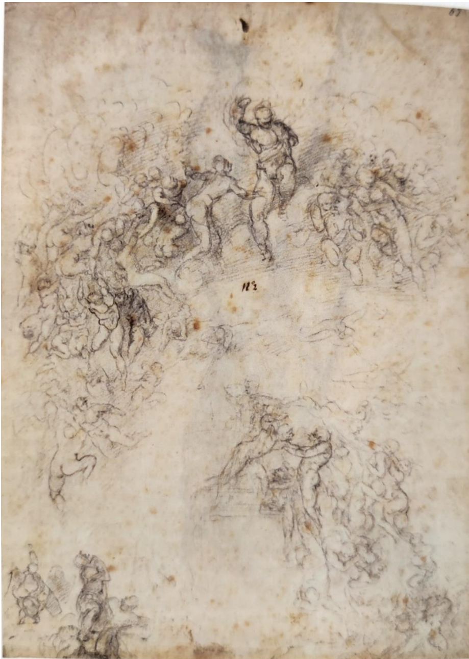
Slika 3. Michelangelo, kompozicijska skica za Posljednji sud , 1533./1534., Casa Buonarroti, Firenca