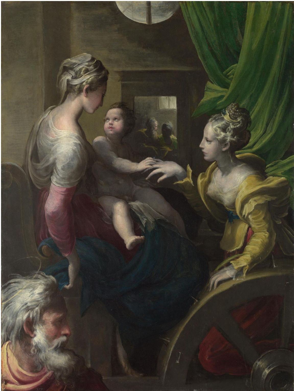
Slika 6. Parmigianino, Mistično vjenčanje sv. Katarine , c. 1527., The National Gallery, London