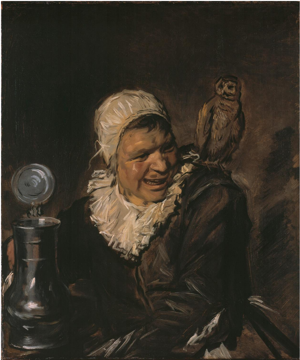
Slika 7. Frans Hals, Malle Babbe , 1633./1635., Staatliche Museen zu Berlin, Gemäldegalerie