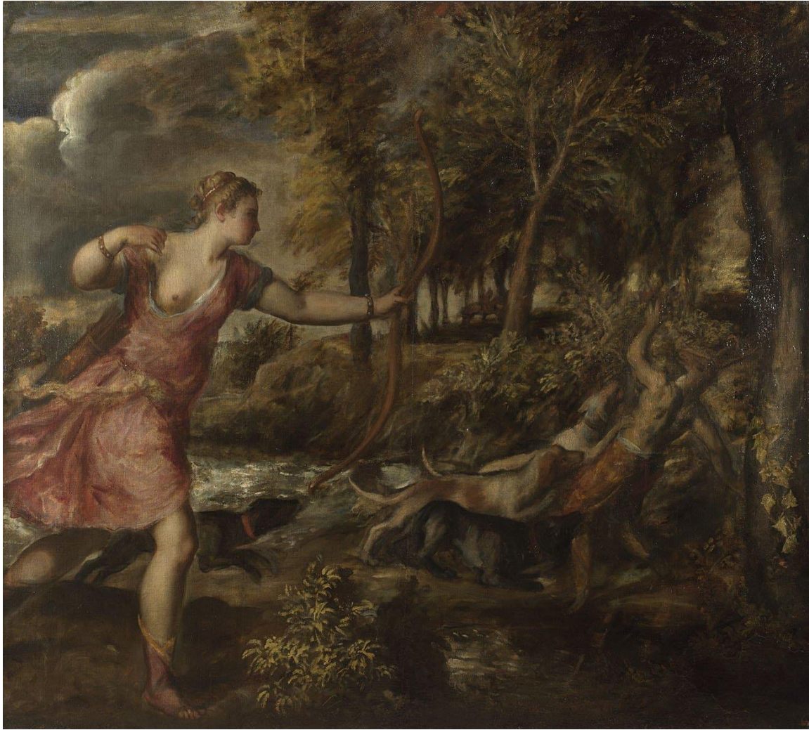
Slika 4. Tizian, Smrt Akteona , c. 1559. – 1575., The National Gallery, London