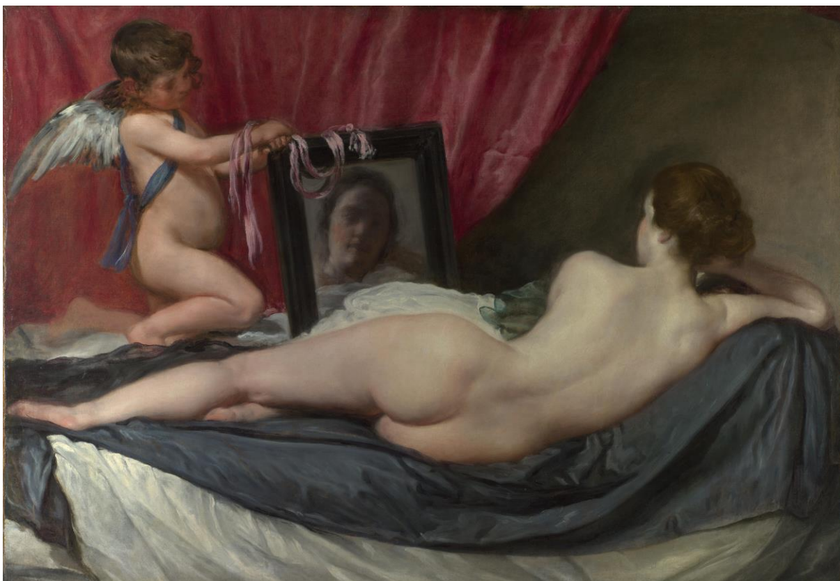
Slika 8. Velázquez, Venera pred zrcalom , 1644.-1648., Uprava Nacionalne galerije, London (izvor: https://www.nationalgallery.org.uk/stories/one-painting-many-voices-velazquezs-the-rokeby-venus )