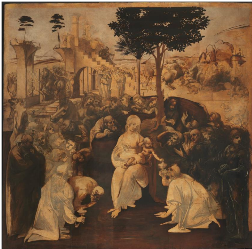
Slika 2. Leonardo, Poklonstvo kraljeva , 1481. – 1482., Galleria degli Uffizi, Firenca