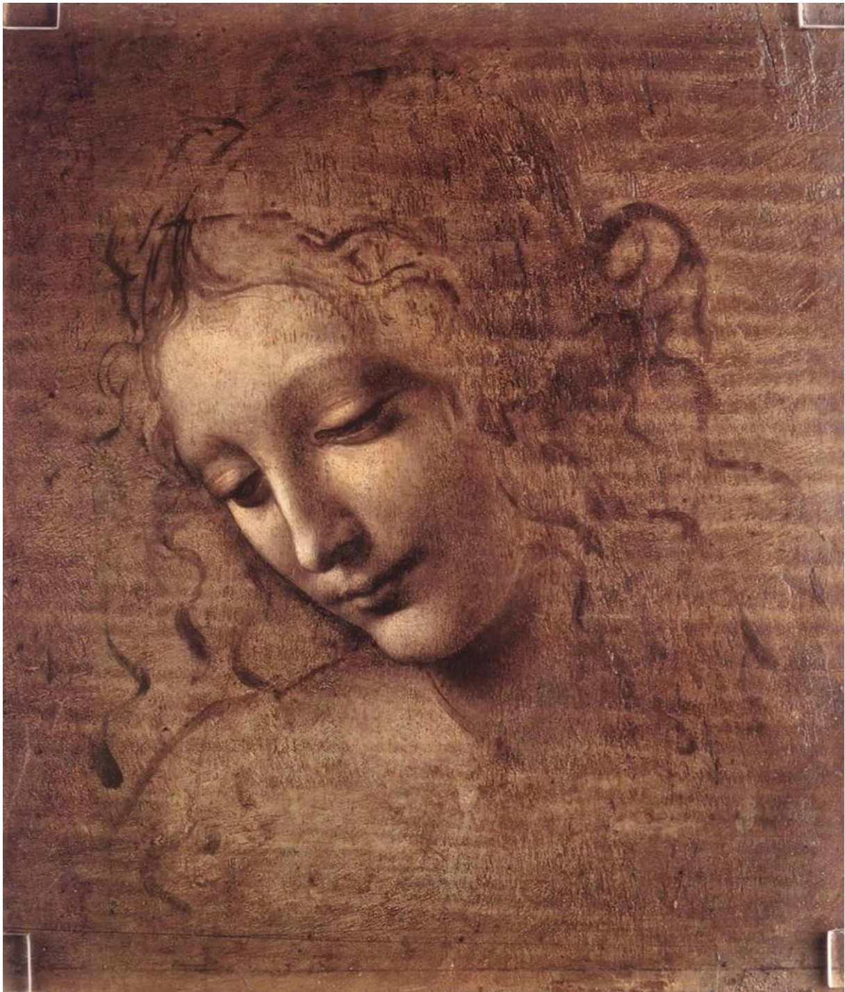
Slika 10. Leonardo (?), La Scapigliata , c. 1500. – 1505., Galleria Nazionale di Parma (izvor: https://www.wga.hu/frames-e.html?html/1/leonardo/04/2scapigl.html )