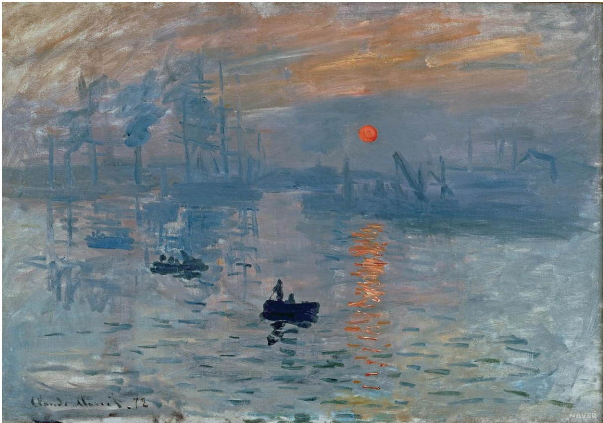
Slika 11. Claude Monet, Impresija, izlazak sunca , 1872., Musée Marmottan Monet, Pariz