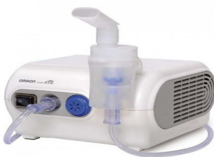
Slika 3. Nebulizer ili elektroraspršivač