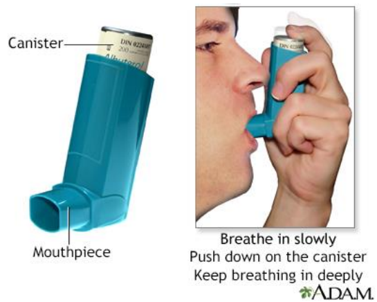
Slika 1. Inhaler aerosolom, Izvor: https://www.mountsinai.org/health-library/selfcare-instructions/how-to-use-an-inhaler-no-spacer