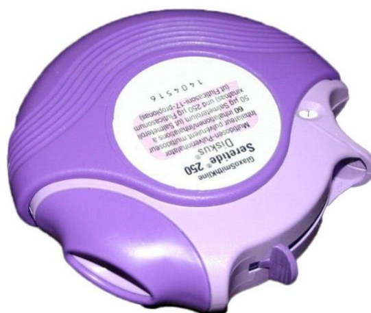
Slika 2. Diskus s praškom za inhalaciju