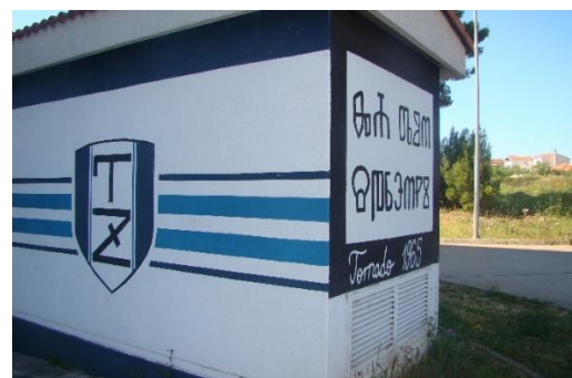
Slika 2. Trafostanica sa muralom na glagoljici