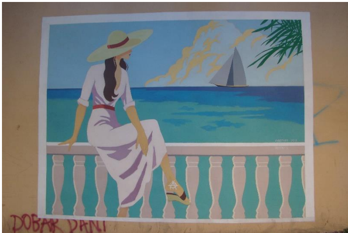
Slika 30. Valentino Radman - Ljeto