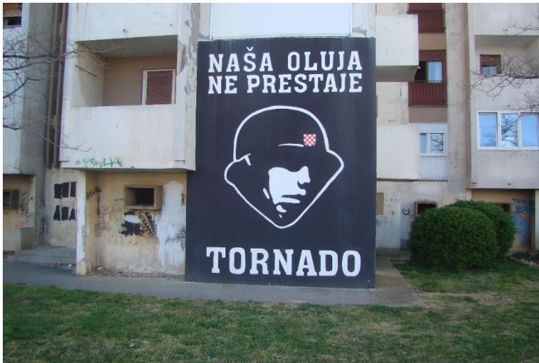
Slika 14. Politički mural - Bulevar

o tome kakvu poruku grad šalje gradu, odnosno svojim stanovnicima? Treba li podržavati ovakve intervencije? Svakako je jasno da navijači nisu imali lošu namjeru, ali prije bilo kakvog oslika, a kamoli ovako nečeg velikog što je dostupno svima, trebala bi se dobro proučiti ikonografija. Ovo je trebao biti oblik komemorativnog murala ali čak, uzevši u obzir da ovo i promatra turist, a ne netko tko razumije tekst, slika ima strašan ratni naboj. Za razliku od stvarnih navijačkih murala, ovaj kod ljudi ne budi ni osjećaj ponosa niti velike povijesti već asocira na rat, na neka ružna vremena.