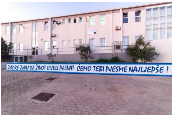
Slika 6. Mural uspomena - natpis

(stranica posjećena 29. kolovoza 2020. godine)