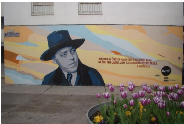
Slika 29. Blagoje Bersa