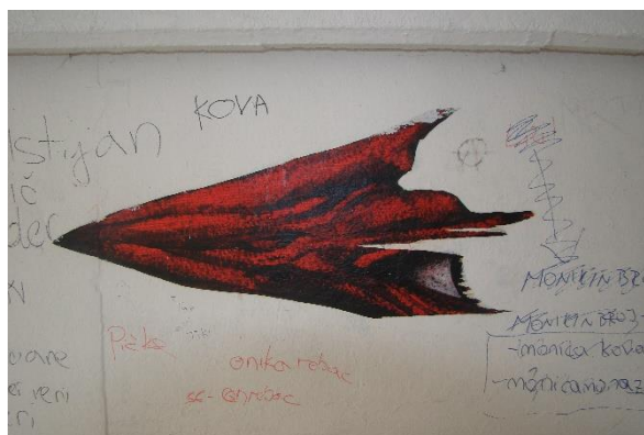
Slika 42. Pothodnik