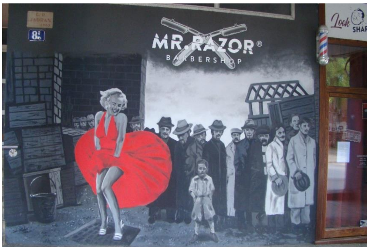
Slika 32. Marilyn Monroe – Voštarnica

godina. U drugom planu nalazi se dvadesetak muškaraca kako čekaju ulazu u brijačnicu. Ovaj mural i jest naslikan u te svrhe. Ispred prave, zadarske brijačnice. U prvom redu nalazi se Marilyn koja pokušava zadržati haljinu. Čitav mural naslikan je u crno bijelim tonovima, jedino u svemu odskače njena haljina koja je crvene boje. Zanimljivo je kako je haljina u filmu bijele, a ne crvene boje, ali je ovdje vjerojatno prikazana u boji kako bi se istaknula. Druga zanimljivost su muškarci koji promatraju glumicu, a zapravo su preuzeti sa fotografija iz razdoblja Velike depresije. 153 Ovo je također drugačiji jezik, posebno jer prikazuje osobu koja nema doticaja sa gradom Zadrom. Naslikana je isključivo po želji naručioca, odnosno vlasnika brijačnice koji je htio uljepšati svoj prostor nečim tematski drugačijim. Iako nema nikakve konkretne veze sa Zadrom Marilyn Monroe je osoba koja je globalno poznata, a s obzirom da se na pločniku nalazi natpis "stand here" znatiželjni prolaznici mogu se fotografirati te imati uspomenu sa ovog mjesta. Iako nema poveznice sa gradom, svakako je mural odradio svoju ulogu, zaintrigirao je prolaznike koji se zaustavljaju kraj ovog rada te je uređena još jedna gradska površina.