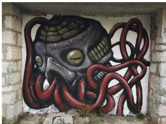
Slika 23. Dissenso Cognitivo – Punta Bajlo 2