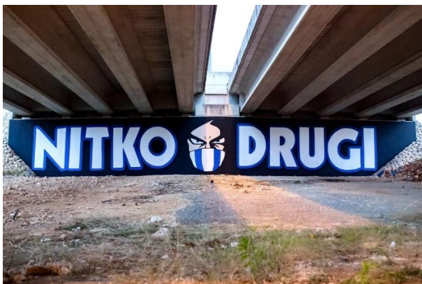
Slika 3. Nitko drugi