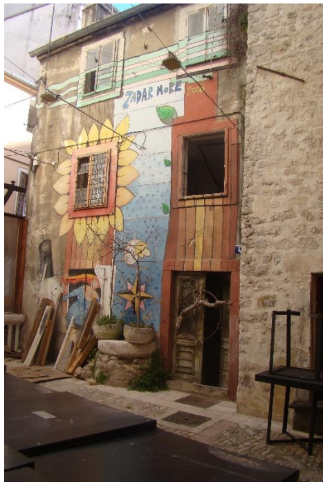
Slika 45. Zaljubljeni podlanac – Varoš

nalaze razni oslici, od mrtve prirode do morskih motiva. I sami zidovi koje su prebojili, ukasili su raznim motivima. Ovo je projekt koji je planiran u trajanju od tri godine no nije zaživio na području Zadra.