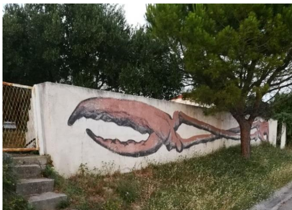
Slika 20. Dissenso Cognitivo - Kolovare