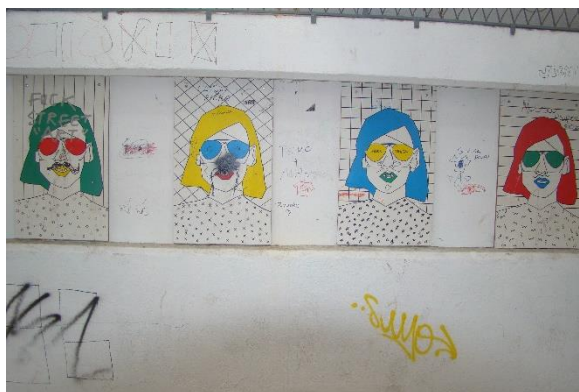
Slika 40. Pothodnik