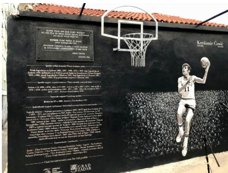
Izvor: KK Zadar fans ,

https://www.facebook.com/kkzadarfans/photos/a.1532228433675867/2816800235218674/ (posjećeno 4. rujna 2020.)