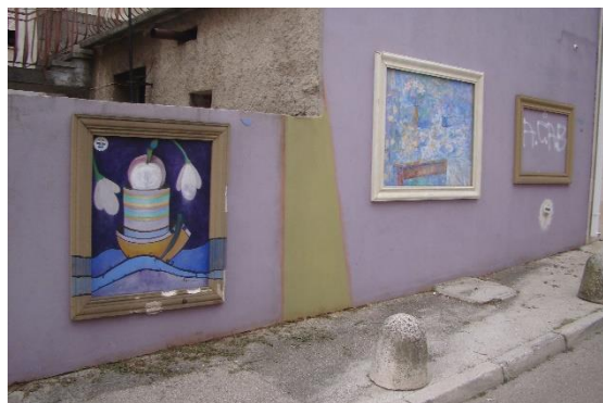
Slika 46. "Open air" galerija – Cerarija