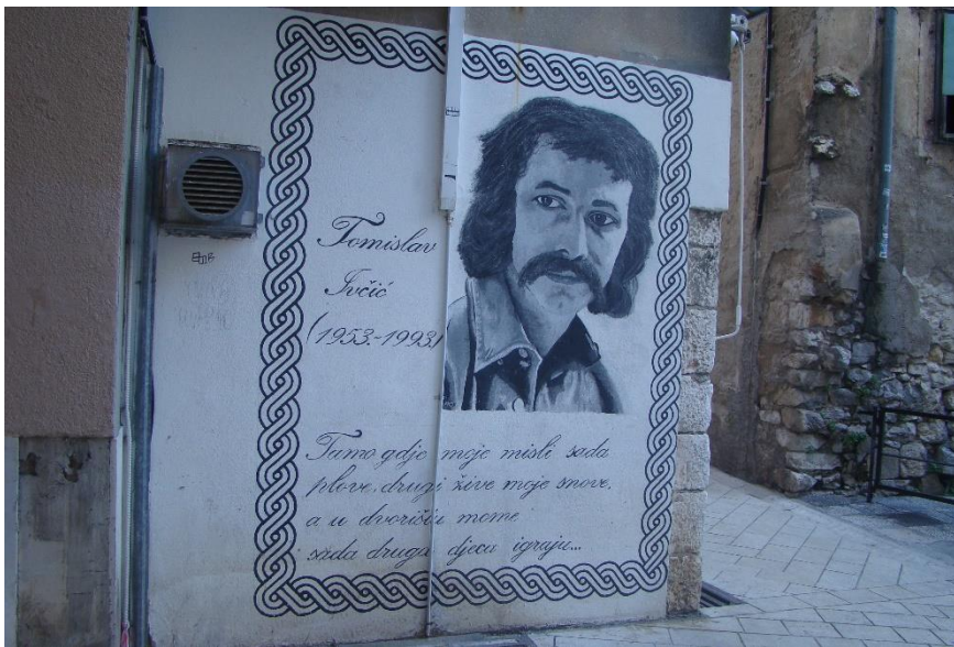
Slika 13. Tomislav Ivčić

te godine rođenja i smrti, nalazi se tekst jedne njegove pjesme – "Tamo gdje moje misli sada plave, drugi žive moje snove, a u dvorištu mome sada druga djeca igraju..." Inače se posljednji stih često koristi na nekim drugim muralima te sugerira prolaznost vremena. Prošlost je nešto što je prošlo i ta vremena ne možemo vratiti, ali dolaze druge generacije i ovisi koliko je društvena memorija izražena, odnosno koliko je neki diskurs snažan, toliko će i uspomene biti snažne. Iz opisanog murala vidljivo je kako je uspomena na pjevača i dalje živa s obzirom da su mural vjerojatno oslikali mladići koji su u to vrijeme bili djeca, a možda i nisu bili rođeni.