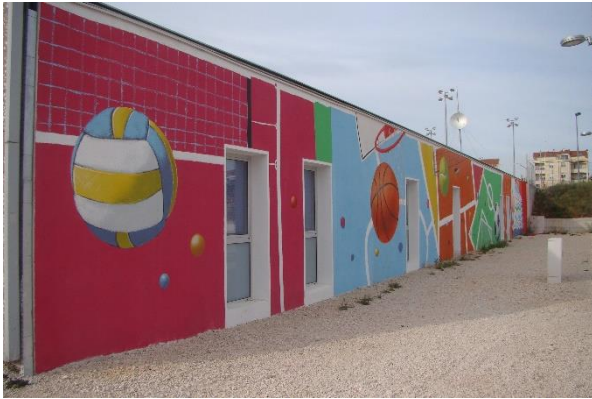
Slika 37. Sportovi – Višnjik