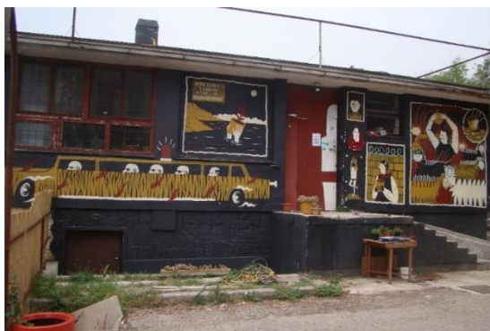
Slika 24. Nigdjezemska