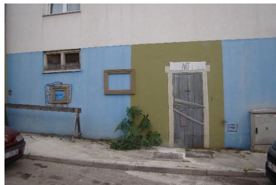
Slika 47. "Open air" - Cerarija