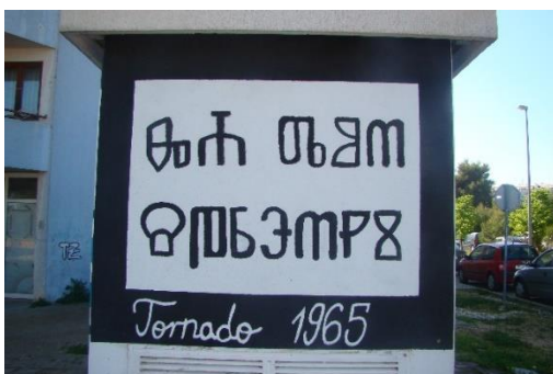
Slika 1. Mural sa glagoljicom

Većina nas zna pojedina slova glagoljice ili pri pogledu na ovo pismo ponosno kažemo kako je to glagoljica jer smo prepoznali dio baštine, ali zapravo rijetki od nas zaista čitaju ovo pismo. S obzirom na boje koje dominiraju muralom, pomisao je kako tu piše nešto što se odnosi na košarku, na ljubav prema klubu te je zatečenost nakon saznanja normalan slijed događaja. Mural je naslikan na jednoj trafostanici, sa sve četiri strane, te osim ovog natpisa ima grb Tornada Zadar, odnosno Slova T i Z unutar štita. Sve je naravno zaokruženo plavo bijelom bojom. Ipak, ono o čemu ponovo trebamo razmisliti jest na koji način se mladima predstavlja povijest i njihova baština te jesmo li svi dovoljno dobro upoznati sa povijesnim činjenicama. Članci na koje se rad referira, u sebi imaju fotografije koje dokazuju nastanak ovog pozdrava. Takva fotografija u članku, obrazloženje znanstvenika zašto nešto nije u redu koristiti, a naposljetku i riječi same predsjednice države koja se u novinama ispričavala jer je koristila ovaj pozdrav, zaista nas tjera da ponovno preispitamo neke činjenice.