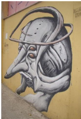
Slika 19. Dissenso Cognitivo – Nigdjezemska