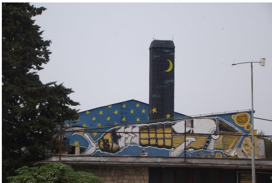
Slika 25. Nigdjezemska - krov

sa Dissenso Cognitivo. Iako nije jednako zastrašujuće, poveznica je moguća jer se uz prirodne oblike dodaju pomalo futuristički oblici. S obzirom na tekst koji se nalazi sasvim desno "Saliamo dal profondo" što znači podižemo se iz dubina, zaista sugerira kako ovdje može biti riječ o kitu, a sa one druge strane, strane diskursa može asociirati na čitav kolektiv koji boravi unutar Nigdjezemske. Kolektiv koji postoji unatoč snažnom autoritativnom diskursu unutar grada, koji je zauzeo maleni komadić unutar kojeg nastoje živjeti po vlastitim pravilima. Imaju svoj poseban identitet i ovim muralom se možda želi reći kako su oni nastanili ovaj prostor te supkultura ima svoje mjesto unutar grada.