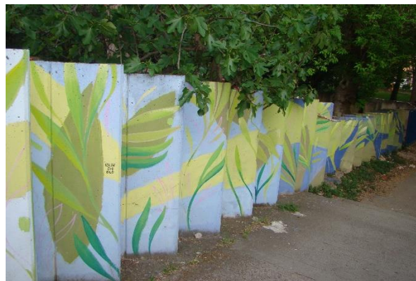
Slika 28. Stube Slavoljuba Penkale – Vruljica 2