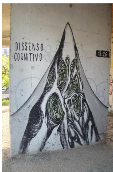
Slika 18. Dissenso Cognitivo – Ričine 2