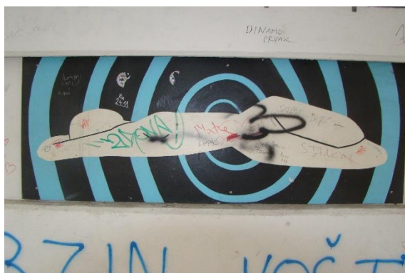
Slika 41. Pothodnik