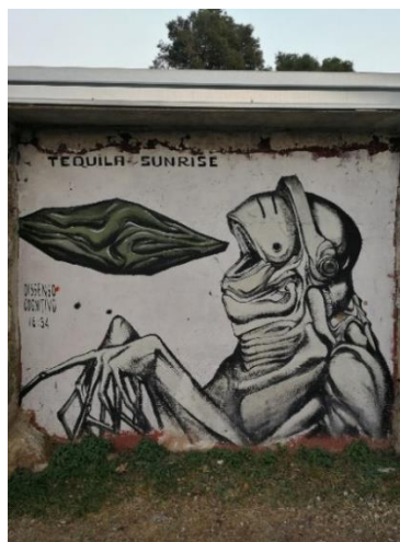
Slika 22. Dissenso Cognitivo – Punta Bajo