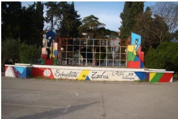
Slika 44. Pozornica Novi kampus