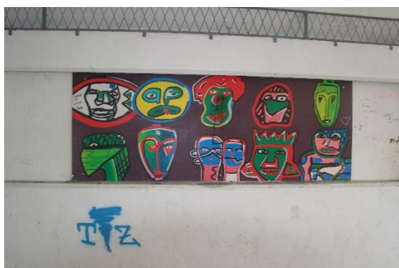
Slika 39. Pothodnik