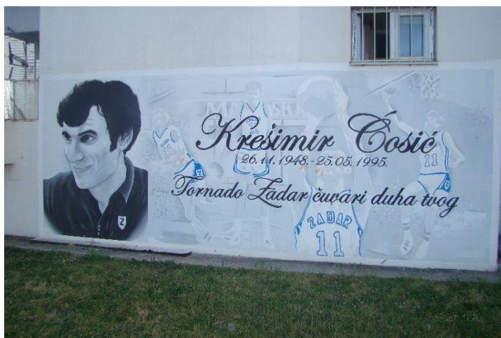
Slika 10. Krešimir Ćosić – Bulevar