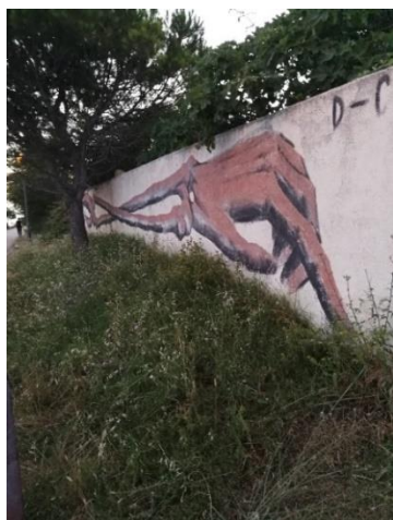
Slika 21. Dissenso Cognitivo – Kolovare 2