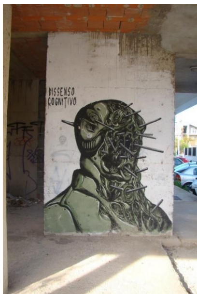
Slika 17. Dissenso Cognitivo – Ričine

zaustavljaju uz njegova djela te se pitaju što ona predstavljaju. Sa aspekta nasljeđa i konstantnog vraćanja u prošlost, odnosno pokušaja da prošlost održimo u sadašnjosti ovdje je prikazan potpuno drugačiji trenutak. Ovaj umjetnik o prošlosti uopće ne razmišlja, već iz sadašnjosti gleda prema budućnosti. Ne pita se što je bilo, što treba sačuvati iz prošlosti, već se pita kuda idemo i koja je krajnja granica čovječanstva. Svakako je zanimljivo susresti se s ovakvim likovnim izričajem. Također, iako se može pronaći nekoliko intervjua na web stranicama, želi ostati anonimn jer ne želi da ljudi povezuju njegovu umjetnost kroz njegov lik, već da ju dožive u njenom punom sjaju. Samu umjetnost, bez umjetnika. Voli svoju anonimnost, smatra kako je "neovlašćena" komponenta važna za uličnu umjetnost, kako ova vrsta umjetnosti, jednako kao i grafiti, mora i treba zadržati svoju anonimnost kako bi bila održiva.