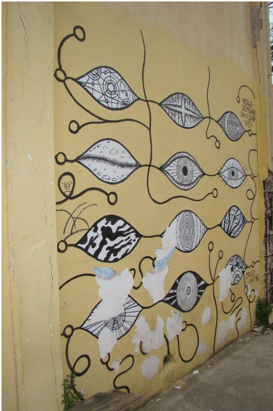
Slika 26. Nigdjezemska – Drugo uho