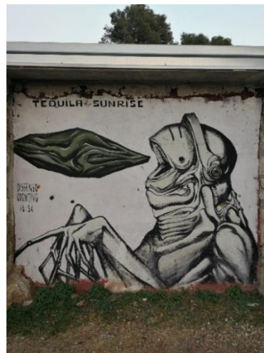
Slika 22. Dissenso Cognitivo – Punta Bajo