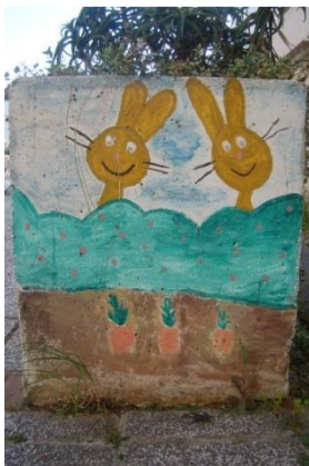
Slika 35. Dječji park – Labirint