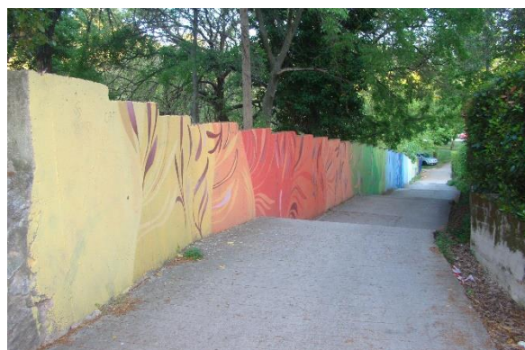
Slika 27. Stube Slavoljuba Penkale – Vruljica