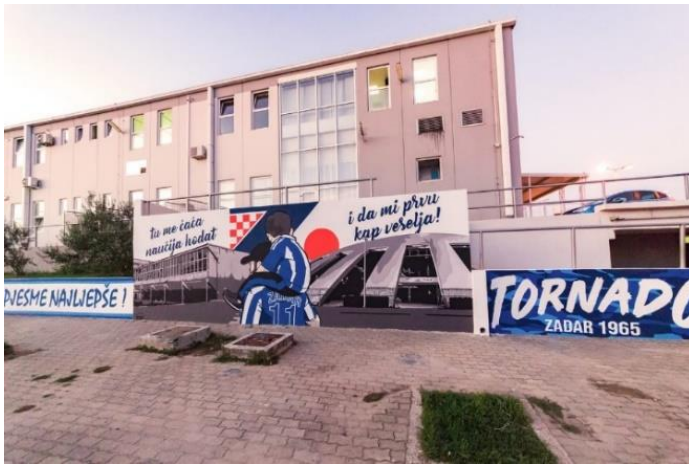
Slika 5. Mural uspomena