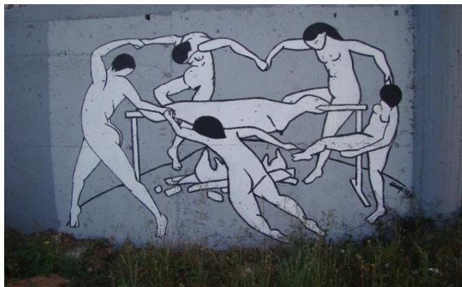
Slika 31. Zadarski Matisse – Bili Brig