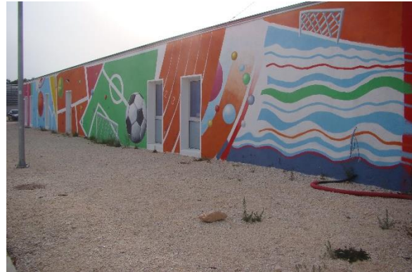
Slika 38. Sportovi 2 – Višnjik