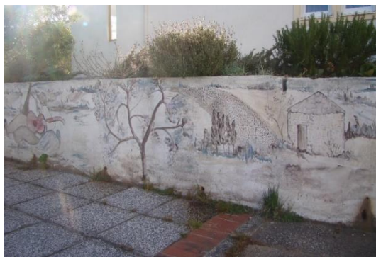
Slika 36. Dječji park 2 – Labirint