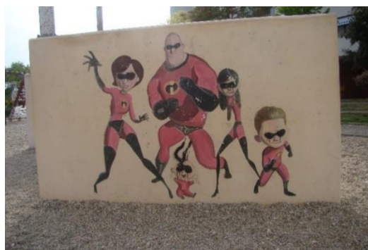
Slika 34. Dječji park 2 - Višnjik