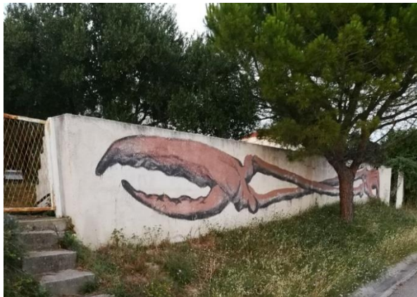
Slika 20. Dissenso Cognitivo - Kolovare