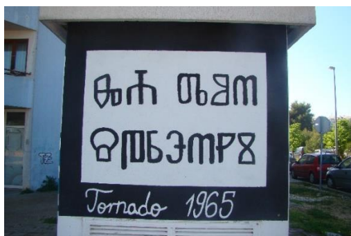
Slika 1. Mural sa glagoljicom

Većina nas zna pojedina slova glagoljice ili pri pogledu na ovo pismo ponosno kažemo kako je to glagoljica jer smo prepoznali dio baštine, ali zapravo rijetki od nas zaista čitaju ovo pismo. S obzirom na boje koje dominiraju muralom, pomisao je kako tu piše nešto što se odnosi na košarku, na ljubav prema klubu te je zatečenost nakon saznanja normalan slijed događaja. Mural je naslikan na jednoj trafostanici, sa sve četiri strane, te osim ovog natpisa ima grb Tornada Zadar, odnosno Slova T i Z unutar štita. Sve je naravno zaokruženo plavo bijelom bojom. Ipak, ono o čemu ponovo trebamo razmisliti jest na koji način se mladima predstavlja povijest i njihova baština te jesmo li svi dovoljno dobro upoznati sa povijesnim činjenicama. Članci na koje se rad referira, u sebi imaju fotografije koje dokazuju nastanak ovog pozdrava. Takva fotografija u članku, obrazloženje znanstvenika zašto nešto nije u redu koristiti, a naposljetku i riječi same predsjednice države koja se u novinama ispričavala jer je koristila ovaj pozdrav, zaista nas tjera da ponovno preispitamo neke činjenice.