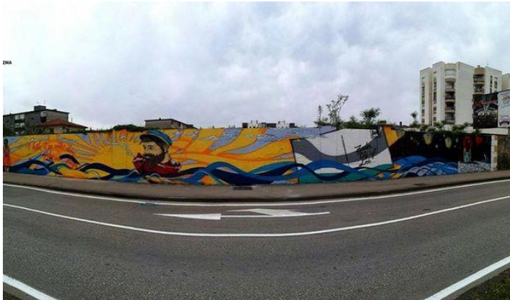
Slika 43. Hvala ti za svaki tren djevojčice draga