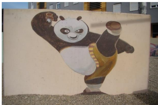
Slika 33. Dječji park – Višnjik