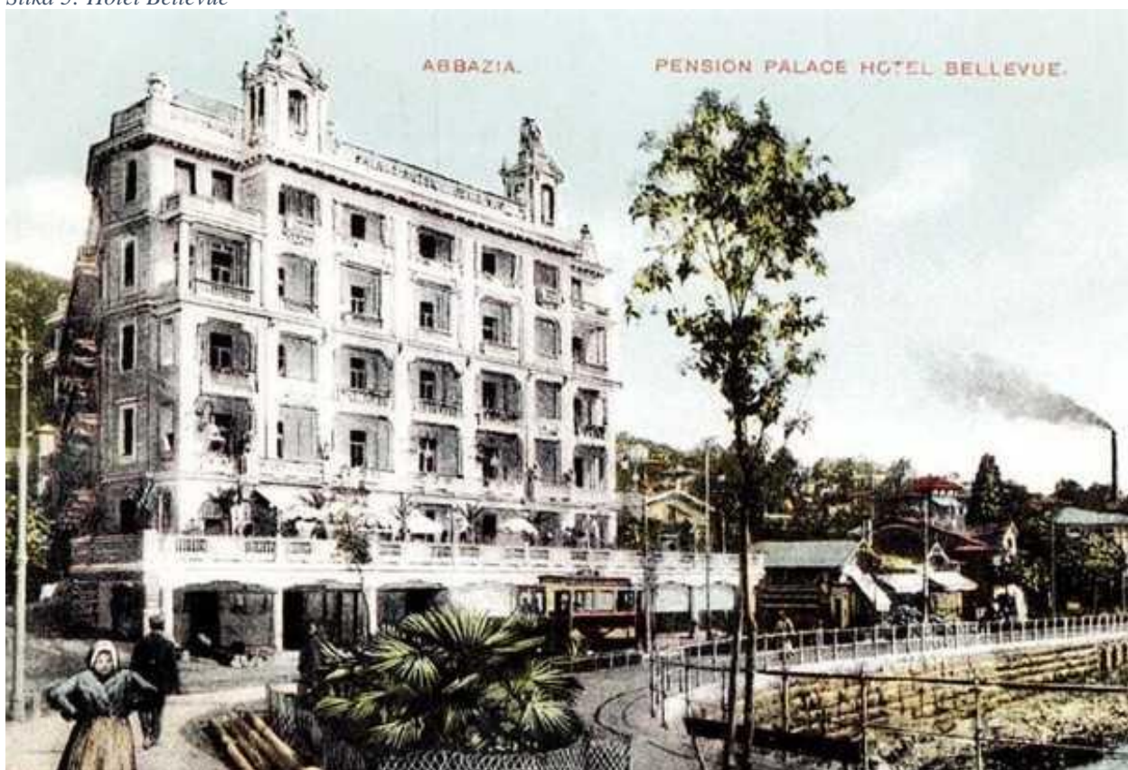
Slika 5: Hotel Bellevue