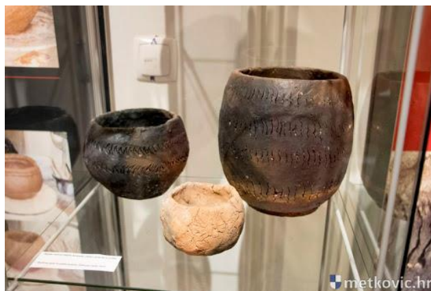
Slika 10. Keramičke posude