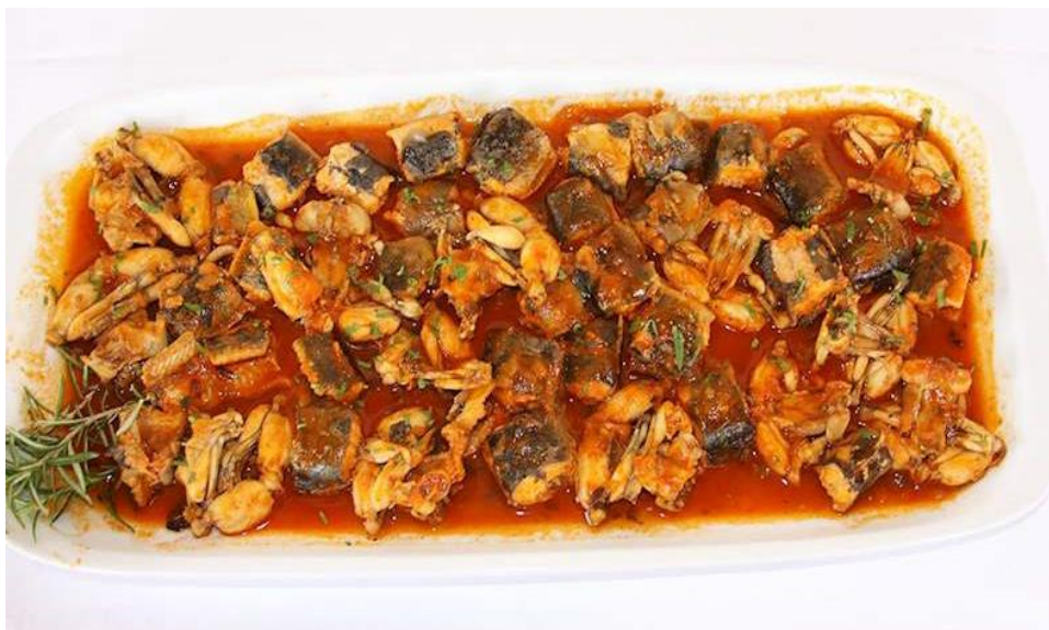
Slika 14. Neretvanski brodet

Kulturno-zabavne priredbe može nadopuniti privlačna gastronomska ponuda. Neretvanska kuhinja koja je obogaćena autohtonim specijalitetima (žablji kraci, ptice, ribe, jegulja), koji su pripremljeni na raznovrsne načine, dobro su poznati i izvan granica donjoneretvanskog kraja. Uz bogatu gastronomsku ponudu, treba istaknuti domaća neretvanska vina vinarije (Prović, Rizman, Volarević), od kojih su neka vina nagrađena na inozemnim i domaćim sajmovima. Otkrivanje neretvanskih zanimljivosti sigurno će biti razlogom za ponovni povratak u slikoviti kraj Hrvatskog primorja (Curić, 1994).