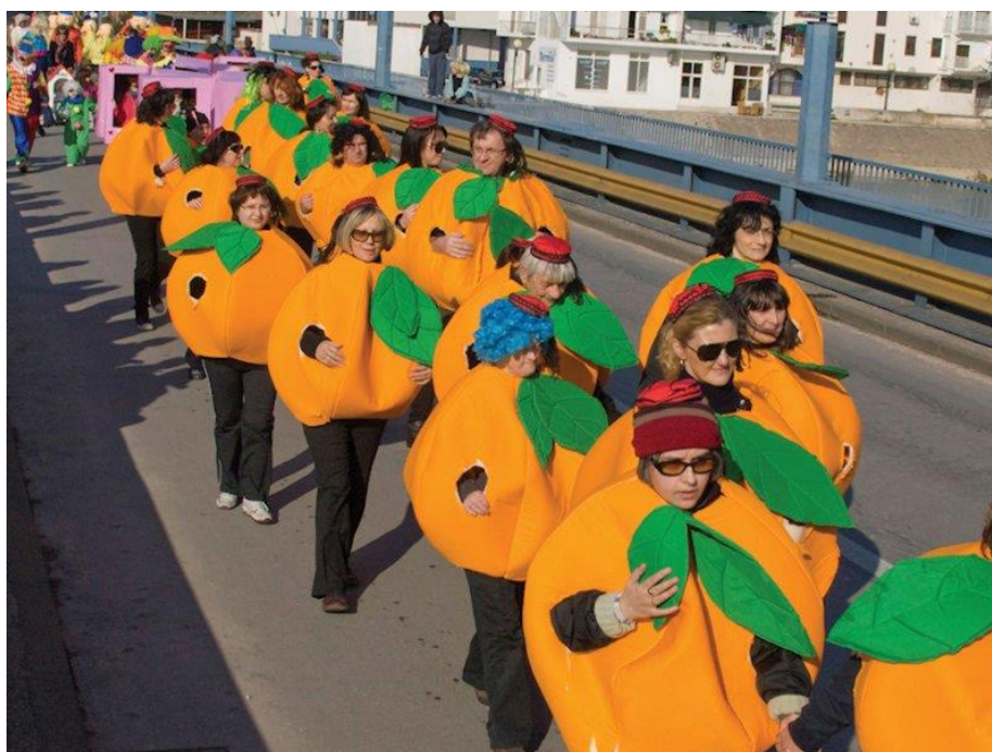
Slika 17. Pokladna povorka