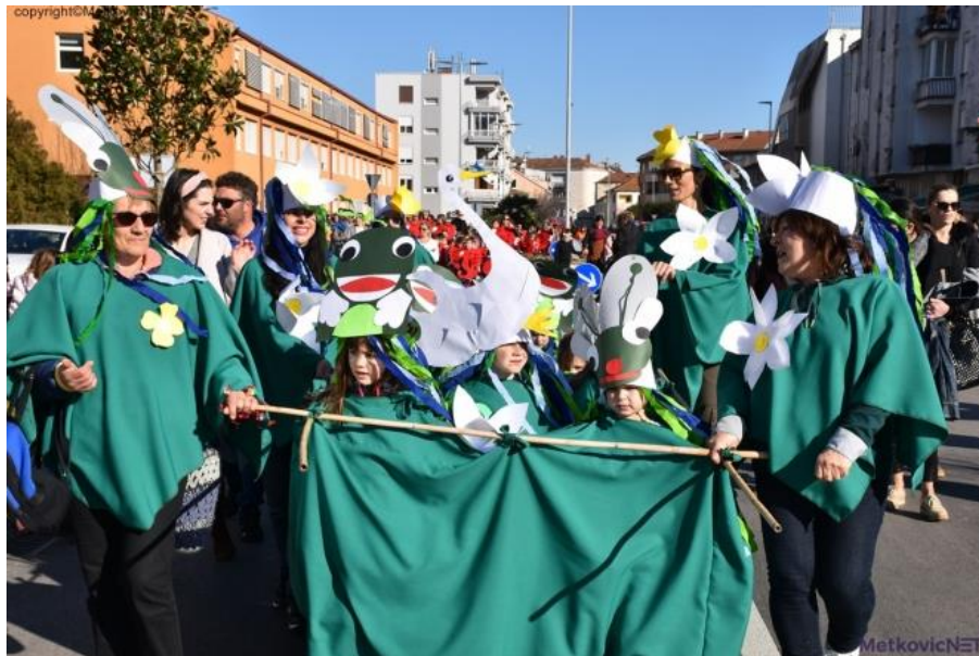
Slika 16. Pokladna povorka

učenici žele sudjelovati i u kojima mogu povezati likovnost i baštinu. Učenici komentiraju kostime ostalih učenika i hvale njihov rad i trud. Pitamo učenike ima li nešto što bi drugačije napravili u ovom projektu, potičemo ih da kritički zaključuju i daju svoje prijedloge.