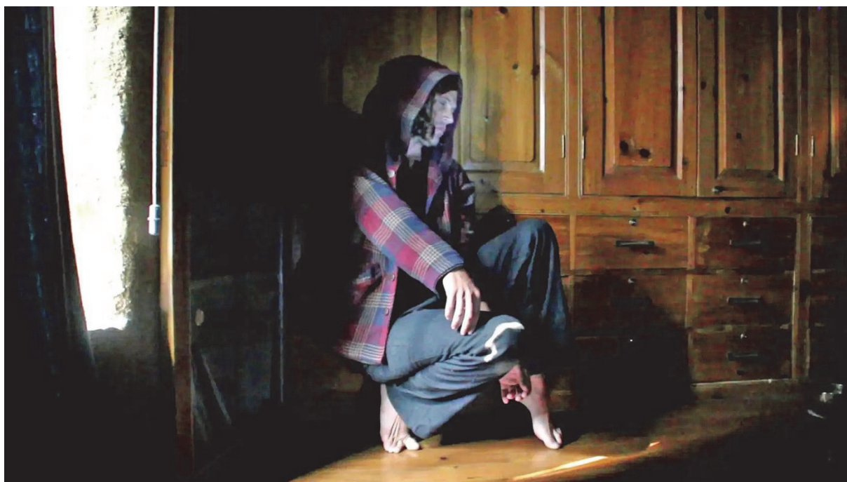
3. Subbody Resonance Butoh Himalaya, 2018.

Uvođenje nestajanja, truljena u tijelo i izvedbeni vokabular, odluka je povezana s proširenjem razumijevanja tijelo-uma, relativizacijom ljudske forme, identiteta, kao i naglašavanje transformativnosti i prolaznosti života. Duboka koncentracija i detaljna svijest o transformaciji unutarnje kvalitete koju, s obzirom na dugotrajnost vježbi, izvođač istovremeno i gradi i promatra kako nastaje, primjer je ekstenzije bez tehnologije i kratak uvid u mogućnosti rizomatskog povezivanja i utjelovljenja različitih mogućnosti bivanja.