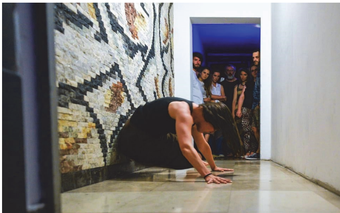
11. Dozivanje , Kustoska platforma, KNAP, 2018.

Kroz glasovnu improvizaciju i improvizaciju pokretom u navedenom prostoru istraživala sam različite tjelesne rezonatore, odnos pozicije tijela i glasa, odnos glasa i intencije, prepuštanja i kontrole. Pokušala sam u vlastitom tijelu oživjeti Glihine Gromače , prizvati primordijalno, necenzurirano, arhetipsko. Improvizacije su trajale oko dvadeset minuta tijekom kojih sam pokušavala podsvjesne zapise prizvati na površinu. Odnos tijela i glasa funkcionirao je kao svojevrsni ulazak u specifično povišeno stanje, u kojemu se istovremeno odvija istraživanje, propuštanje, promatranje i stvaranje. Također, unutarnji doživljaj sličan je stanju transa u kojemu putem glasa otkrivam vlastite nepoznate karakteristike, inzistirajući na ekstremnom i ekstimmnom.