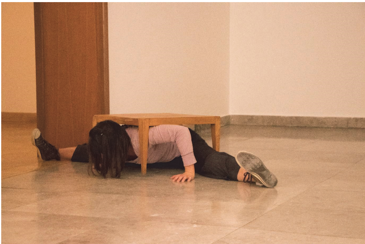
17. Horror Vacui , Barutana festival, Muzej likovnih umjetnosti, Osijek, 2018.

tekst, često bih se mučila s u unutarnjim kritičarem i morala bih donositi odluke o prepuštanju i ne procjenjivanju vlastitoga teksta. To je bilo puno zahtjevnije nego primjerice u radu s glasom, koji je funkcionirao kao automatski katapult u zonu bez prosudbi. Negdje u sredini, između prosudbe i intuicije, neprestano je klizio pokret.