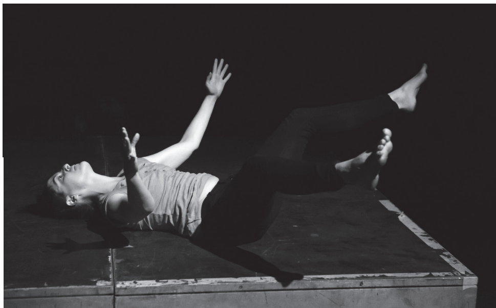
6. TASK Festival, Pogon Jedinstvo, foto: TASK Festival, 2015.