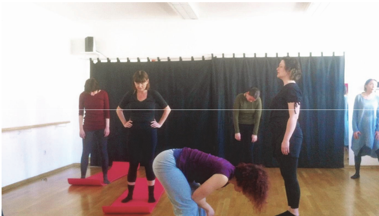
13. Polaznice radionice u KNAP – u, 2018.

- razgovor o balansu , načinima slušanja partnera, otporima pri kretanju