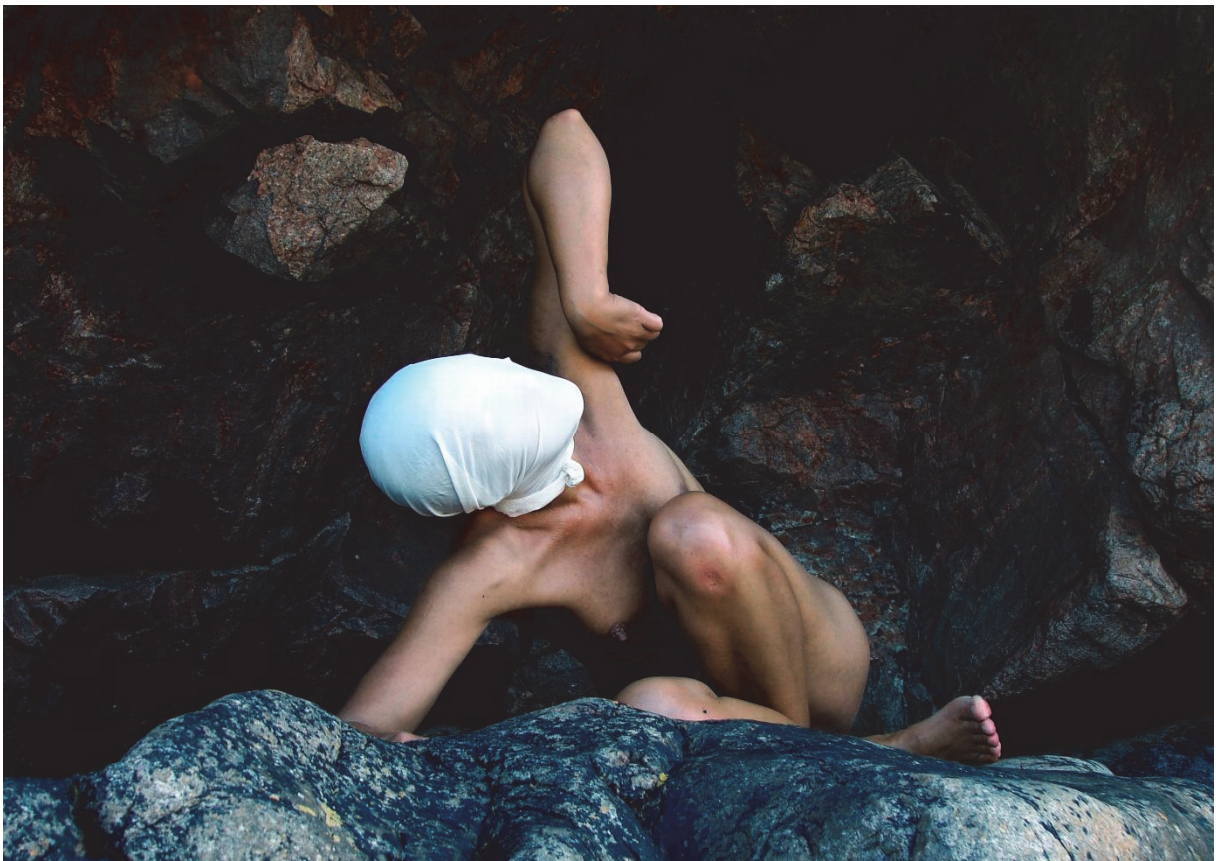
2. Su En Butoh Company, foto: Gunnar Stening, 2006.

Život svijesti je prožet intencionalnim lukom koji kroz nas odapinja našu prošlost/budućnost, i sveobuhvatnost pojedinačne egzistencije. Intencionalni luk tvori jединство osjeta i inteligencije, osjetljivosti i pokretnosti.