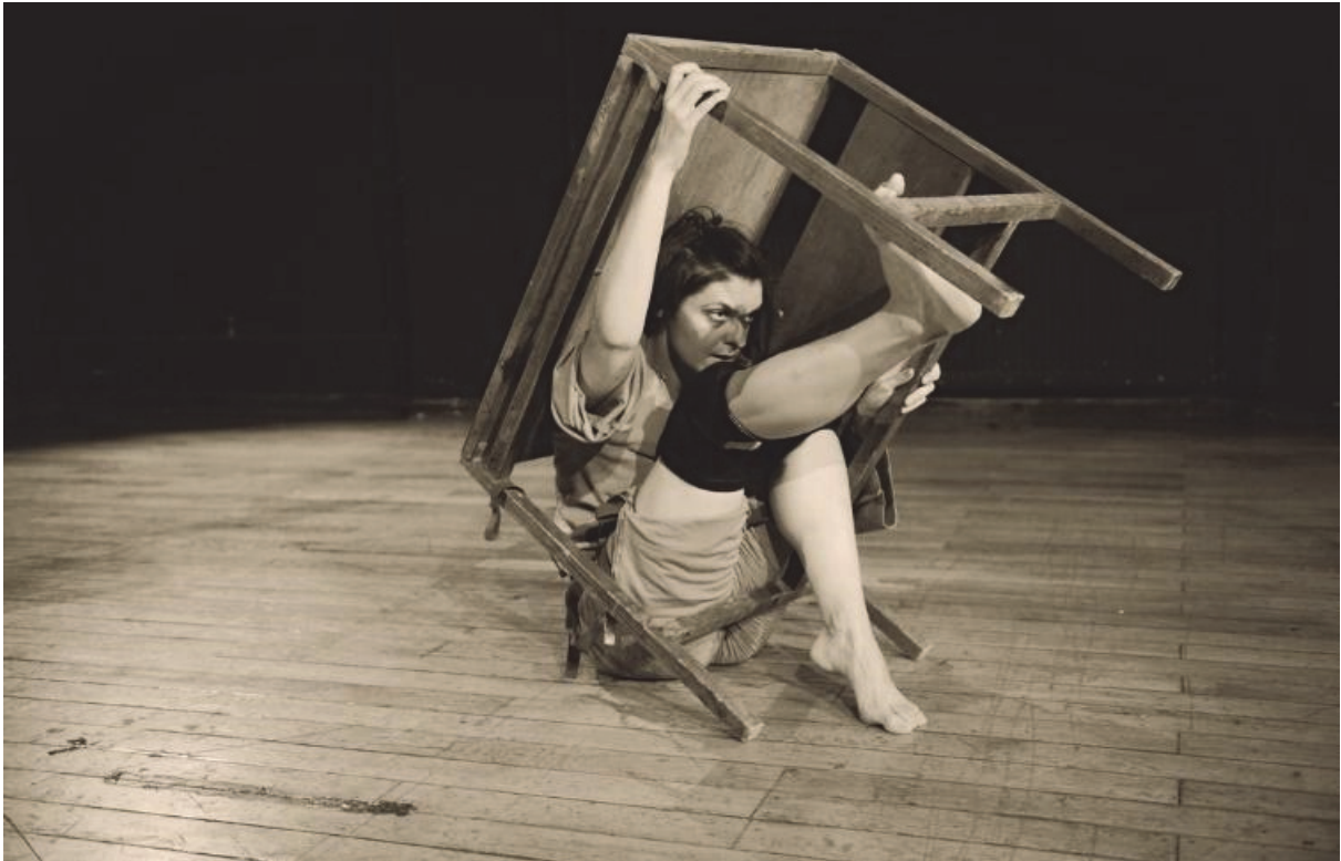
7. Rubberband, promo fotografija: Tomislav Čuveljak, 2016.

Dok je nekada nepoznato u nama bilo definirano kroz nagone i traume, danas, pod utjecajem neuroloških istraživanja i kognitivnih znanosti, nesvjesni dio atribuirao se brojnim organskim procesima koji se odvijaju ispod razine svijesti.