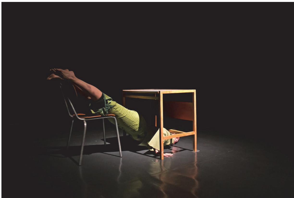
5. MKC Split, 2017.

Organizam dakle, ne postoji kao kognitivni subjekt prije nego što je ušao u odnos sa okolinom, već je okolina osnovni, konstitutivni element u stvaranju subjekta.