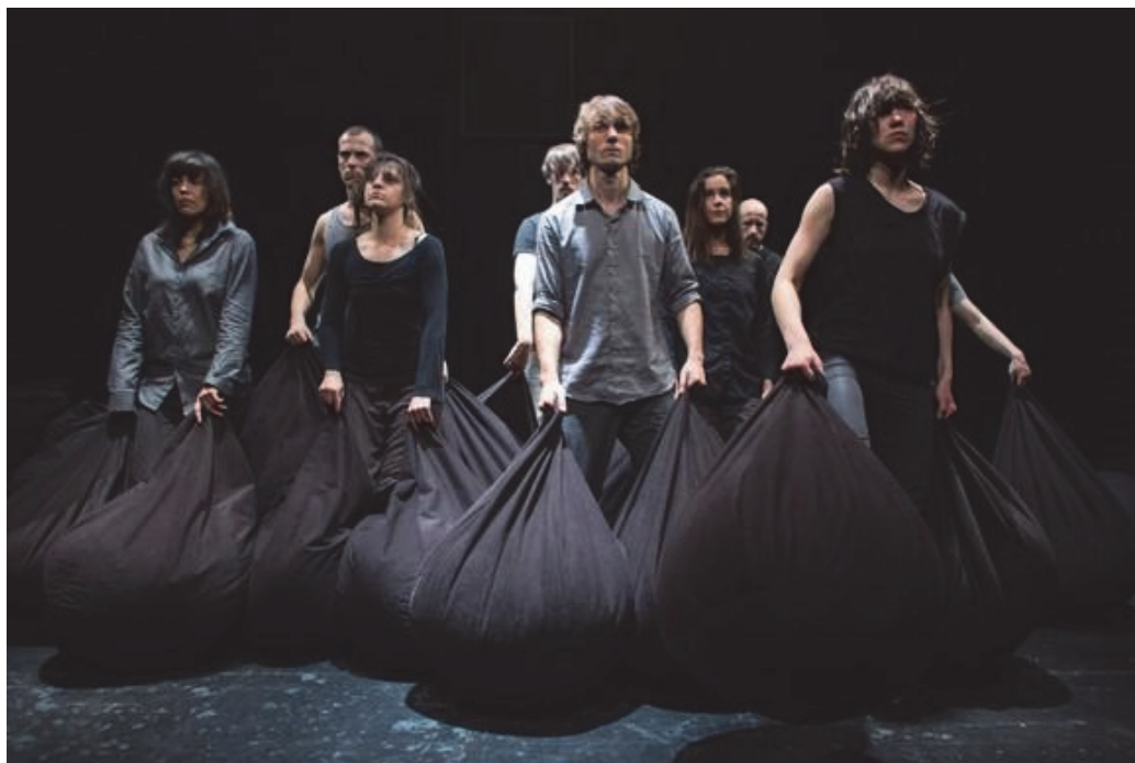
1. Schad/Božić, Gradnja, foto: Gradnja, 2014.

Rad s materijalom (crnim vrećama punjenim kuglicama stiropora) temeljio se na istom principu – odnosu stanica i molekula. Iako je prethodno postojala koreografija, izvođači su ju usvajali organski 4 i izvodili bez striktnih ključeva za promjene, a svaka se izmjena idealno događala kada je određeni proces dosegao svoj organski kraj. Predstava preuzima princip kontinuirane izmjene gradnje i rušenja kao i princip kontinuiranog rada, iako tjelesnost izvođača nije utemeljena na voljnome radu, odnosno racionalno utemeljenom „inputu“ nego na specifičnom tjelesnom tijeku koji se mijenja iz jednog dijela predstave u drugi. Uspostavljenje nevoljnog djelovanja je možda bio najteži dio, paradoksalno, budući da pretpostavlja odustajanje od racionalnog, kontroliranog stanja i zahtijeva otvaranje prema procesu. To je postignuto ciljanim radom na hara području i uspostavom specifičnog unutarnjeg ritma iz kojega je proizašla jača osjetljivost prema grupi. Popuštanjem kontrole nad tijelom, dok tijelo ostaje potpuno prisutno u pokretu, postignut je specifičan tip energije zajedništva. Rad sa skeniranjem tijela kao i razvojem tjelesne osjetljivosti ciljano otvara drugu razinu vibracijske otvorenosti koja je bila osnova izvedbe.