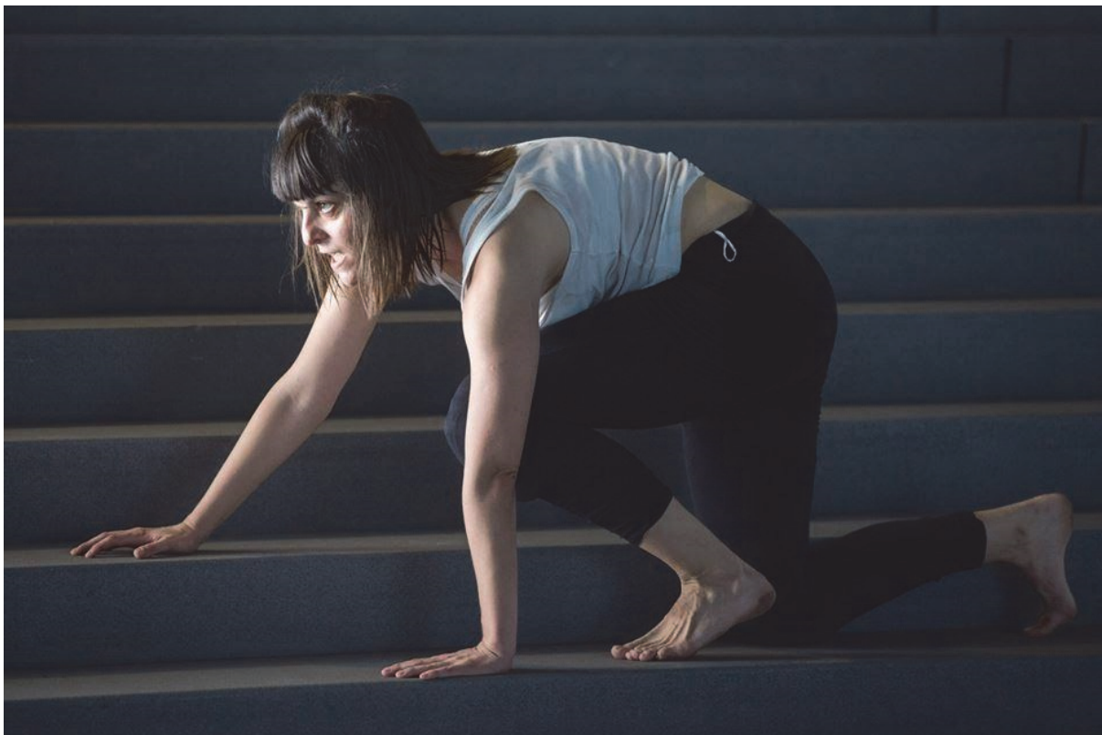
16. Horror Vacui , Muzej suvremene umjetnosti, foto: Tomislav Jagar, 2018.