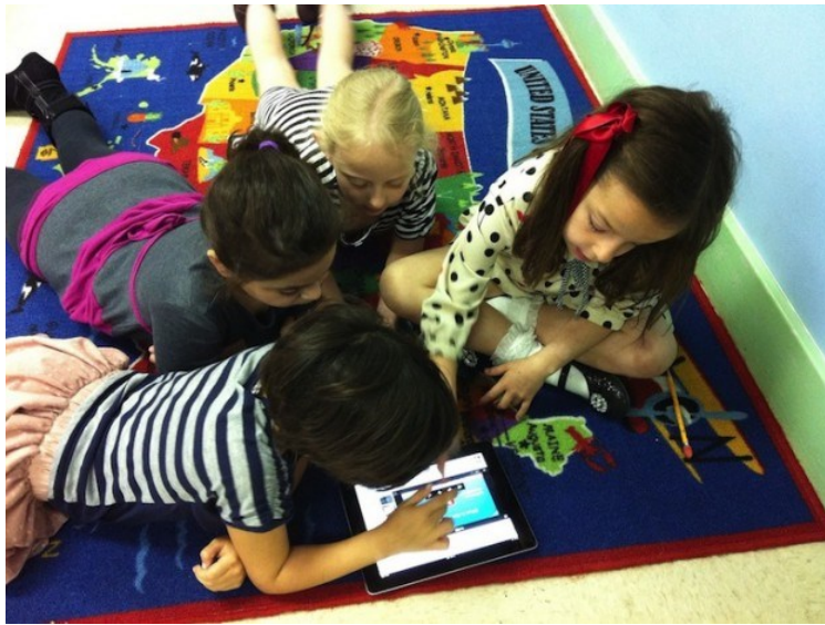
Slika 5. Medijska pismenost predškolskog djeteta

Kako tehnologija ima sve veću ulogu u obrazovanju (sve više se koriste računala, tableti i aplikacije za učenje), sve važnije postaje naučiti djecu kako se koristiti ovim različitim vrstama medija. Medijska pismenost ili sposobnost korištenja različitih vrsta medija i razumijevanja njihove poruke dolazi u fazama, a za djecu u dobi od tri do pet godina stječu se "osnovne vještine" (slika 5).