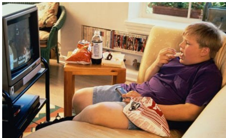
Slika 8. Mediji i pretilost

Budući da televizija i drugi mediji oduzimaju vrijeme za igru i tjelesnu aktivnost, djeca koja gledaju puno televizije slabije su fizičke spremnosti i vjerojatnije će jesti snack-hranu s puno masnoće. Gledanje televizije daje značajan doprinos pretilosti jer reklame u udarnom terminu promoviraju nezdravu prehranu. Sadržaj masti u reklamiranim proizvodima premašuje trenutnu prosječnu prehranu i nutricionističke preporuke, a većina reklamiranja hrane odnosi se na visokokaloričnu hranu poput brze hrane, slatkiša i preslađenih žitarica. Reklame za zdravu hranu čine samo 4% reklama za hranu koje se prikazuju tijekom dječjeg gledanja. Broj sati gledanja televizije također odgovara povećanom relativnom riziku od povišene razine kolesterola u djece (slika 8). 12