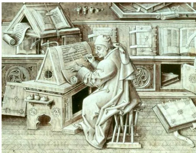
Slika 1. Srednjovjekovno izdavanje knjiga

Prije četrdeset tisuća godina neki su ljudski preci slikali na zidovima špilje na indonezijskom otoku Sulawesi ostavljajući otiske ruku i druge oznake. Špilje u Francuskoj i Španjolskoj datirane su nekoliko tisuća godina kasnije. Stručnjaci ne znaju točno koju je svrhu umjetničko djelo imalo, ali neki sugeriraju da bi mogli biti prvi primjeri komunikacije putem medija (slika 1). 3