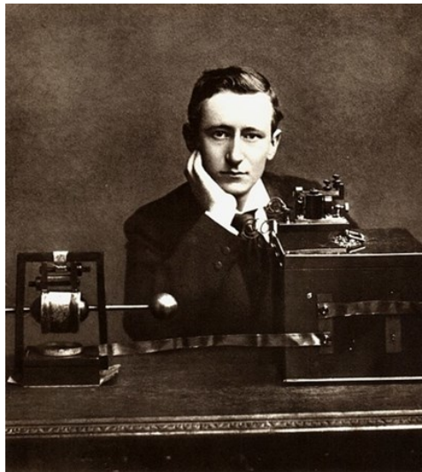
Slika 2. Guglielmo Marconi

Dolazak fotografije promijenio je medijsku scenu, a 1862. godine Matthew Brady održao je izložbu fotografija koje je snimio iz američkog građanskog rata. Krajem 19. stoljeća nova tehnologija omogućila je novinama ispis fotografija, dok su 1895. godine braća Lumière održala prvu javnu demonstraciju pokretnih slika u Parizu. Samuel Morse izumio je svoj kod 1835. godine koji se sastojao od niza točaka i crtica, što se moglo poslati niz telegrafsku žicu i primiti na drugom kraju. U prosincu 1901. godine talijanski izumitelj Guglielmo Marconi podigao je radio antenu pričvršćenu za zmaja na Signal Hillu, St. John's, Newfoundland (slika 2). Radio signal primio je iz Cornwalla u Engleskoj, udaljenog 3.400 km. Sada je bila moguća trenutna komunikacija bez žica ili kabela. Pet godina kasnije, kanadski izumitelj Reginald Fessenden prenio je govor preko Atlantika. 3