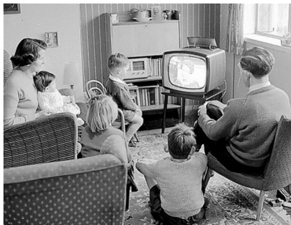
Slika 3. Počeci televizijskog emitiranja