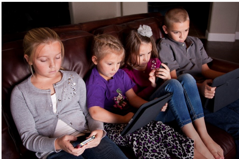
Slika 6. Izloženost predškolskog djeteta medijima

U današnje vrijeme čak i djeca predškolskog uzrasta odrastaju u okruženjima zasićenim internetom, računalima i video igrama koji im snažno privlače pažnju. Prema američkom istraživanju, postotak djece u dobi od 0–8 godina koja koriste mobilni uređaj povećao se s 38% u 2011. na 72% u 2013. godini. Smartphone je uređaj koji se najčešće koristi s različitim mobilnim aplikacijama (slika 6). 10