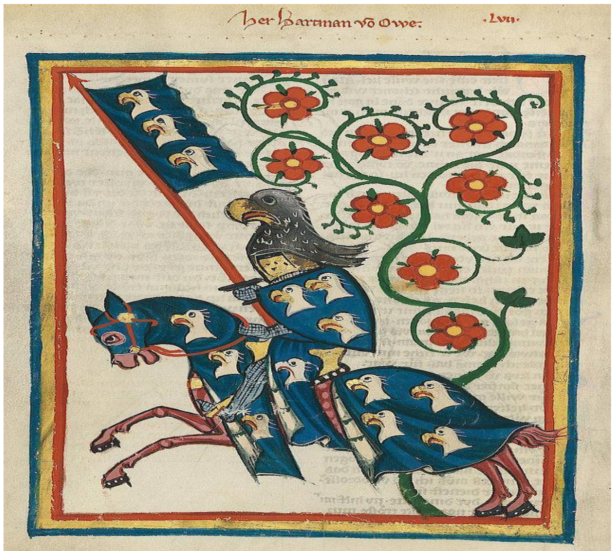
Bild 2: Idealbild mittelalterlicher Ritter: Hartmann von Aue (um 1300)