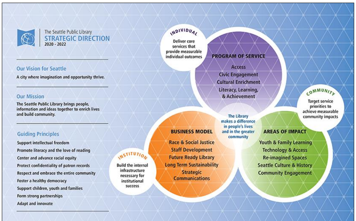
Slika 1. Strateški pravci razvoja narodne knjižnice u Seattleu