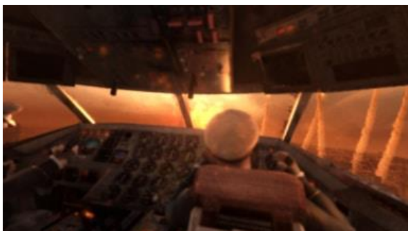
Scena kada bombe padaju na Moskvu netom pred pad aviona.

Drugi primjer je trenutak pronalaska srušenog aviona, u kojem Artem nalazi raspadnuta ljudska tijela te dobije vizije pada aviona kroz oči putnika i kroz oči posade, što rezultira prilično dramatičnim i emotivnim scenama. ( Metro: Last Light )