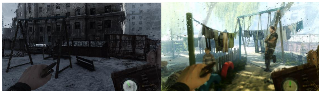
Prikazi apokaliptične Moskve, i vizija trenutka kada su nuklearne bombe padale na Moskvu.