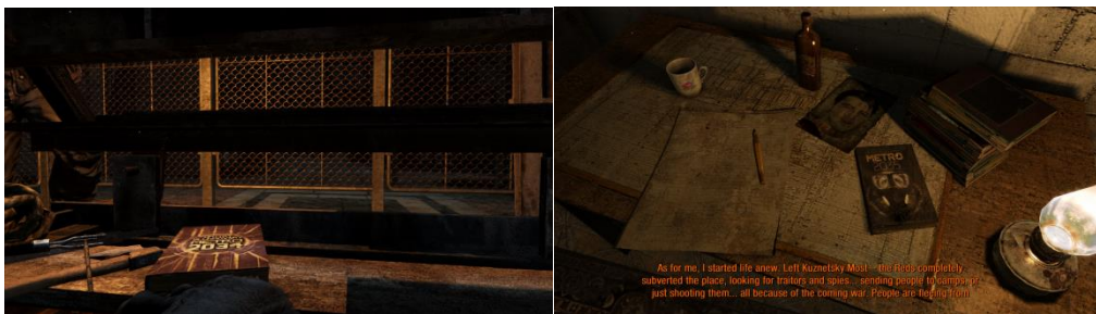
Scene iz igre u kojima se prikazuje fizička verzija knjige

Nadalje, još jedan primjer jest već spomenuta činjenica da je svaki kupac Steam (platforma za video igre) verzije ove igre, uz igru dobio i besplatnu e-book verziju Metro: 2033 (2007) (Ellison). Također, u Metro: Exodusu (2019) se najlakša težina igranja igre naziva „čitateljeva razina“. Ova razina najviše prašta i omogućuje i početnicima u svijetu video igara da se okušaju u igranju i saznaju i ovaj segment priče o Metrou, a poznato je da je upravo sposobnost igranja video igara jedna od velikih prepreka ljudima koji nisu „digitalni domoroci“. Gluhovskij vidi veliku budućnost u ovoj formi, pa je tako i napomenuo kako bi on u budućnosti volio vidjeti klasike kao što su Zločin i kazna i Rat i mir u formatu video igara kako bi se potaknuo interes za čitanjem knjiga, pošto tvrdi da se video igre mogu koristiti kako bi se došlo do publike koja je do tog trenutka bila nedostupna zbog izoliranosti od književnosti kao medija koji ne konzumiraju te čak tvrdi da postoji veliki broj djece u Rusiji koji nikada ne bi čitali da nisu postojale knjige koje se temelje na igrama i obrnuto (Garratt).