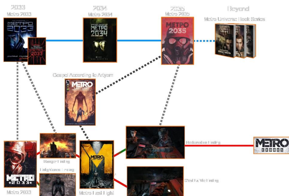
Prikaz suodnosa knjiga i video igara iz svijeta Metroa ( https://metrovideogame.fandom.com/wiki/Events )

U međuvremenu je Gluhovskij dao slobodu svim autorima na svijetu da preuzmu njegov svijet i adaptiraju ga na vlastito mjesto radnje i okolnosti specifične za njihovo društvo, pa je tako od 2009. do 2020. izdano preko 60 romana i priča, napisanih od strane različitih autora, smještenih po cijelome svijetu, od različitih dijelova Rusije do Italije, Velike Britanije, Poljske itd., koji se odvijaju u isto vrijeme kad i radnja romana Dmitrija Gluhovskoga. Gluhovskij je s posljednjom knjigom završio svoj doprinos svijetu Moskovskog metroa u vidu knjiga i igara te je predao potpunu autonomiju za razvoj daljnjih igara studiju 4A Games koji je razvio sve prethodne igre, što počinje s igrom Metro: Exodus -a (2019) pa nadalje u svim budućim naslovima. Uzevši u obzir popularnost posljednje igre i odlične reakcije kritičara, velika je šansa da će novi nastavci video igara nastaviti izlaziti, dok se Gluhovskij okrenuo drugim projektima koji su uglavnom nepovezani s Metro -om.