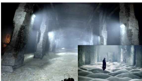
Metro: Exodus (2019) i Stalker (1979)

Odavanje počasti filmu Stalker (1979) Andreja Tarkovskog: