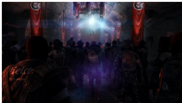
Scena iz filma 1984 (1984) i Metro: 2033 REDUX (2013)

Odavanje počasti filmu Stalker (1979) Andreja Tarkovskog: